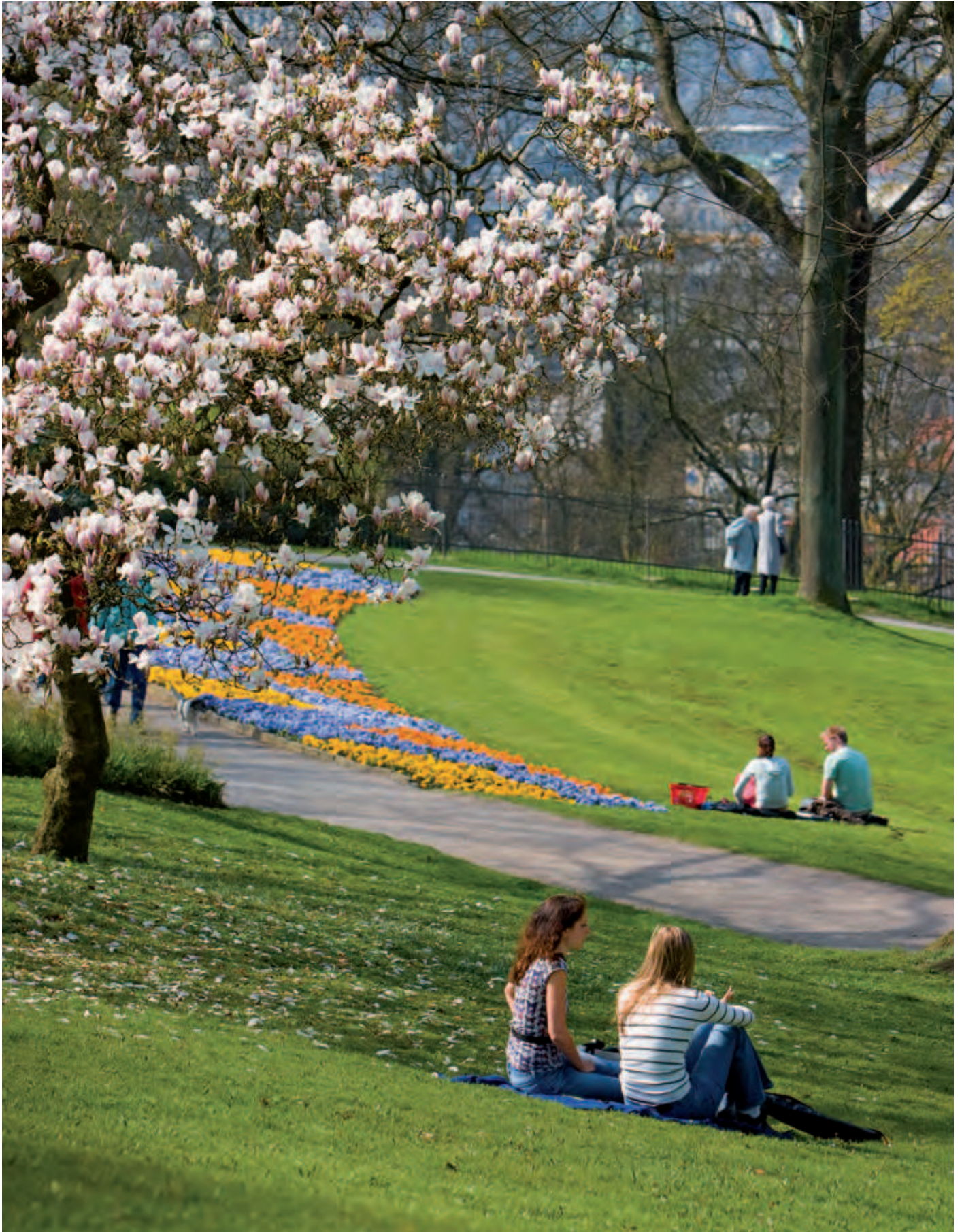
Frühlingserwachen auf der Wuppertaler Hardt.