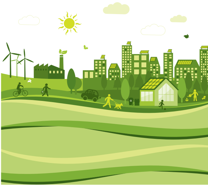
26 Wie der Landesentwicklungsplan 2025 Gewerbeflächen sichern soll