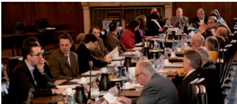
Einen Tag vor der Vollversammlung beschäftigte sich der Einzelhandelsausschuss mit dem Thema.