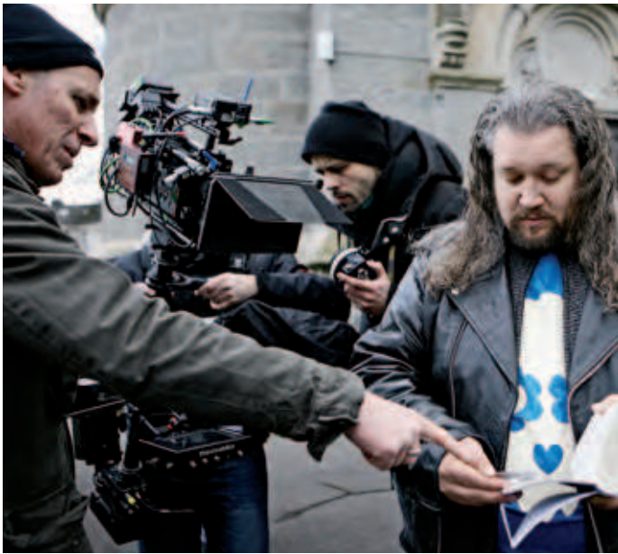
16 Filmstadt Wuppertal: Drehstart für „King Ping“