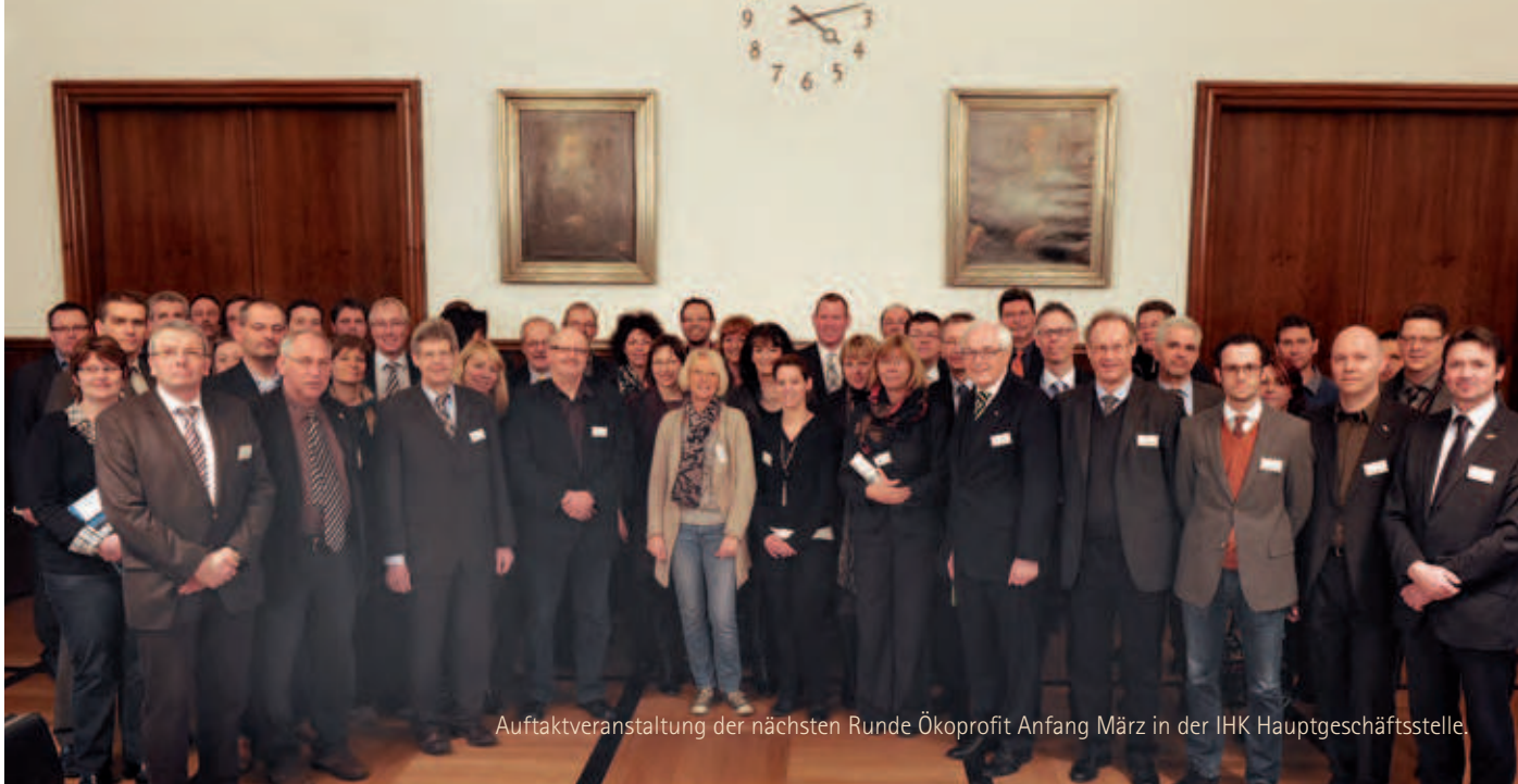
Auftaktveranstaltung der nächsten Runde Ökoprofit Anfang März in der IHK Hauptgeschäftsstelle.