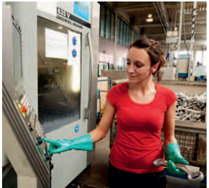
10 Ein starkes Stück bergische Wirtschaft: Die Automobilzulieferer