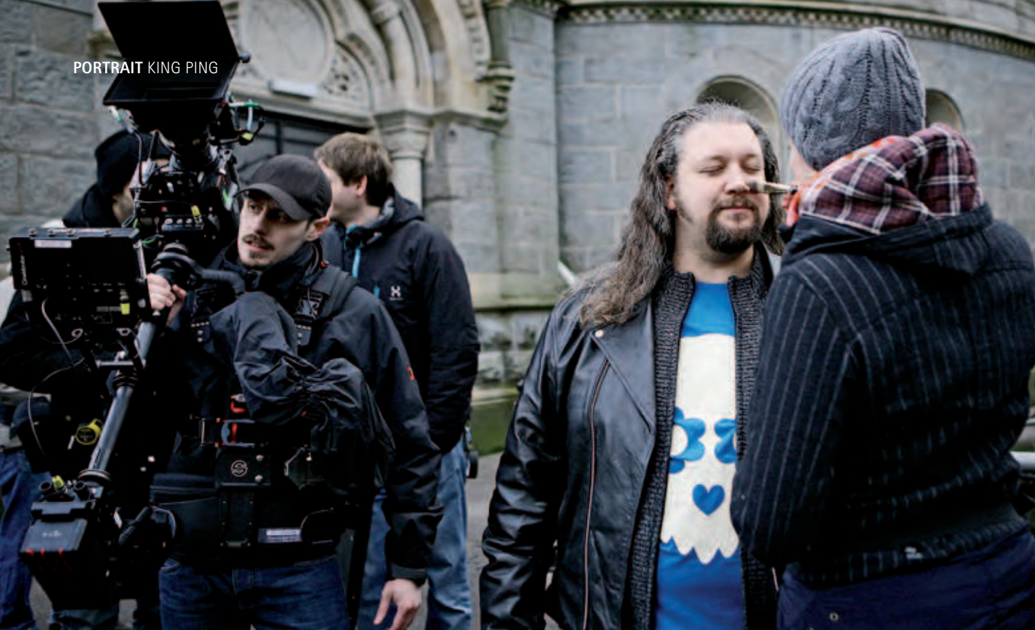
Sollen im Film gut aussehen: Die Schauspieler, aber auch die Stadt Wuppertal.

Förderung kam nicht – „King Ping“ muss mit „nur“ 250.000 Euro realisiert werden.