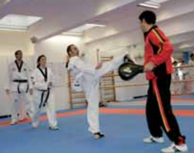
Die DSC-Jugend will eigentlich schon loslegen, muss aber die offizielle Eröffnung der neuen DSC-Hallen abwarten.