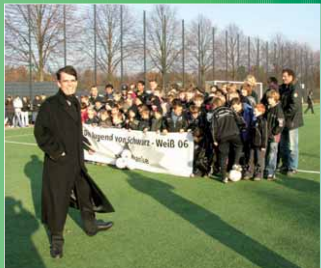
OB Erwin übergibt sanierte Sportanlagen an Schwarz-Weiss (oben) und TUS Nord.

Mit diesen umfangreichen Investitionen sind bisher insgesamt rd. 140 Mio. Euro für die Sanierungen, Umbauten und Erneuerungen von Sportanlage aufgewendet worden. In Deutschland sind diese Bauaktivitäten für die Infrastruktur des Sports beispiellos. Wie Oberbürgermeister Erwin durchblicken ließ, wird Düsseldorf die Anstrengungen auch in den nächsten Jahren fortsetzen und damit neben den Maßnahmen vor allem im Schul- und Kulturbereich auch dem Sport eine optimale Ausstattung an Sportstätten zu geben bzw. zu bewahren.