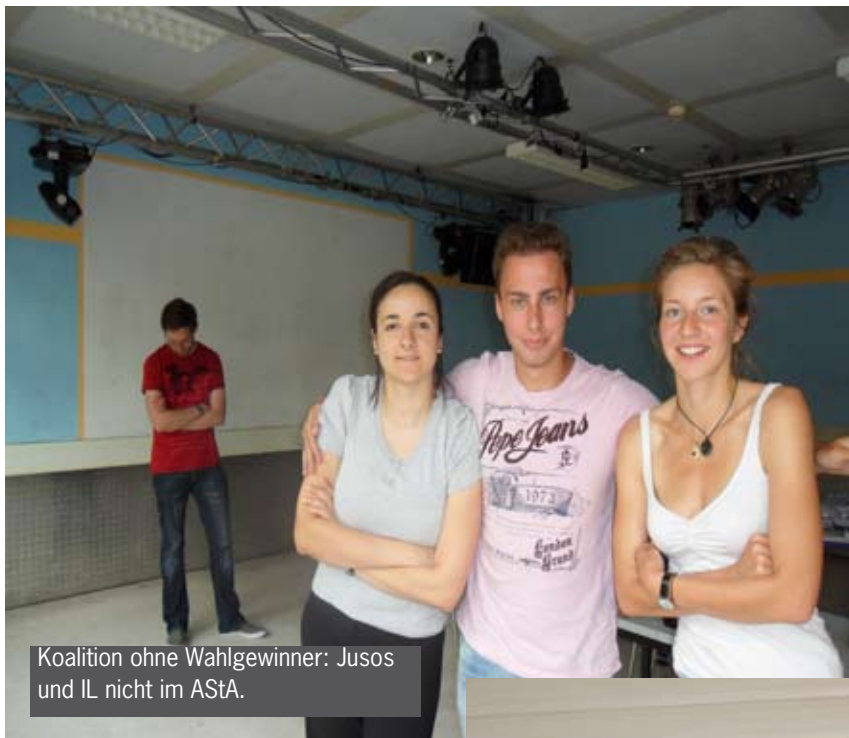
Koalition ohne Wahlgewinner: Jusos und IL nicht im AStA.

geplatzter Fahrradschlauch. Währenddessen werden die neuen Unizeiten beschlossen, die Mittagspause fällt ab sofort aus. Die KLS will 50 000 Euro Studiengebühren für Überwachungskameras ausgeben. Schon jetzt kann man den gesamten Campus im Internet betrachten, nur nicht in Echtzeit: Der virtuelle Campusrundgang à la Google Streetview hält Einzug auf der Uni-Homepage.