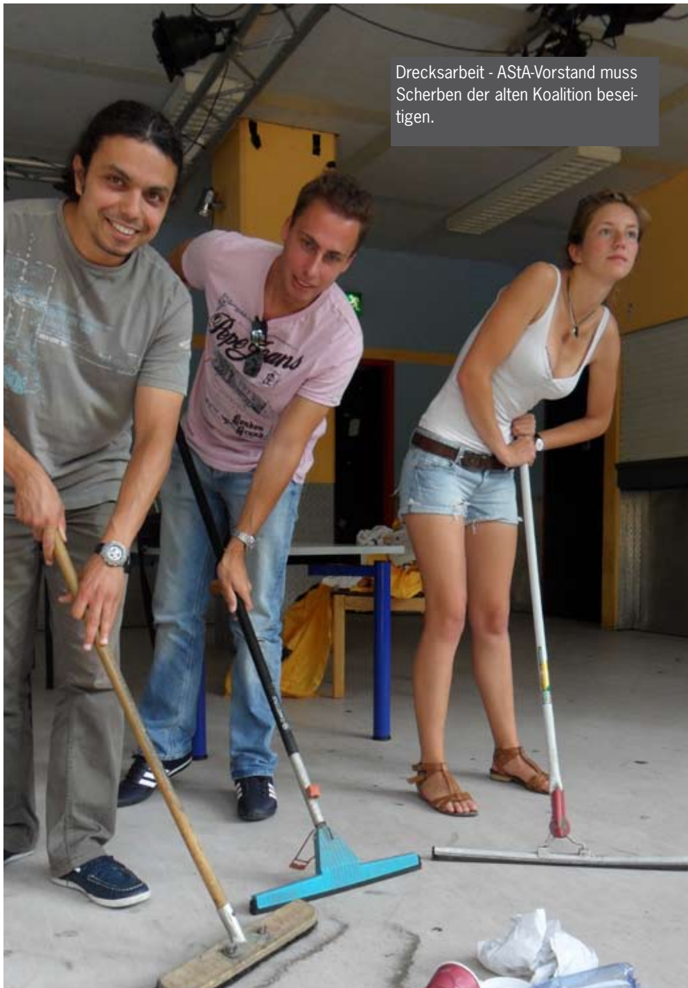
Drecksarbeit - AStA-Vorstand muss Scherben der alten Koalition beseitigen.

Der Unialltag zeigt sich von alledem unbeeindruckt: Der Außenminister a.D. Hans-Dieter Genscher spricht