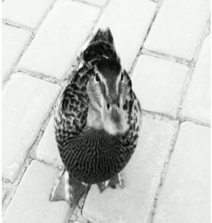
Edith vom Teich zur Universität.