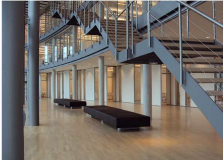
Die schwebende Treppe des Oeconomicum.

Kürzlich hat uns in der Redaktion ein Leserbrief erreicht, der ausnahmsweise nicht die Campus Delicti sondern das neuerbaute Oeconomicum kritisiert. Man wollte uns auf Tücken und Fehler des Prachtbaus hinweisen, die den meisten Studenten unbekannt sind. Der Verfasser des Briefes, ein BWL-Student, nahm sich mit der Kritik des neuen Gebäudes nicht zurück: Der Fußboden sei „vermakelt“, Blumen verboten und Plakatieren der Wände untersagt. Unser erster Gedanke war, wieso sich ein Student Blumen in seiner Fakultät wünscht. Ist diese Kritik überhaupt ernst zu nehmen? Doch weiter im Leserbrief beschreibt der BWLer: „Dann gibt es in den Seminarräumen auch noch fest installierte Beamer, die nicht benutzt werden können, weil vergessen wurde das die Leinwände elektrisch sind und so haben diese keinen Stromanschluss.“ Das ist doch ein schlechter Witz, oder? Selbst die Beamer in der Phil.Fak oder in der Math.Nat sind funktionsfähig – und in diese Gebäude wurden keine Millionen investiert. Ein anderer Punkt, der auch uns schon aufgefallen war, ist die zer-