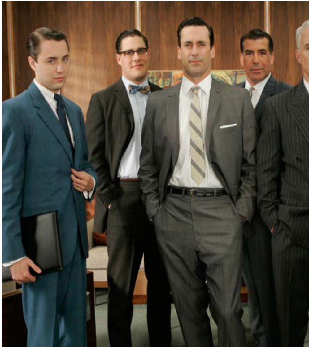
Die Mad Men arbeiten in einer Werbeagentur der 60er.

halblegale Streaming-Dienste – zeitunabhängig und meist in der Originalsprache, Englisch. Man fühlt sich immer schrecklich individuell und gehört doch einer gewissen Community an, freut sich diebisch, wenn man durch Zufall Gleichgesinnte findet. Genauso groß dann die Begeisterung für eine „neue“: Ist man einmal angesteckt, so nach zwei bis