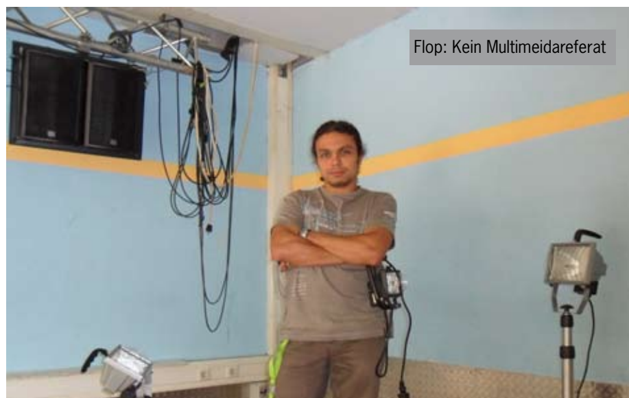
Flop: Kein Multimeidareferat

Campus D erklärt den arabischen Frühling in all seinen Facetten. Ausländische Studierende berichten aus ihrer Heimat, Dozenten analysieren die Lage und kritisieren deutsche Außenpolitik.