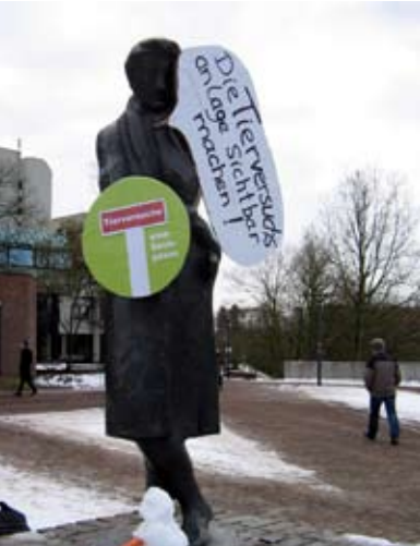
Tierschützer machten auch nicht vorm Heine Halt

Erneut haben Studierende gegen die Einrichtung an der HHU demonstriert.