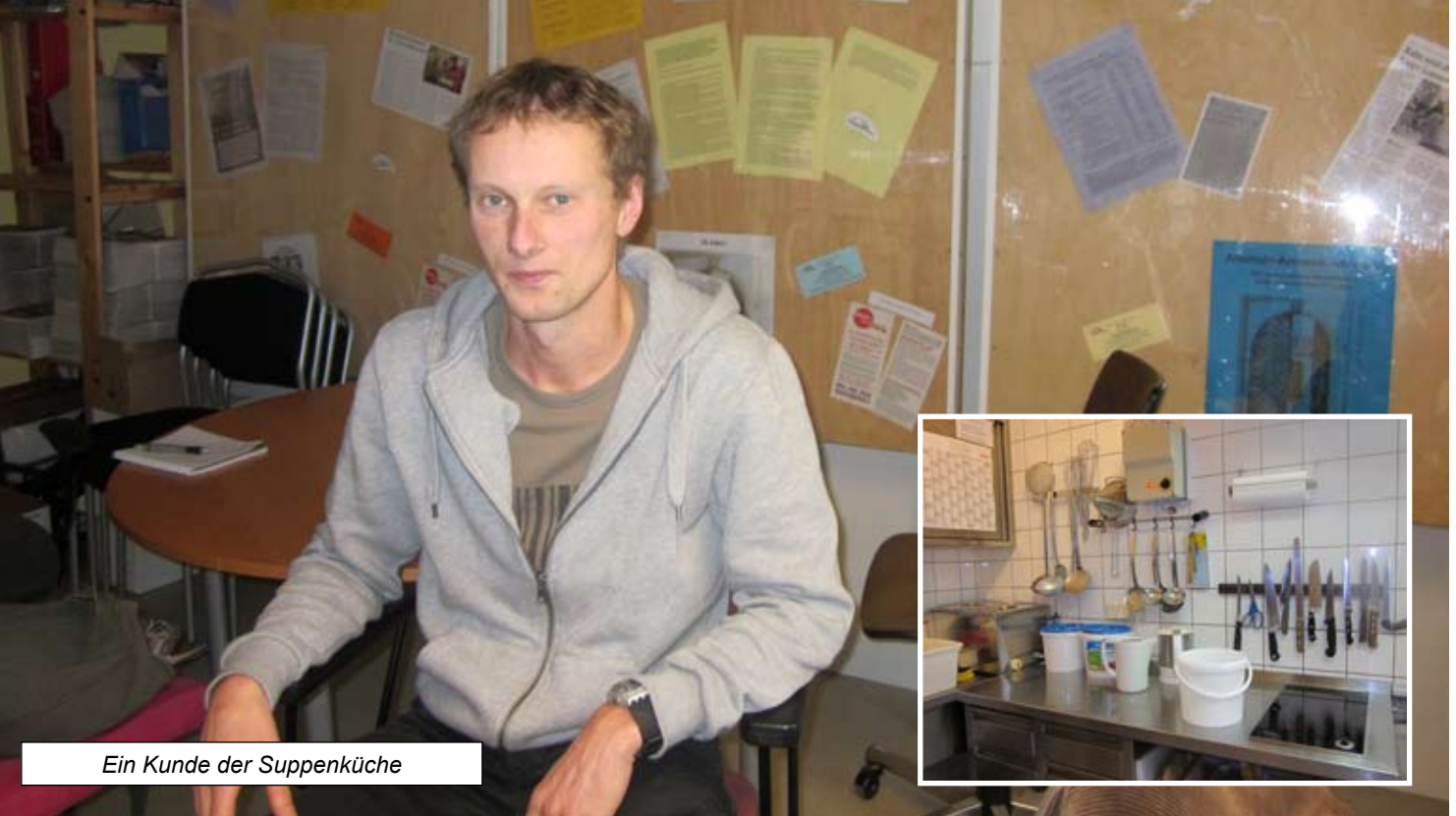
Ein Kunde der Suppenküche