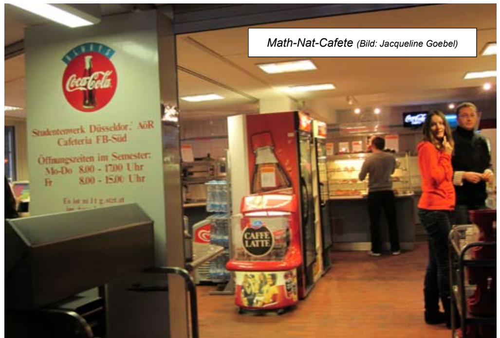
Math-Nat-Cafete