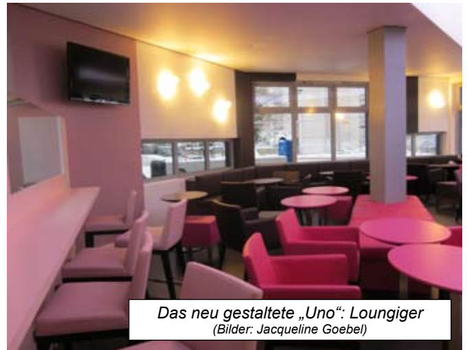
Das neu gestaltete „Uno“: Loungiger