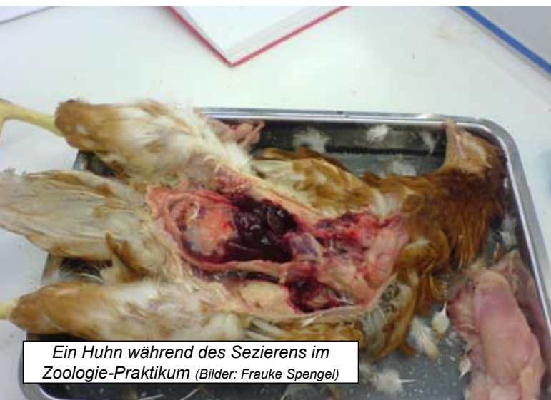
Ein Huhn während des Sezierens im Zoologie-Praktikum

In der Biologie müssen auch gegen eigene Überzeugungen Tiere seziert werden. Eine Betroffene berichtet.