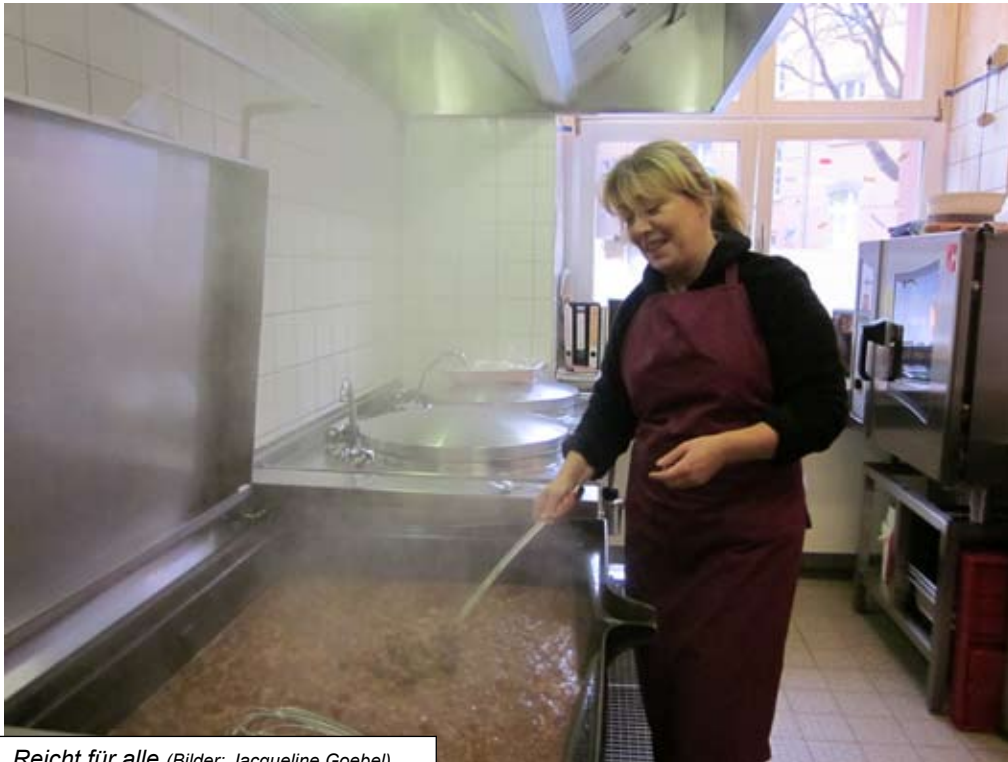
Reicht für alle

Wenn der Magen knurrt, bietet die Suppenküche Bedürftigen einen Ausweg