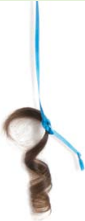
Der Familienmensch ...