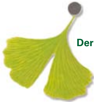
Der Naturverbundene ...