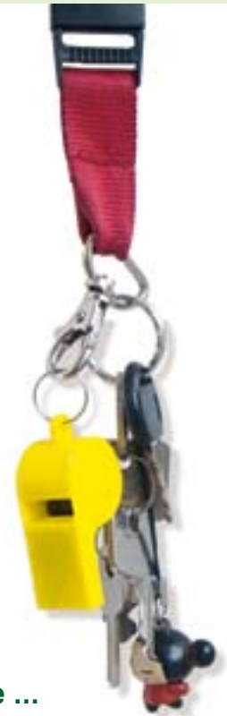
Der Aktive ...