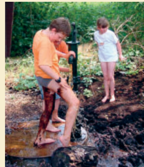
Nicht nur für Kinder ein Highlight bei der Wanderung durchs Moor – die Matschkuhle