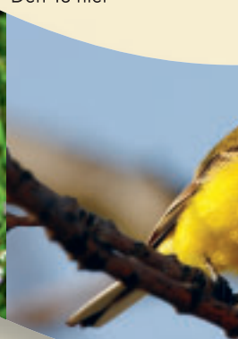
Fotos (H. Glader) v.l.n.r.: Brachvogel, Rosmarinheide, Lungenenzian (M. Luwe), Schafstelze, Grauheide, Schmalblättriges Wollgras