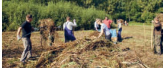
Wiesenmahd 2005