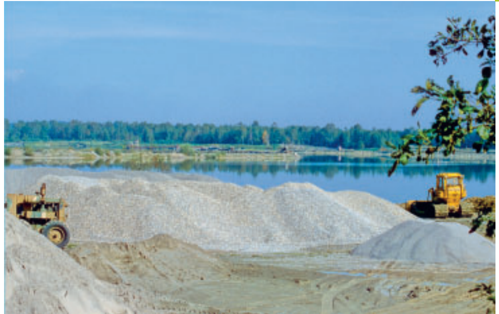
Kiesabbau