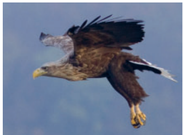
Seeadler