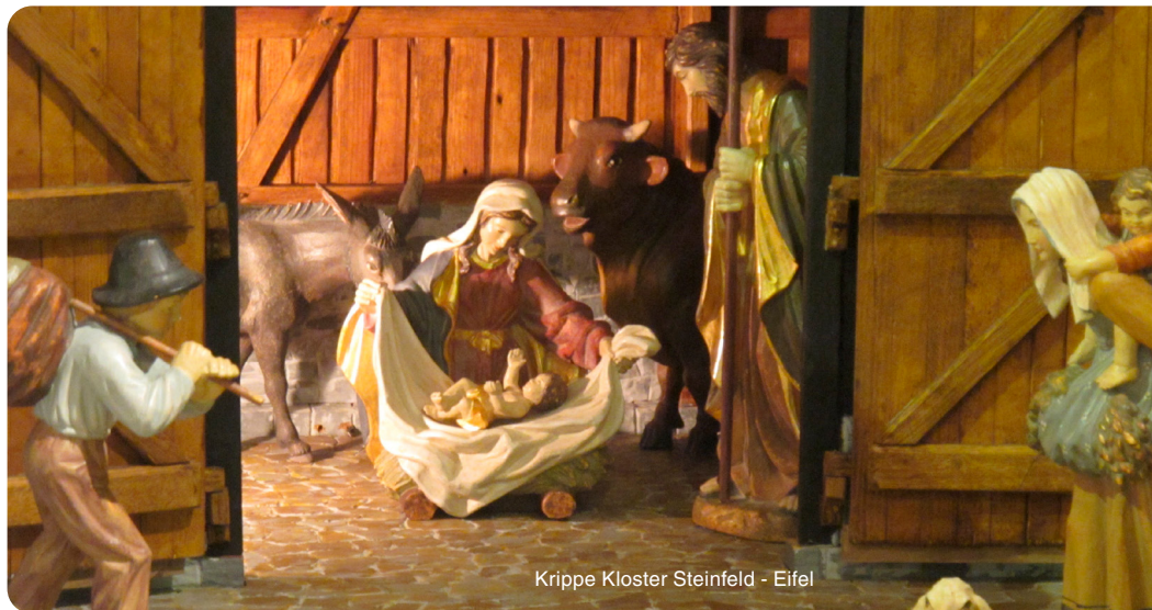
Krippe Kloster Steinfeld - Eifel

Berührend ist dann der Schlusschor der Kinder, der lange in den Ohren und Herzen aller nachklingen wird: „Gloria,