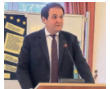
Nathanael Liminski.

Jüchen. Zum Wahlkampfabschluss konnte sich die CDU über hohen Besuch freuen. Der Minister für Bundes- und Europaangelegenheiten, Nathanael Liminski, besuchte die Union zu einer Diskussionsrunde im Haus Katz und kam mit den Mitgliedern ins Gespräch. Nach einem kurzen Impulsvortrag des Ministers nutzten die Mitglieder die Gelegenheit, mit Liminski ins Gespräch zu kommen und zu diskutieren. Dabei sprachen sie über Migration, Energiepolitik und die äußere Sicherheit. Im Anschluss kamen die Mitglieder bei kühlen Getränken ins lockere Gespräch und konnten sich vor der EU-Wahl austauschen. „Ich freue mich sehr, dass wir mit Nathanael Liminski einen Europa-Experten und Landesminister im Haus Katz begrüßen konnten. Für die Mitglieder und interessierten Bürger sind diese Möglichkeiten des Austausches besonders wichtig, um auch der Spitzenpolitik etwas mitgeben zu