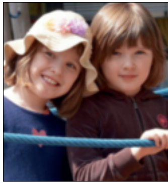
Sommerfest in der Kita „Villa Kunterbunt“.

In den verschiedenen Kita-Gruppen und der Turnhalle wurden zahlreiche Spiele angeboten, die mit Begeisterung von den Kleinen angenommen wurden. So galt es, einen Barfußweg mit Naturmaterialien zu erkunden. An einer Foto-Box konnte man sich mit verschiedenen Masken ablichten lassen. In einer anderen Gruppe wurden wiederum Experimente durchgeführt und Bastelarbeiten angeboten. Besonderer Andrang herrschte an der Tattoo-Ecke, wo sich die jungen Kitabesucher mittels Glit-