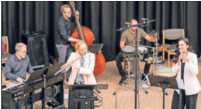
Workshops des Niederrhein Musikfestivals am Montag im Gymnasium Jüchen und der Gesamtschule.