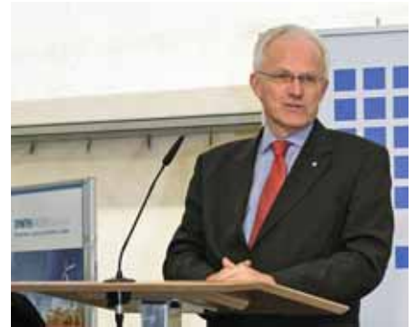
Ministerpräsident Dr. Jürgen Rüttgers nannte den Campus Melaten ein Jahrhundertprojekt.

Mit dem Ersten Spatenstich haben derweil Anfang März die Arbeiten an der Erweiterung des RWTH GYM begonnen. Durch das Kooperationsprojekt von RWTH, Hochschulsportzentrum und BLB NRW soll bis Oktober dieses Jahres die an der Eliteuni für Fitnesstraining zur Verfügung stehende Fläche auf 1100 Quadratmeter mehr als verdoppelt