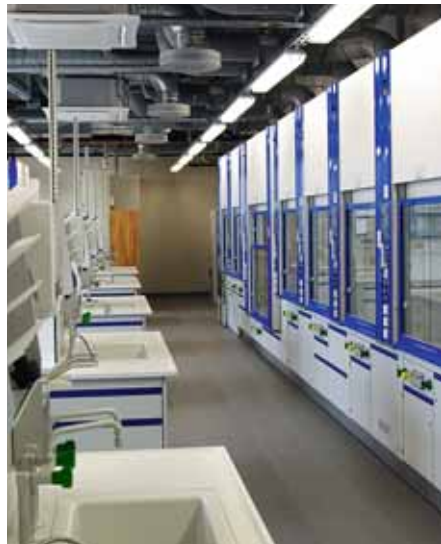
Am Standort Jülich der FH Aachen ist auch ein Labor für organische Chemie entstanden.