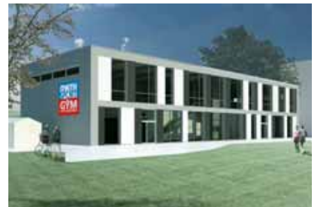
Das GYM der RWTH Aachen ist bei den Studierenden beliebt. Nun wird es erweitert.

werden. Damit wird dem Ansturm der Studierenden Rechnung getragen. Die Mitgliederzahlen sind seit Eröffnung des GYM im Jahr 2005 stetig gewachsen.