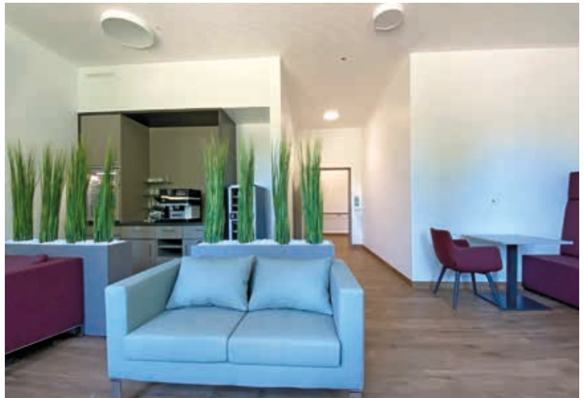
Blick in die Lounge im Wahlleistungsbereich des neuen Bettenhauses.

In diesem Jahr wurde der doppelstockige Neubau fertiggestellt. In den 31 großen und komfortablen Zimmern fühlen sich die Patienten wohl – trotz ihres gesundheitlichen Zustands, trotz ihrer Erkrankung und der vielleicht anstehenden Operation. Das war der Anspruch, mit dem der Neubau geplant wurde. Im Erdgeschoss des Neubaus befindet sich die Wahlleistungsstation mit acht Einzelzimmern.