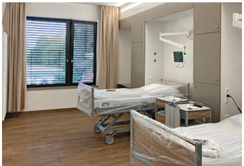
So sehen die wohnlich gestalteten Patientenzimmer des Wahlleistungsbereichs aus.