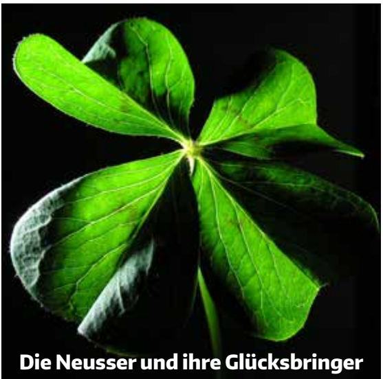
Die Neusser und ihre Glücksbringer

Lieblingshemd ihres vor 5 Jahren verstorbenen Mannes ein Kissen genäht, das immer in ihrem Bett liegt und ihr „wenigstens schöne Träume bereitet“, so die Seniorin. Insgesamt wurde bei der Umfrage deutlich, dass Glücksbringer nicht dafür da sind, dass alle Wünsche in Erfüllung gehen, sondern sie haben eher Einfluss auf die innere Haltung: Allein der Glaube daran, dass man mit einem Glücksbringer die Herausforderungen des Lebens besser meistern kann, gibt Kraft und mehr Selbstvertrauen. Und das kann bei Prüfungen, Ängsten oder schwierigen Alltagssituationen durchaus hilfreich sein. Und so tatsächlich für mehr Glück sorgen.