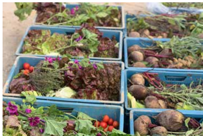
Gerettete Lebensmittel vom Lammertzhof