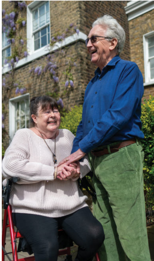
Im Hier und Jetzt leben, dankbar sein, für andere da sein – Wege zum Glück.

Dankbar zu sein, kann man lernen – zum Beispiel mit einem Dankbarkeits-Tagebuch, in welchem jeden Tag drei Sachen notiert werden, für die man dankbar sein kann. Das können große wie kleine Dinge sein. Vieles, was man