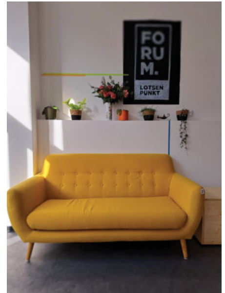
Gemütlich und einladend: das „FORUM.Lotsenpunkt“.

lichkeiten befand sich vorher über 100 Jahre die Gastwirtschaft „Zum Hirsch“. Diese Tradition soll auch im „FORUM.Lotsenpunkt“ als Ort der Gemeinschaft weiterbestehen. Es werden noch Bilder aus dem alten „Hirsch“ gesucht.