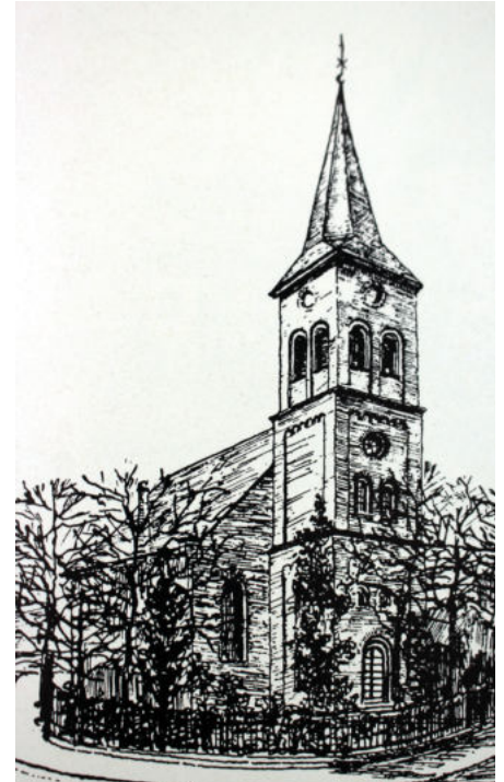
Die evangelische Stadtkirche: Zeichnung von Ernst Bierwirth um das Jahr 1925.

Wann die reformierte Gemeinde sich gründete, ist unbekannt. (Die Reformierten gehen auf Johannes Calvin zurück.) 1584 sind auf einer Synode in Aachen nach-