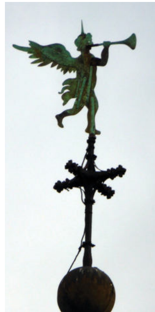
Der Posaunenengel auf der Turmspitze.

Vor der Westwand ist die Orgelbühne angebaut. Zierstück ist hier der reich geschmückte Prospekt der Orgel. Ratingen war seit etwa 1650 für fast 100 Jahre über die Stadtgrenzen hinaus durch seine Orgelbauwerkstätten bekannt. Eine davon gehörte der Familie Weidtmann, die über mehrere Generationen viele Orgeln im Bergischen Land, am Niederrhein und