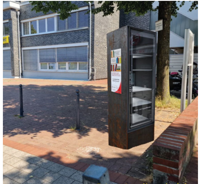
Am ev. Gemeindezentrum in Hösel soll der öffentliche Bücherschrank aufgestellt werden.

und eingeweiht wurde, begannen die Planungen für die Aufstellung eines vierten Bücherschranks im Stadtteil Hösel. Dieser öffentliche Bücherschrank soll auf dem Grundstück der Evangelischen Kirchengemeinde Hösel angrenzend an das Hösel-Center stehen. Die Zustimmungen der Ev. Kirchengemeinde, die dieses Projekt aktiv unterstützt, und des Planungsamtes der Stadt Ratingen liegen vor. Die Realisierungsphase kann also starten. Nun muss die Finanzierung von rund 8000 Euro sichergestellt werden. Zur Umsetzung ist die Dumeklemmerstiftung auf Spenden angewiesen (Konto DE26 3345 0000 0042 1990 91 bei der Sparkasse