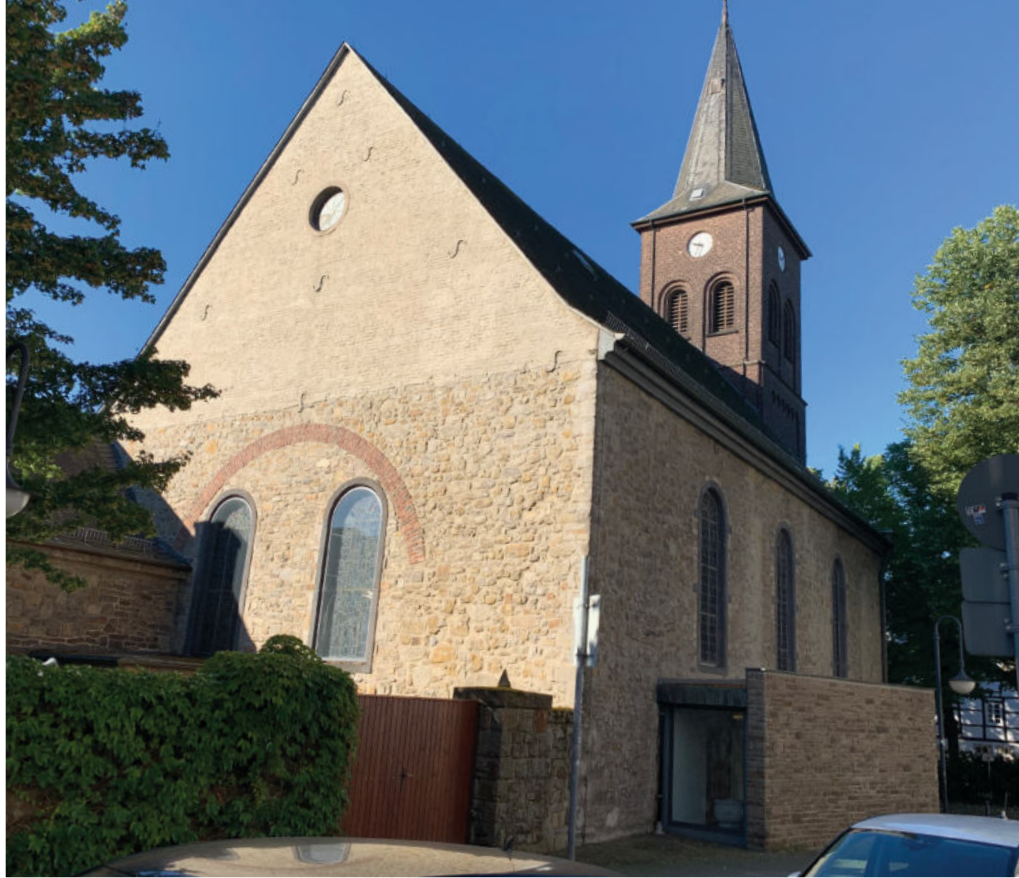
Der Bogen über den Fenstern an der östlichen Wand wurde 1685 zugemauert und ist heute noch gut erkennbar. Hier war möglicherweise ein Chorantbau geplant.

Erst 1856 wurde der 33 Meter hohe Kirchturm gebaut. Er wurde in Ziegelbauweise errichtet und