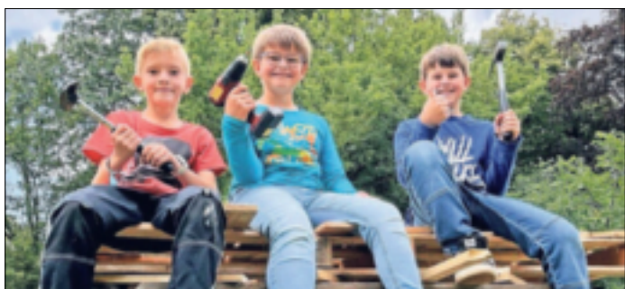
Alle hatten sichtlich Spaß beim Bauspielplatz.