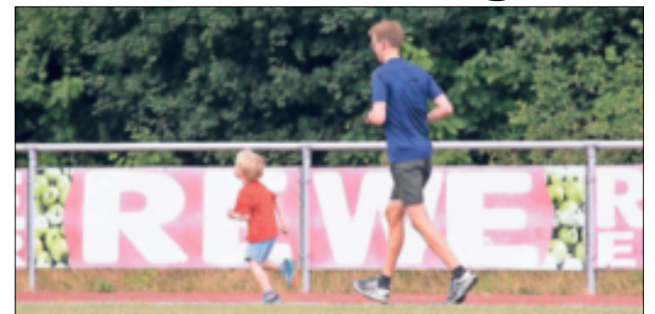
Gemeinsam macht das Laufen gleich noch mehr Spaß.

Jüchen. Der Jüchener Sportabzeichentag verlief sehr erfolgreich. Insgesamt haben 60 Sportler teilgenommen, wobei 35 das Sportabzeichen komplett (25 Kinder, elf Erwachsene) abgelegt haben. Nach den Jahren der Pandemie ist der Vorstand des Stadtsportverbandes (SSV) sehr zufrieden mit dem diesjährigen Event. Alle Beteiligten in der Organisation und andere Teilnahme des Sporttages waren sehr ambitioniert unterwegs. Das Deutsche Sportabzeichen ist die höchste Auszeichnung außerhalb des Wettkampfsports und wird für überdurchschnittliche körperliche Leistungsfähigkeit verliehen. Neben dem Schwimmnachweis werden verschiedene motorische Grundfähigkeiten je nach Geschlecht und Alter berücksichtigt. Das Motto des SSV „Jüchen bewegt sich“ ist voll und ganz aufgegangen. Die äußeren Rahmenbedingungen waren sehr gut, auch dank der Unterstützung vieler ehrenamtlicher Helfer aus den Jüchener Vereinen TV Jüchen, Radfahrverein Adler Hochneukirch, SGGierath, TV Hochneukirch, VfL Viktoria Jüchen-Garzweiler und VfL Otzen-