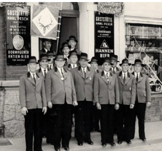
Die Gründer der Gesellschaft vor dem ehemaligen Gertrudenhof

So etwa fahren die Männer in jedem Jahr einmal gemeinsam zu einer Brauerei-Tour und gemeinsam mit den Frauen wird ein Hubi-Fest gefeiert. Diese Festlegung gefällt allen besser als ein Mix von Jung und Alt in einem Zug. Das alles garantiert einen langfristigen Bestand.