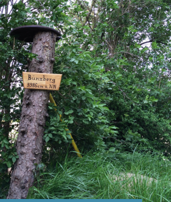
Bünzberg mit „Gipfelpanorama“