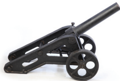
Kanone aus 1921/22