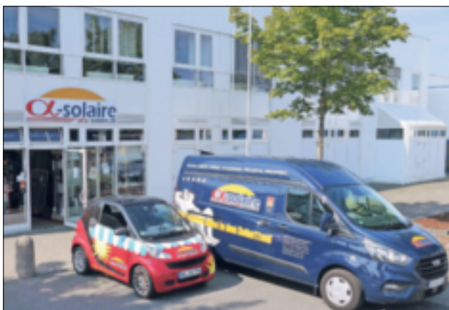
Alfa-Solaire sucht Verstärkung für sein Team.

Alfa-Solaire An der Zuckerfabrik 1 (Am Toom-Baumarkt) 41516 Grevenbroich Tel.: 02181/ 8183523 www.alfa-solaire.de