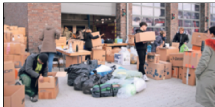
Innerhalb kürzester Zeit kamen zahlreiche Spenden in Hochneukirch zusammen, die von engagierten Helfern sortiert, verpackt und für den Transport aufgelistet wurden.

Gottfried Schultz Grevenbroich Lilienthalstr. 6, 41515 Grevenbroich, 02181 2337-0 GOTTFRIED SCHULTZ