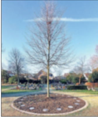
Auf dem Friedhof Bedburdyck können Verstorbene an diesem Baum ihre letzte Ruhe finden.

Bedburdyck. Die Friedhofskultur befindet sich im Umbruch. Der Trend zur Urnenbestattung hält weiter an. Die Friedhöfe sind Orte der persönlichen Trauer und der individuellen Erinnerung und Einkehr, werden aber auch immer mehr zu Stätten der Erholung. Im Rahmen des Projektes „Friedhof der Zukunft“ bietet die Stadt Jüchen daher ab sofort Urnenbeisetzungen an einem Baum auf dem Friedhof in Bedburdyck an. Insgesamt stehen zwölf Urnenwahlgräber und sechs Urnenreihengräber zur Verfügung. Folgende Grabarten werden angeboten: