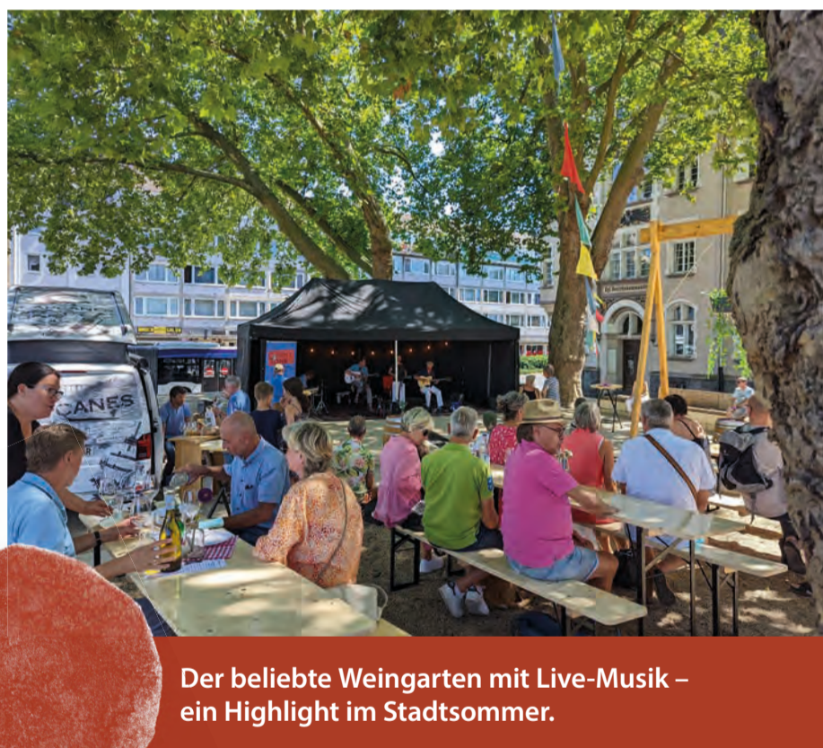
Der beliebte Weingarten mit Live-Musik – ein Highlight im Stadtsommer.