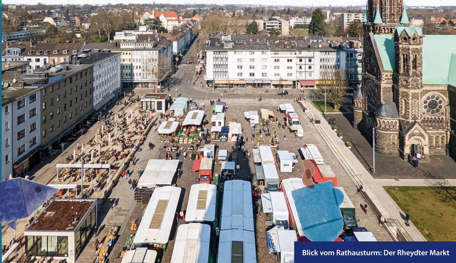
Blick vom Rathausturm: Der Rheydter Markt