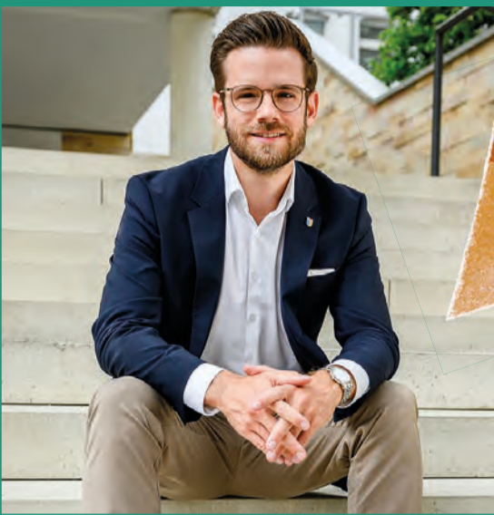
Liebe Mönchengladbacherinnen, liebe Mönchengladbacher,

Folgen Sie der Stadt auf: www.facebook.com/StadtMoenchengladbach www.twitter.com/StadtMG www.instagram.com/stadtmoenchengladbach www.youtube.com,StadtMoenchengladbach