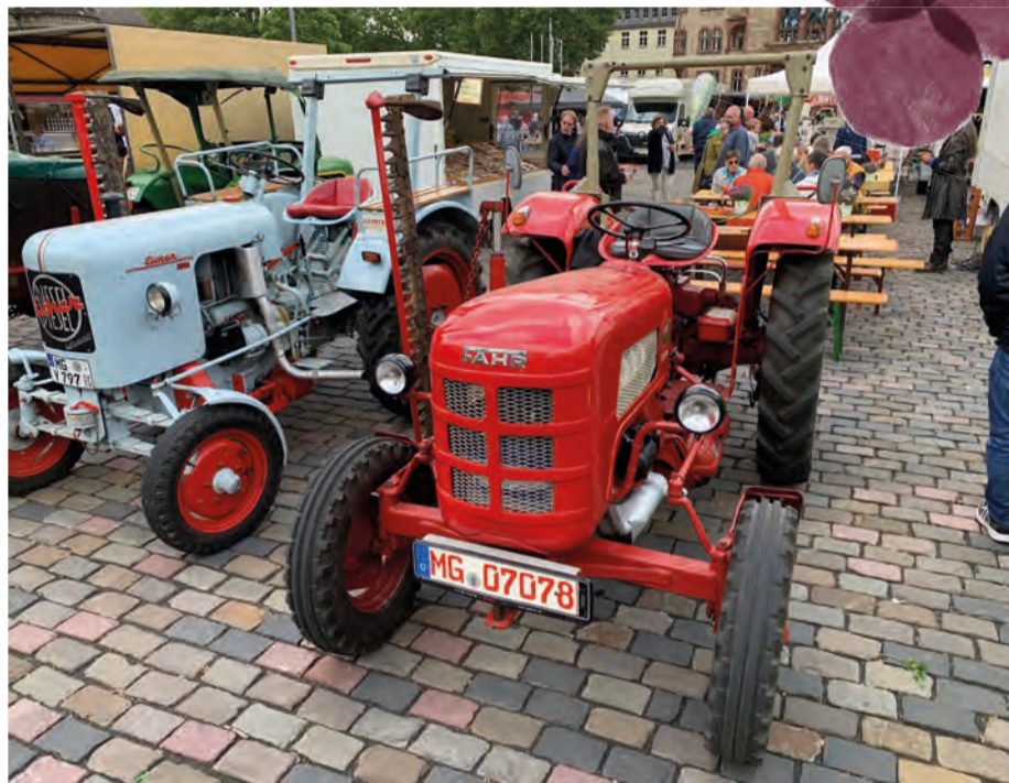
Hingucker! Die historischen Trecker beim Markt-Picknick.