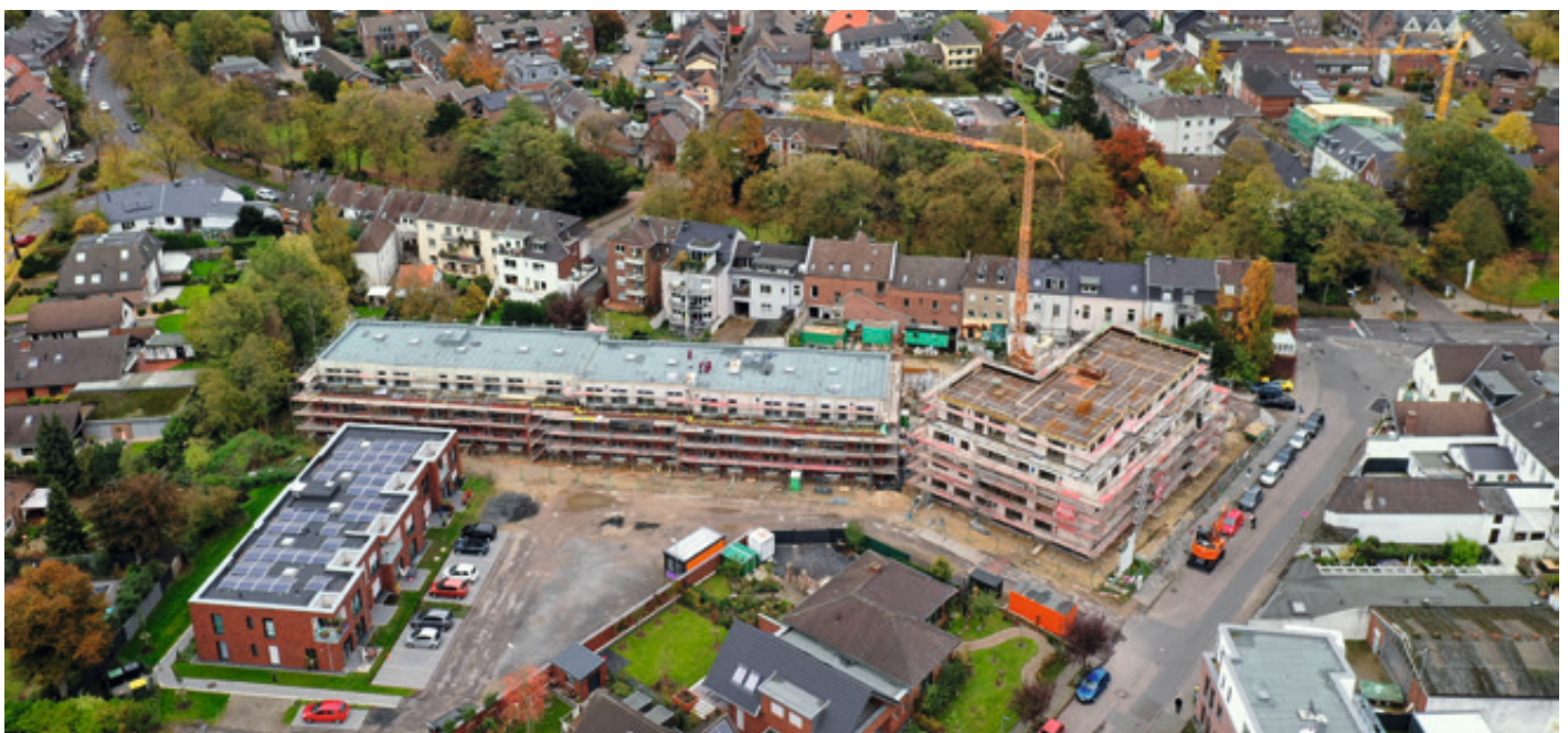
Der Neubaukomplex der GWG am Heyerdrink in Kempen: Links ist das rot verklankerte Gebäude zu erkennen, dessen Mietwohnungen bereits bezogen sind.

Die Fertigstellung auf der Großbaustelle erfolgt stufenweise und ist im letzten Abschnitt zum dritten Quartal 2020 vorgesehen. Das Kostenvolumen des gesamten Bauvorhabens beträgt rund 13,5 Mio. EUR.