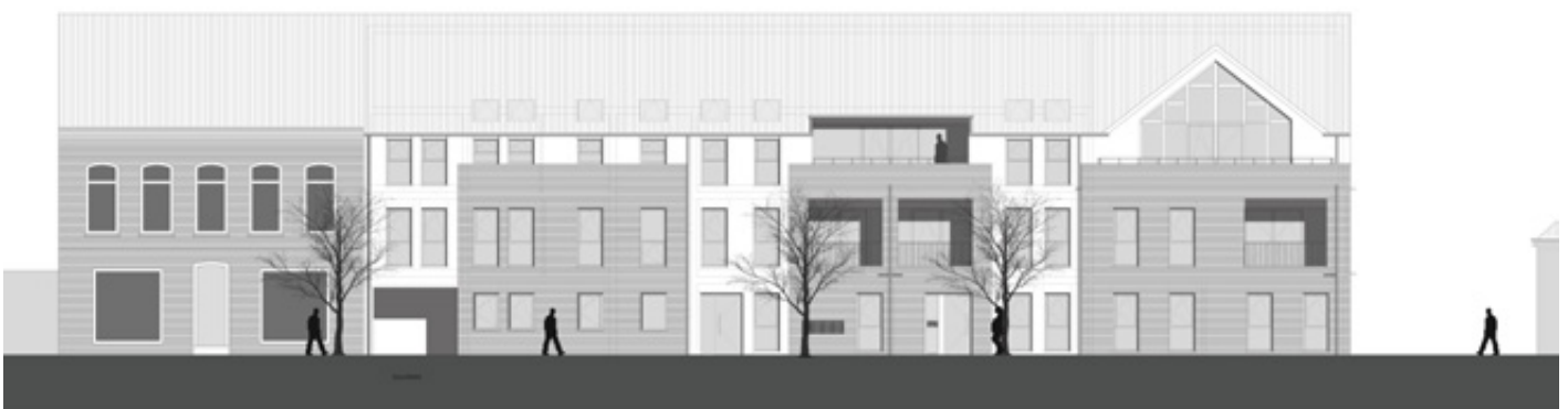
Ansicht West – Haus A

Von den Mietern können zusätzliche PKW-Stellplätze angemietet werden. Ebenso stehen Fahrrad- und Rollatorenabstellplätze zur Verfügung. Die attraktiv gestaltete Grünanlage im Innenbereich lädt zum Verweilen ein.