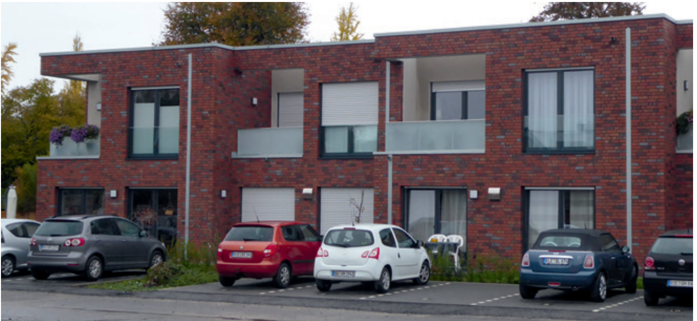
Die bereits bezogenen Mietwohnungen.

FERTIGSTELLUNG ENDE 2020. 31 WOHNUNGEN SIND ÖFFENTLICH GEFÖRDERT.