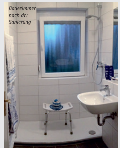
Badezimmer nach der Sanierung