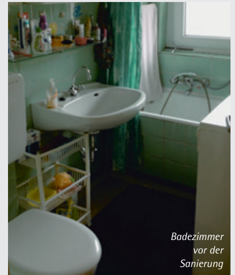
Badezimmer vor der Sanierung

Jetzt wohnen die Mieter nicht nur schön gelegen, sondern auch modern und komfortabel.