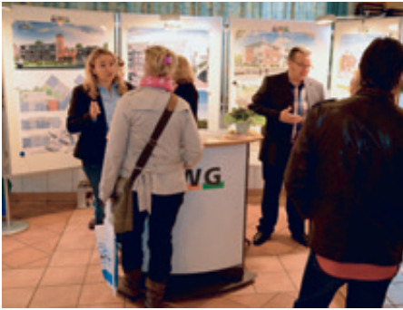
Stand der GWG auf der 4. Immobilienmesse

VORGESTELLT BEIM 4. IMMOBILIENTAG IN NEERSEN