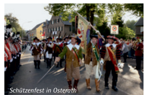
Schützenfest in Osterath

Seit 1980 stellte die Stadt Meerbusch als neue Eigentümerin die alte Brauerei für kommunale Aufgaben und für den Vereinssport zur Verfügung. 2008 erwarb eine Projektgesellschaft das Gebäude und führte eine umfassende Kernsanierung durch; die markante Fassade und die inneren Strukturen des Gewerbebaus wurden bewusst erhalten. Auf dem Gelände der Umspannanlage Osterath befindet sich seit 1981 die Elektrothek Osterath. Das Museum dokumentiert die Geschichte der Elektrotechnik. Die ehemalige Stein- und Mosaik-Fabrik Ostara