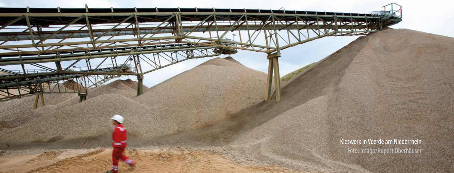
Kieswerk in Voerde am Niederrhein