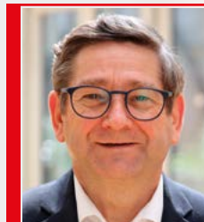
Josef Neumann (SPD)

... sind nicht immer in der Lage, sich selbst zu schützen und werden daher leichter Opfer von Übergriffen und Gewalt. Die Neuregelungen im WTG dienen dazu, Gewalt jeglicher Ausprägung zu verhindern. Die Teilhabe am gesellschaftlichen und sozialen Leben muss für jeden Menschen jederzeit angstreifig möglich sein.