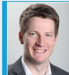
Dr. Martin Vincenz (AfD)

... haben ein deutlich höheres Risiko, Gewalt und anderen Übergriffen ausgesetzt zu sein. Dies gilt für Frauen und Mädchen ganz besonders und noch einmal mehr, wenn sie in stationären Einrichtungen leben. Der Gewaltschutz muss dringend verbessert werden. Grundsätzlich können kleinere Wohnformen im Gegensatz zu großen Einrichtungen das Gewaltisiko durch die engere Anbindung an die Gesellschaft senken.