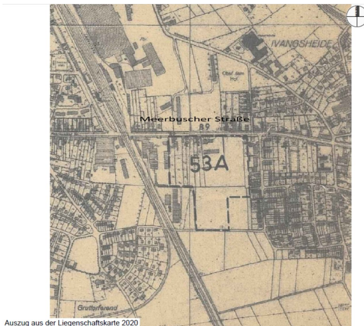
Auszug aus der Liegenschaftskarte 2020