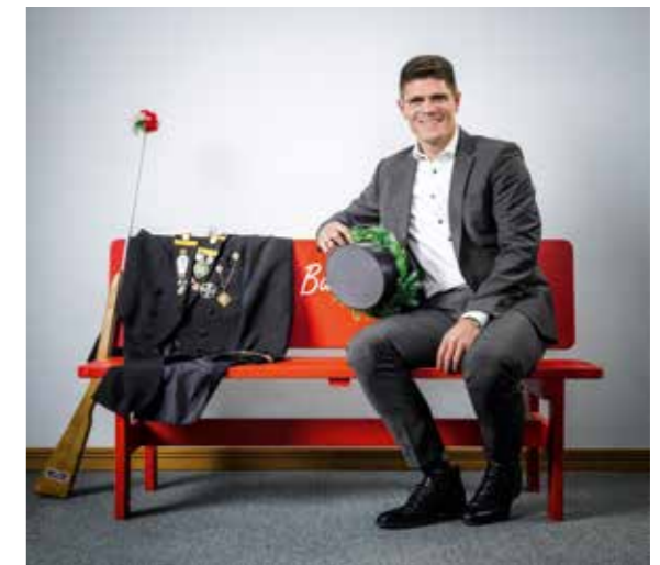
... sind wir nah an unseren Kunden.