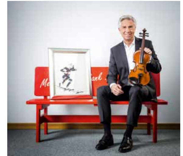
... fördern wir die Kultur im Rhein-Kreis Neuss.