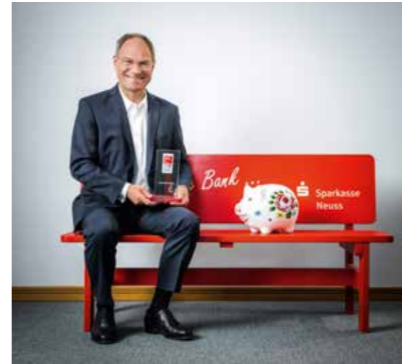
... übernehmen wir Verantwortung.