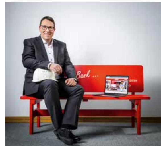
... investieren wir in die Zukunft.