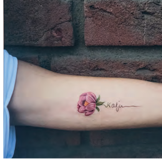
Viele Trauernde lassen sich Tattoos stechen, die sie an die Verstorbenen erinnern. Bilder wie dieses hängen im Seminarraum der Einrichtung.

Sonnengelb gestrichen ist der Eingangsbereich. Unter der Decke hängt ein Bild, das einen blauen Himmel zeigt. Die Einrichtung in Gelsenkirchen-Ückendorf, in der Mechthild Schroeter-Rupieper (55) pro Monat mehr als 200 trauernde Menschen empfängt, wirkt wie eine moderne Villa Kunterbunt. Es gibt ein Musikzimmer, einen Garten und eine gemütliche Wohnküche. Bunte Kommoden und Schränke in allen Ecken. Das Herzstück des Hauses: ein langer Holztisch. „Trauer braucht ein Zuhause“, sagt die gelernte Erzieherin, die im Bereich der Familientrauerarbeit Pionierarbeit geleistet hat. „Trauer braucht einen Küchentisch, an dem man sitzt und redet.“