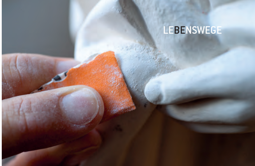
Oben: Fingerspitzengefühl ist in diesem Job ein Muss.