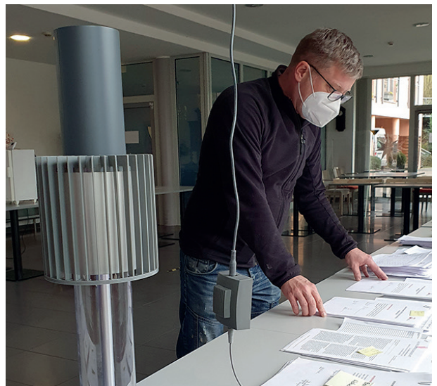
Keine Impfung ohne Einwilligung. Für viele Bewohnerinnen und Bewohner mussten diese Einwilligungen zuvor bei bevollmächtigten Angehörigen oder rechtlichen Betreuern eingeholt und für die Impfteams bereitgelegt werden.