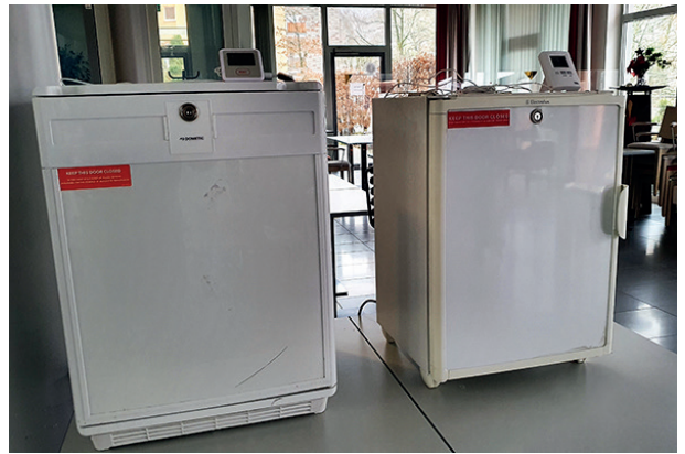
Kühlschränke für den empfindlichen Impfstoff im Restaurant des Augustinusstifts.