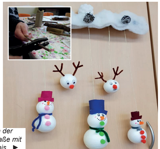
Notbetreuung in der OGS Uhlandstraße mit lustigem Ergebnis. ▶

Herausgeber: Caritasverband Wuppertal/Solingen e.V. Laurentiusstr. 7, 42103 Wuppertal Redaktion: Susanne Bossy, Tel. 0202 3890318, Fax 389033018 susanne.bossy@caritas-wsg.de