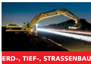
ERD-, TIEF-, STRASSENBAU