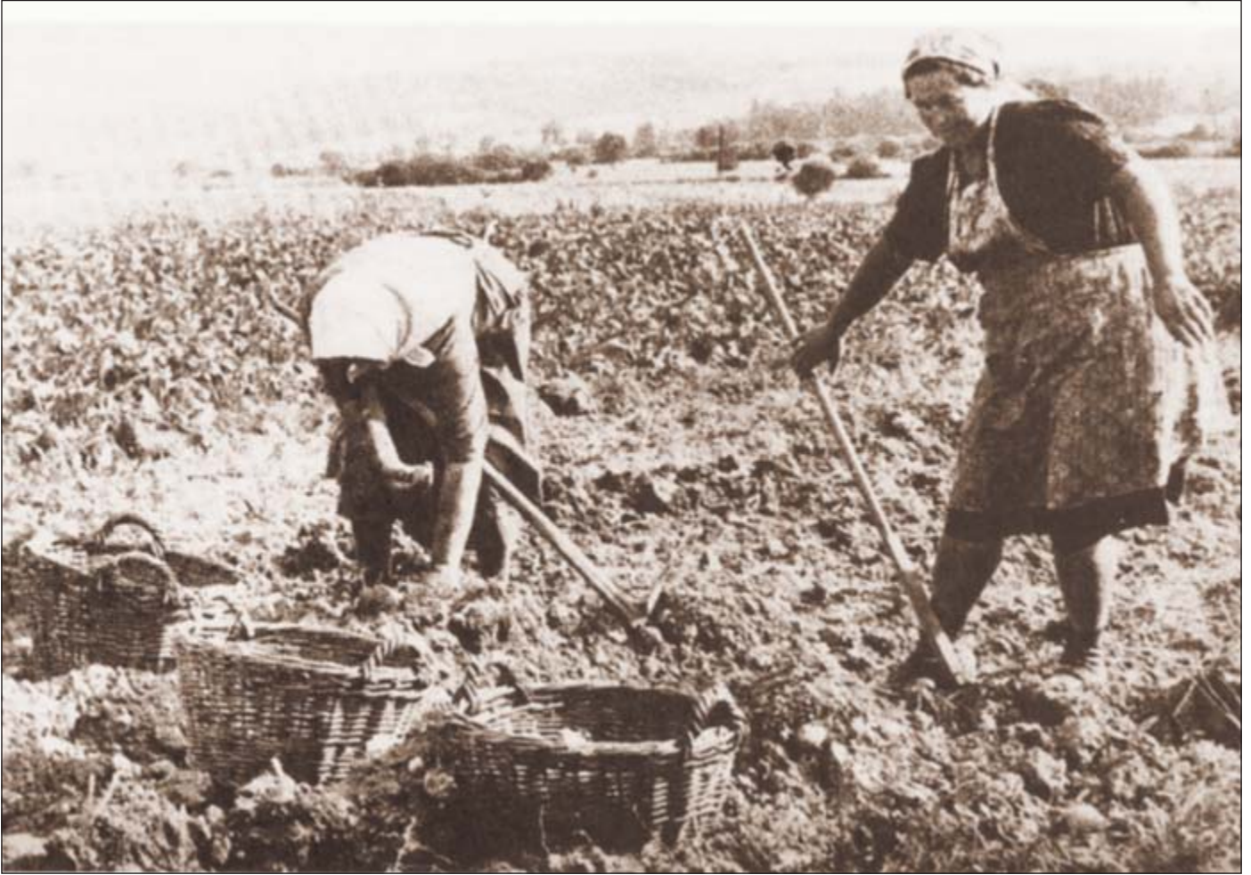
Kartoffelernte war früher eine sehr mühsame und anstrengende Sache, bei der auch Kinder mithalfen.