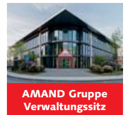
AMAND Gruppe Verwaltungssitz