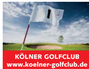
KÖLNER GOLFCLUB www.koelner-golfclub.de