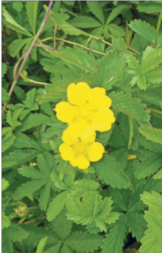
In der Naturheilkunde wird die Nelkenwurz bei Zahntzündungen und in Magen- und Darmtees angewendet.

Wo sie vorkommt, bildet sie meist größere Bestände. Die Pflanzen haben eine Grundrosette und gefiederte Blätter an den Blütenstielen, die nach