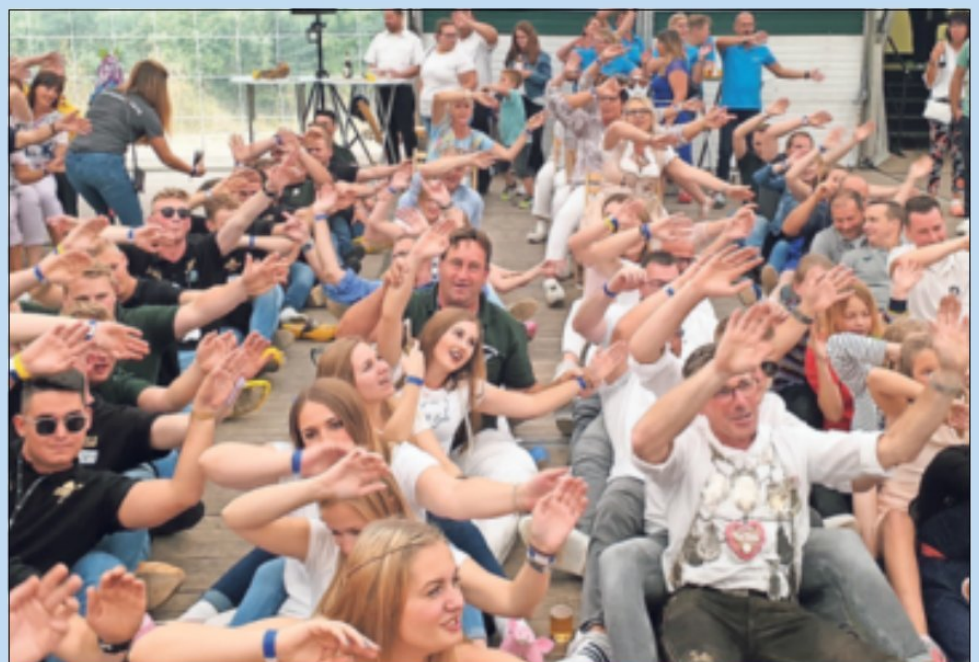
Die gute Stimmung im Otzen- und Spenrather Kirmeszelt ist sprichwörtlich. Die beiden Vereins-Vorsitzenden hoffen auf ein fulminantes Comeback im kommenden Jahr.