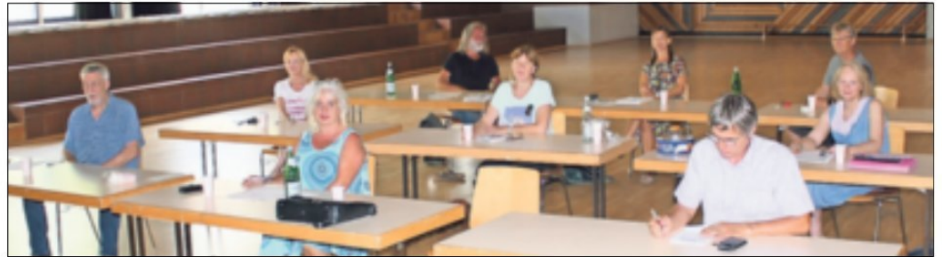
Mitgliederversammlung der „Freien Wähler“: Mit Abstand sich auf die Kommunalwahlen im September eingeschworen.

und -wandel, Nachhaltigkeit beim Bauen und im Verkehr, Strukturwandel, Weiterentwicklung der Schul- und KiTa-Landschaft, um allen Jüchener Kin-