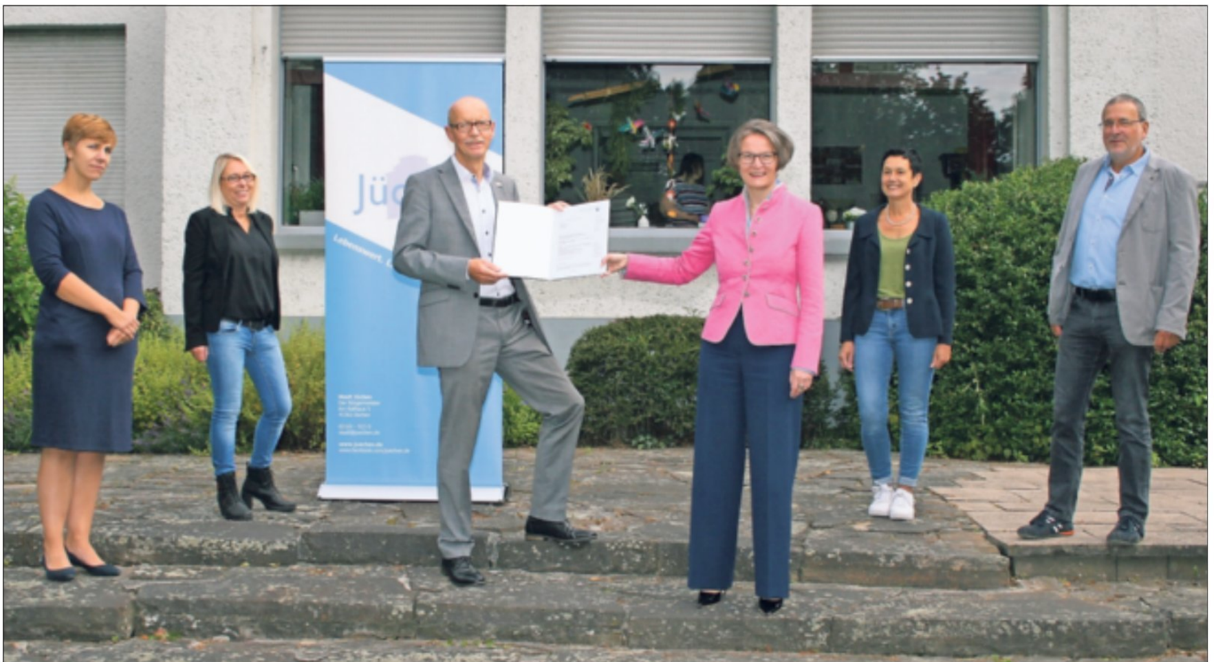
Heimatministerin Ina Scharrenbach (4.v.l.) machte in Jüchen Station und hatte gute Nachrichten für Hochneukirch im Gepäck: Die Sanierung der Terrasse an der Villa Schmölder wird bezuschusst! Bürgermeister Harald Zillikens nahm den Zuwendungsbescheid in Höhe von 32.143 Euro entgegen.