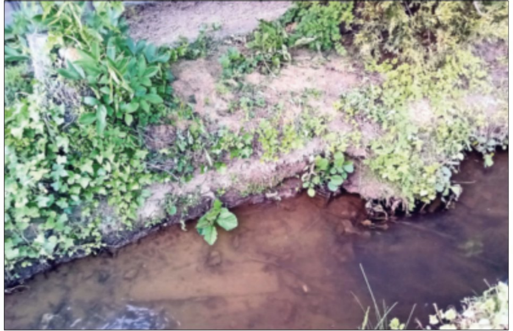
Oben: Der Flusskrebs ist verletzt. Eine Folge der Arbeiten?