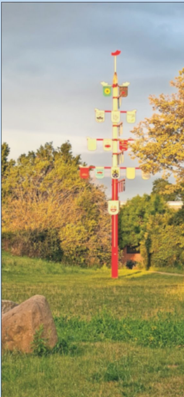
Der Wappenbaum der Dorfgemeinschaft Otzenrath und Spenrath im strahlenden Sonnenschein.