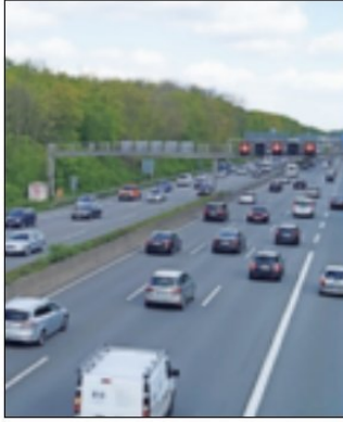
Die Ursache des Unfalls auf der A 44n ist noch unklar.

regennasser Fahrbahn aus ungeklärter Ursache nach links von der Fahrbahn ab, prallte gegen die dortige Mittelschutzplanke, schleuderte quer über alle Fahrstreifen und kam entgegengesetzt zur Fahrtrichtung auf dem Seitenstreifen zum Stehen. Nachfolgende Ersthelfer leiteten bis zum Eintreffen der Rettungskräfte sofort Reanimationsmaßnahmen ein. Ein Notarzt konnte jedoch nur noch den Tod des Fahrers feststellen. Es kam zu keinen erheblichen Verkehrsbeeinträchtigungen.