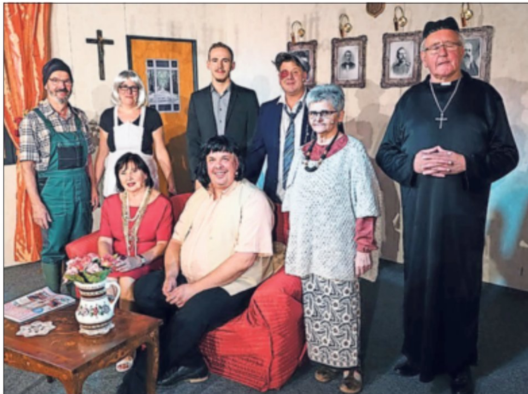
„Cappuccino“, die Laienspielgruppe der Kolpingsfamilie aus Otzenrath, hat eine besonders treue Anhängerschaft.

Schlaphof. Das Stück ist allen inzwischen schon sehr ans Herz gewachsen und sie freuen