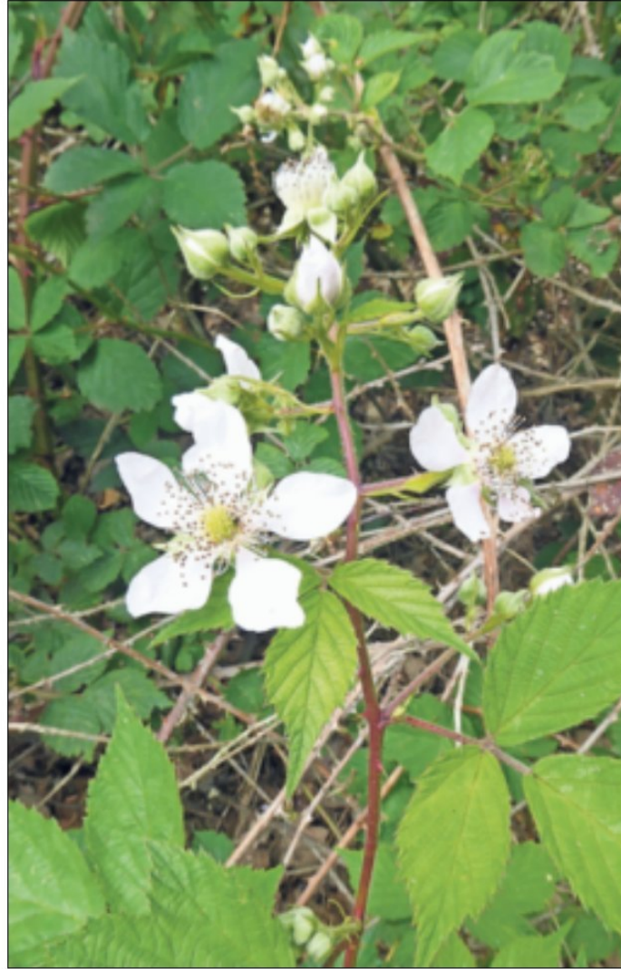
Auch Brombeeren haben fünf Blütenblätter, wie die einfachen Rosen. In den weißen oder rosaroten Brombeerblüten finden Insekten Nektar und reichlich Pollen.

In den weißen oder rosaroten Brombeerblüten finden Insekten Nektar und reichlich Pol-