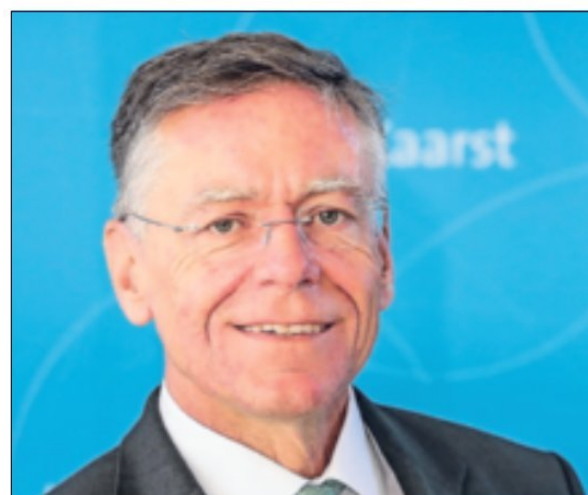
Landrat Hans-Jürgen Petrauschke wünscht schöne Sommerferien und gute Erholung.