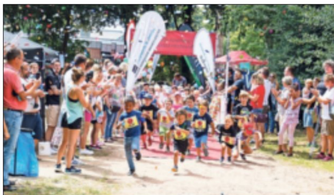
Auf die Plätze, fertig, los. Am 15. August startet die Jüchener Lauf-Reihe in Hochneukirch.