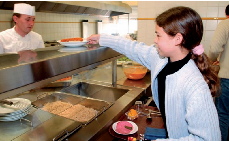
Extra-Raum für die Essensausgabe