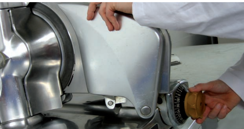
Reinigung von Arbeitsgeräten