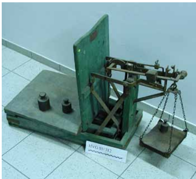
Objekt: Dezimalwaage; Material/Technik: Holz, Eisen; Datum: um 1900; Erwerb von: Fam. Stein.

In loser Folge werden hiermit die einzelnen Objekte einer größeren Öffentlichkeit vorgestellt.