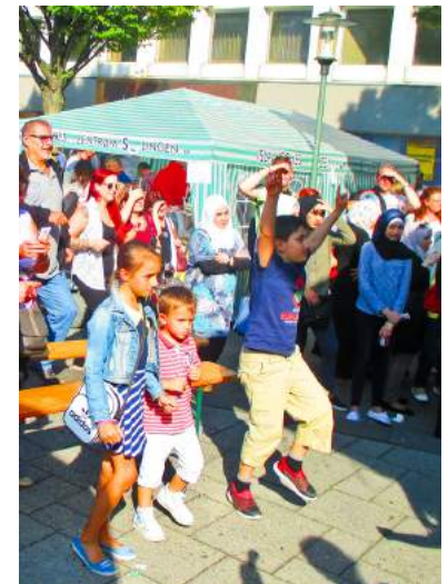
„Leben braucht Vielfalt“ şenliği kültürel farklılıkları unutturuyor ve neşe veriyor.

Burada önemli olan, „Bündnis für Toleranz und Zivilcourage“ üyelerinin fikirlerinin, isteklerinin ve düşüncelerinin gerçekleştirilmesi ve envai çeşit derneklerin ve kurumların Solingen'i çeşitli insanların birlikte hoşgörü ile yaşadığı bir şehir yapma çabalarının ve emeklerinin etki yaratmasını sağlamaktır.