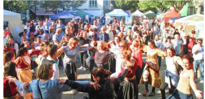
Das Fest „Leben braucht Vielfalt“ verbindet die Kulturen und macht Freude.

In der letzten "Mitte"-Studie 2016 wird die autoritäre und rechtsextreme Einstellung in Deutschland beschrieben. "Während die generalisierten Vorurteile gegen Migranten/innen leicht zurückgingen, nahm die Fokussierung des Ressentiments auf Asylbewerber/innen, Muslime/innen sowie auf Sinti und Roma zu." (Decker/Kiess/Brähler: Die enthemmte Mitte, Leipzig 2016) Wie kann man dieser Entwicklung entgegentreten?