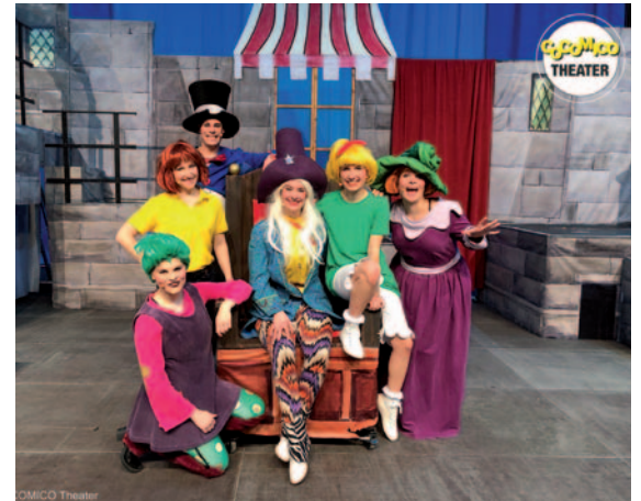
„Bibi Blocksberg: Alles wie verhext! – Das Musical“ · COCOMICO-Theater.