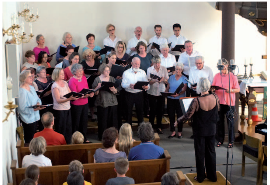
Der Chor der Martin-Luther-Kirche.