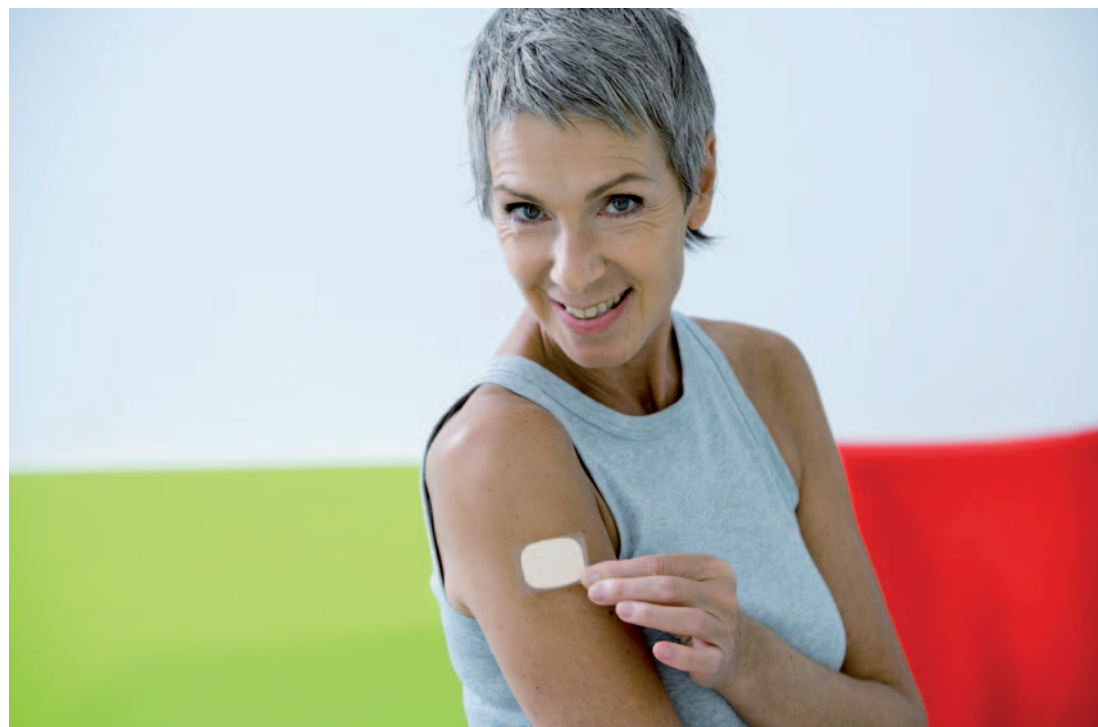
Eventuell helfen Nikotinpflaster, um mit dem Rauchen aufzuhören.