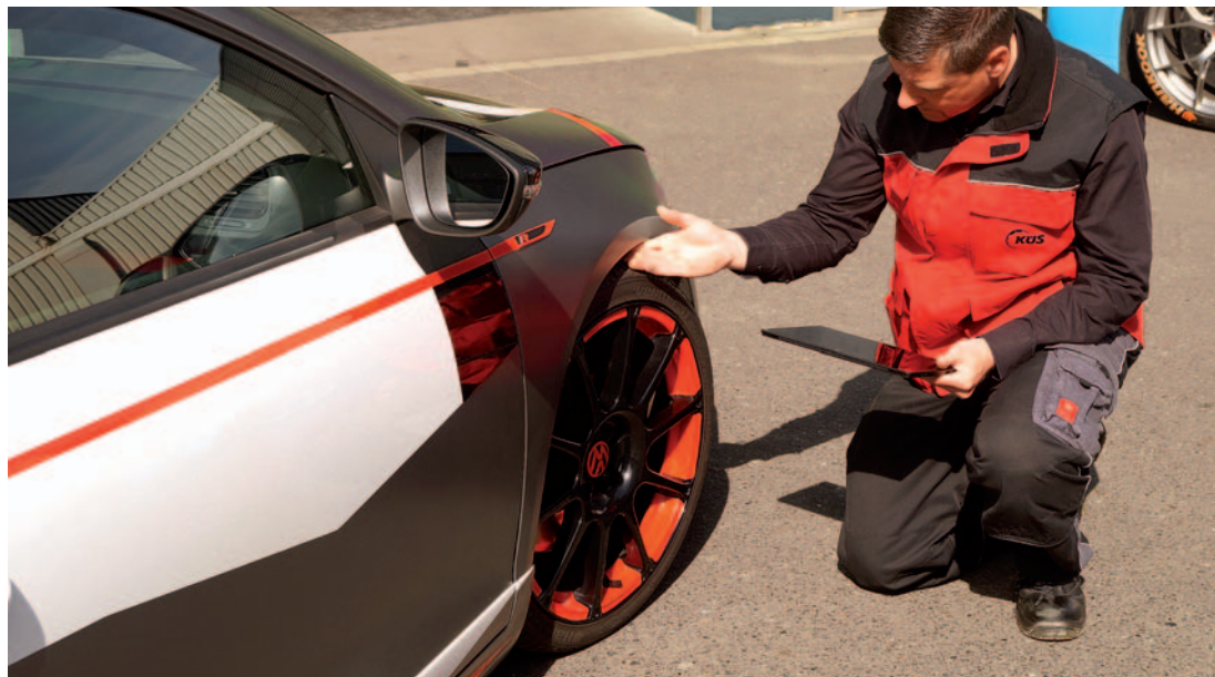
Tieferlegungen oder auch die Erhöhung des Fahrzeugaufbaus, etwa bei Geländewagen, sind mit die häufigsten am Serienfahrzeug vorgenommenen Änderungen.

ganz abgesehen von der Verkehrsgefährdung durch die Blendung des Gegenverkehrs bei Leuchten mit hoher Lichtintensität. Geländewagen werden häufig in der Höhe verändert. Dass es dabei zu einem Dachcrash an der Parkhauseinfahrt kommen kann, ist eine der unangenehmen Nebenerscheinungen. Bei solchen Tuningmaßnahmen ist normalerweise immer eine Änderungsabnahme, inklusive einer Bestimmung der neuen Fahrzeughöhe und deren Übernahmen in die Zulassungsdokumente nötig. Überwachungsorganisationen wie die KÜS führen diese durch. Natürlich gibt es auch Fahrwerksänderungen mit einer Allgemeinen Betriebserlaubnis (ABE), wo keine Änderungsabnahmen notwendig sind. Die KÜS mahnt hier zur Vorsicht, da dies von den jeweiligen Auflagen abhängt und nicht pauschal bei dieser Prüfzeugnisart so ist. Der Zulässigkeitsnachweis ist bei nicht abnahmepflichtigen Änderungen so lange über die mitzuführende ABE gegeben, wie keine gegenseitige Beeinflussung mit weiteren Änderungsmaßnahmen vorliegt. Mit einer stärker abweichenden Rad-/Reifenkombination zur Serie wird allerdings immer eine Änderungsabnahme notwendig. Hier geht es dann darum, Kontakte der Reifen mit angrenzenden Bauteilen auszuschließen. Und die Höhe für die Anbringung des Fahrzeugkennzeichens? Auch hierfür gibt es klare Vorgaben. Beim Kennzeichen am Fahrzeugheck muss der untere Rand mindestens 30 Zentimeter von der Fahrbahnoberflä-