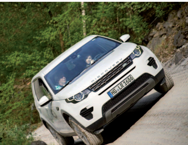
Lieber ohne Kaffeebecher – Schräglage extrem.