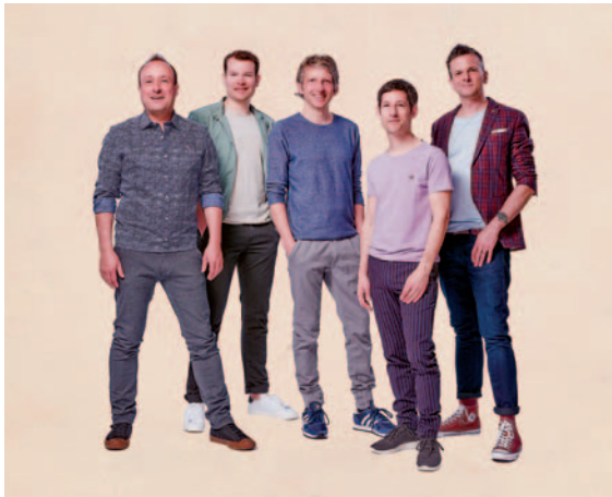
Basta · „In Farbe“

Eintrittskarten und Programminformationen erhalten Sie in der Vorverkaufsstelle im Schauplatz-Foyer sowie unter: www.schauplatz.de