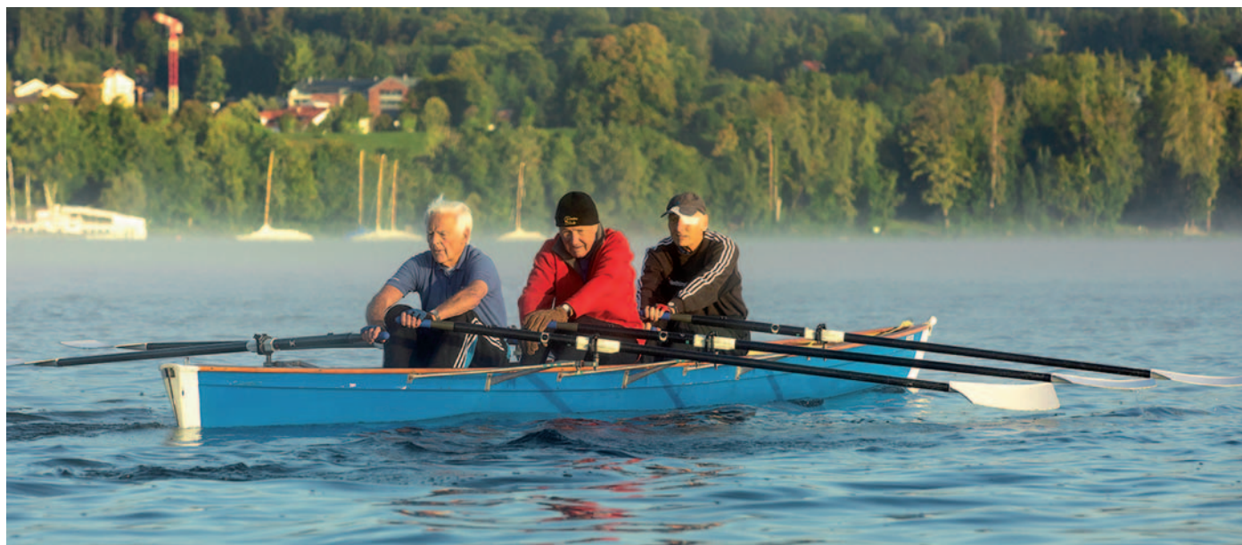
Regelmäßiges Rudern auf dem Starnberger See stärkt die Lebenserwartung – bei den Familien kommt der Landkreis Starnberg auf Platz 3.