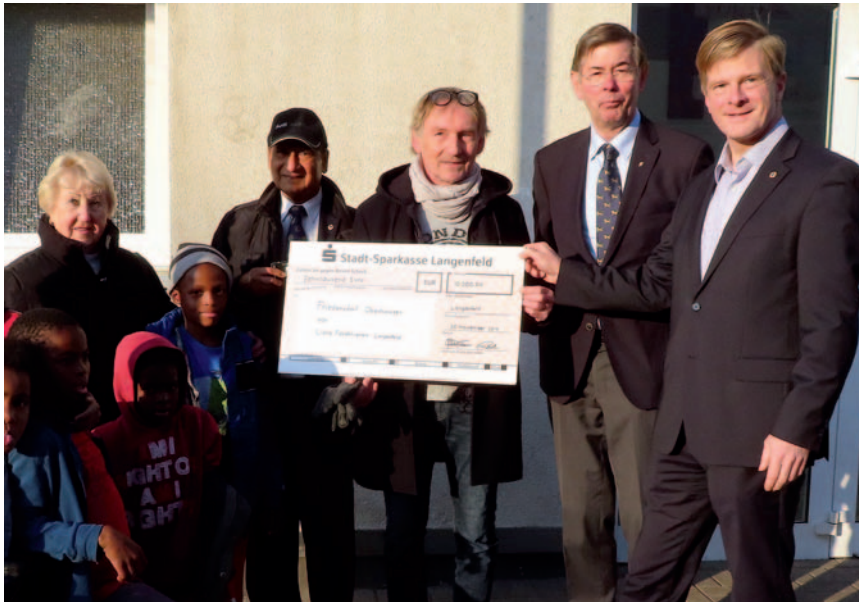
Mit der Übergabe eines Schecks von 10 000 Euro an das Friedensdorf International summiert sich die Lions-Unterstützung dieser Einrichtung auf 188 000 Euro in 17 Jahren.