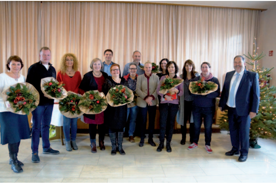
Ehrung der langjährigen Mitarbeitenden der LVR-Klinik Langenfeld.