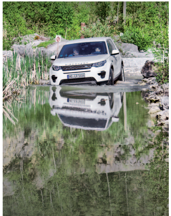
Mit Vorsicht in unbekannte Wassertiefen.

(SM) Im Experience Center von Land Rover in der Flandersbacher Straße in Wülfrath kann unter anderem das Fahrtraining mit Level 1 und Level 2 gebucht werden. Von einem Instruktor und mit aktuellen Land Rover-Modellen werden die Grundlagen des Off-Road-Fahrens vermittelt. Angeboten wird auch ein Gelände-Fahrtraining für 11- bis 17-Jährige. Infos unter Telefon 02058/7780967 oder unter www.landrover-experience.de . ■