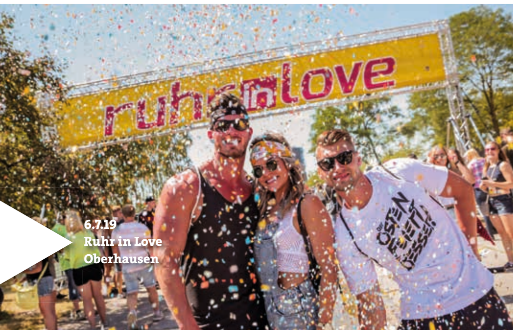
6.7.19 Ruhr in Love Oberhausen

Entdecken Sie, was im Ruhrgebiet los ist! In unserem Kalender finden Sie Tipps für alles, was Spaß macht – Shows, Musik, Messen, Mitmach-Angebote und vieles mehr. Langweilig wird es hier einfach nie!