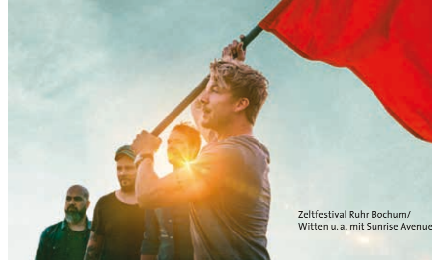
Zeltfestival Ruhr Bochum/ Witten u. a. mit Sunrise Avenue

Hier dreht sich alles um Elektro- und Hybrid-Mobilität: Aussteller aus der Region präsen-