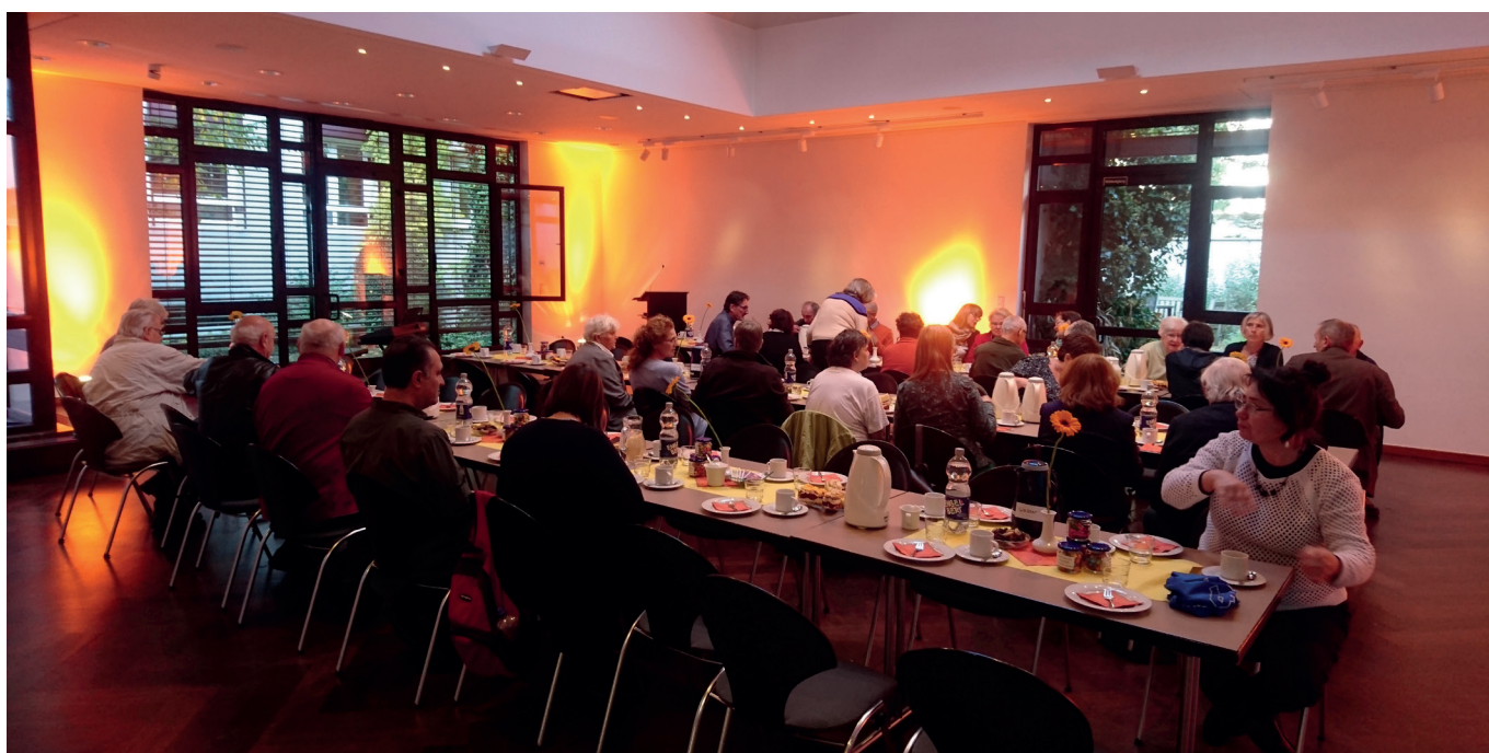
...und im Katholischen Stadthaus Wuppertal mit zwei großartigen jungen Musikern.