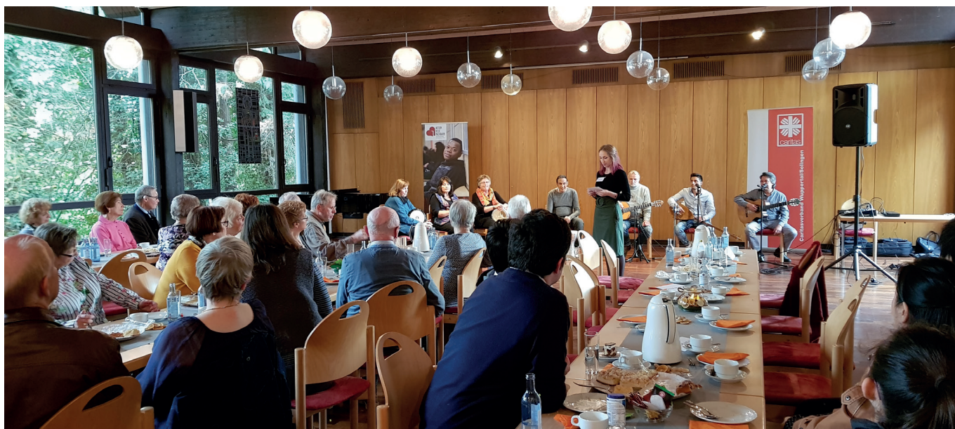
Dankeschön-Veranstaltung im Pfarrsaal St. Joseph in Solingen Ohligs...