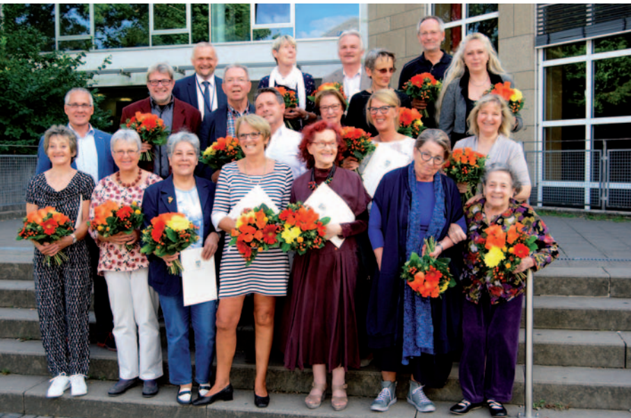
Ausgezeichnet wurden diesmal 13 Kursleitende, die der Volkshochschule seit mehr als 20, 25, 30 und sogar 35 Jahren die Treue halten und dort erfolgreich Veranstaltungen und Kurse leiten. Drei weitere Kursleiter sowie zwei ehrenamtliche Mitarbeiterinnen wurden mit Worten des Dankes verabschiedet.