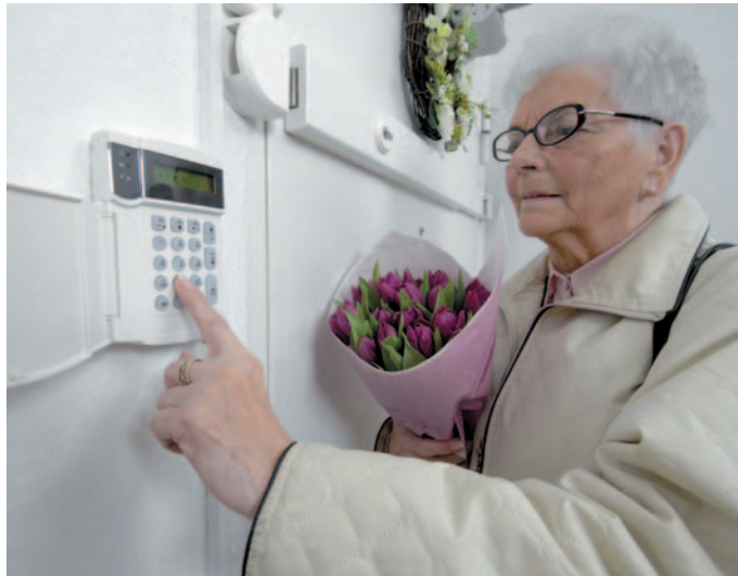
Schutz und Komfort für das Heim bietet die richtige Sicherheitstechnik.

Messenger-Dienste wie WhatsApp stehen auch bei Senioren hoch im Kurs. 85 Prozent aller Smartphone-Besitzer über 65 Jahre chatten regelmäßig mit der Familie oder Freunden. Und sind nach eigenen Angaben deutlich kommunikationsfreudiger als früher. Dies sind Ergebnisse einer Studie von Emporia, für die 1000 Senioren befragt wurden. Sich mit Freunden über das Smartphone verabreden, in der gemeinsamen WhatsApp-Sportgruppe ein Foto posten oder den Enkel fragen, wie die Klassenarbeit war – für Senioren mit einem internetfähigen Handy ist das längst eine Selbstverständlichkeit. „Messenger-Dienste sind heute bei Senioren genauso gefragt wie bei jungen Menschen. Sie ermöglichen eine schnelle und direkte Kommuni-