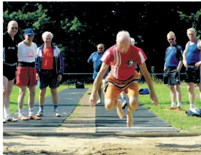
Sport hilft, bis ins hohe Alter gesund zu bleiben.

Mit zunehmendem Alter wächst der Anteil der allein lebenden Senioren. Vor allem Frauen – 60 Prozent der über 75-Jährigen – leben im Alter allein. Dennoch ist die Bindung Älterer an Partner und Familie in der Regel groß, wie eine aktuelle GfK-Studie im Auftrag des Gesamtverbandes der Deutschen Versicherungswirtschaft e. V. (GDV) zeigt. Jeder zehnte Senior über 55 Jahren sorgt selbst für pflegebedürftige Eltern oder Partner. Senioren, die mit Partner oder Familie zusammenleben, sind auch außerhalb der Familie aktiver – so ist der Anteil der ehrenamtlich Tätigen mehr als doppelt so hoch wie bei Alleinstehenden. Dies gilt auch für ältere Berufstätige: Sie tragen darüber hinaus auch deutlich mehr Verantwortung innerhalb der Familie als Nichtberufstätige. Die Unfallhäufigkeit steigt mit zunehmenden Alter stark an: Ein Drittel der über 75-Jährigen waren bereits betroffen. 19 Prozent hatten bereits einen Unfall in höherem Alter. Rund zehn Prozent der Senioren bewerten ihren Gesundheitszustand auch nach der Genesungsphase deutlich schlechter als vor dem Unfall. Viele ältere Menschen denken