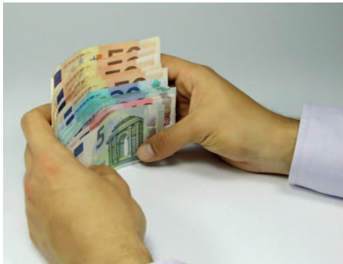
Die meisten Menschen über 50 würden von sich sagen, ein gutes Händchen für Finanzfragen zu haben.