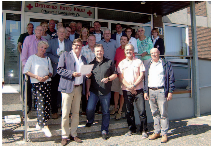
Ehrung für langjährige Blutspender beim Ortsverein Langenfeld des Deutschen Roten Kreuzes.

schule wieder gute Noten von ihren Teilnehmern. Bei der Kundenbefragung erzielte sie eine durchschnittliche Bewertung von 1,5 nach Schulnoten. Dabei wurden vor allem neue Kursangebote und neue Kursleiter bewertet. Auch den Vergleich mit anderen Volkshochschulen muss die vhs Langenfeld nicht scheuen: „In Sachen Angebotsdichte, also den durchgeführten Veranstaltungen pro Einwohner, belegt die vhs Langenfeld im Vergleich mit allen 112 VHSn in Nordrhein-Westfalen den zweiten Platz“, berichtete der Bürgermeister. Das Ranking der Volkshochschulen zeige einmal mehr, dass Langenfeld mit einem außergewöhnlich umfangreichen Angebot pro Einwohner punkten könne, welches mit großem Einsatz der Mitarbeiter umgesetzt werde. Eine besondere Stärke der Volkshochschule sei ihre Anpassungsfähigkeit an die sich stetig verändernden gesellschaftlichen Rahmenbedingungen und Lernbedarfe, betonte der VHS-Chef. So hat sie sich im Berichtsjahr in besonderem Maße den großen gesellschaftlichen Herausforderungen, wie etwa der Integration von Zugewanderten und der fortschreitende Digitalisierung, gewidmet. Mit 108 Kursen im Bereich Deutsch als Fremdsprache/Deutsch als Zweitsprache hat die VHS auch 2017 wieder eine erhebliche Integrationsleistung erbracht: In 10 306 Unterrichtseinheiten wurden mehr als 1500 Teilnehmer geschult. Fast 900 Menschen nahmen in diesem Bereich das Beratungsangebot der Volkshochschule in Anspruch. „Damit bleibt die VHS er-