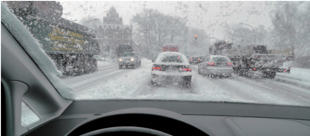
Die Sichtverhältnisse im Winter sind bereits schlecht genug – saubere Scheiben sind deshalb ein Muss.