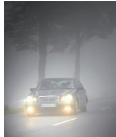
Eine optimal funktionierende Beleuchtung vermindert das Unfallrisiko im Winter erheblich.

zumeist keine Wahl. Wer das gern vergisst und keine Automatik für das Einschalten hat, kann sie vielfach im Kfz-Betrieb nachrüsten lassen. Ansonsten hilft nur der „Knoten im Taschentuch“. Immer dran denken: Licht an auch am Tag! Seit vergangenem Jahr sind die Tagfahrleuchten bei neuen Modellen Pflicht. Leider vergessen Fahrer solcher Autos oft das rechtzeitige Umschalten auf Abblendlicht in der Dämmerung und in Tunnels. Das ist aber wichtig, weil beim Tagfahrlicht meist die Rückleuchten nicht in Betrieb sind. Entspannt sehen das Besitzer eines Dämmerungssensors, der das Umschalten automatisch erledigt. Auch er ist vielfach nachrüstbar. Brennt eine Lampe durch, muss sie nach den gesetzlichen Vorschriften „unverzüglich“ erneuert werden. Das muss nicht direkt am Straßenrand geschehen, die Fahrt zur Werkstatt ist erlaubt. Wird man beim Fahren mit nur einem funktionierenden Scheinwerfer/einer funktionierenden Heckleuchte erwischt, kostet das Bußgeld. Der Parkplatz vor der Schaufensterscheibe bietet eine gute Kontrollmöglichkeit für die Lichtfunktionen. Die gern vernachlässigte Leuchtweitenregulierung lässt sich vor einer Wand prüfen. Bewegt sich das Licht beim Betätigen des Reglers auf und ab, ist alles in Ord-