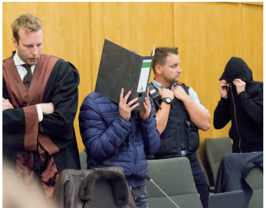
Das Strickmuster war immer gleich: Auf dem Rücksitz des Autos zwangen sie die 16-jährigen Schülerinnen zum Geschlechtsverkehr.

Eigentlich war alles so gelaufen wie immer. Einer der Jungs hatte mit einem Mädchen angebandelt und es – möglicherweise mit der Aussicht auf ein paar romantische Augenblicke – in sein Auto gelockt. Diesmal hatte man sich offenbar in Gelsenkirchen verabredet und es war auch nicht so, dass die 16-Jährige den Jungen nicht kannte. Vielleicht fand sie ihn nett, möglicherweise erhoffte sie sich mehr von der Begegnung. Jedenfalls hatte sie sich arglos auf den Beifahrersitz gesetzt und was dann geschah, endete für die Jugendliche in einem Alptraum.