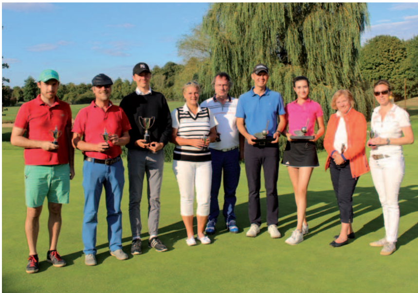
Anfang September stiegen die Clubmeisterschaften des Golfclubs am Katzberg.