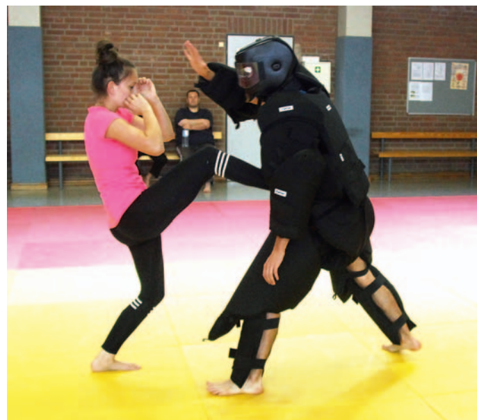
Einen neuen Kurs für Frauen gibt es an der Geschwister-Scholl-Straße.

(HMH) Durchwachsen liefen die ersten Wochen der neuen Saison für die Fußball-Bundesliga-Teams in Langenfelds Nachbar-