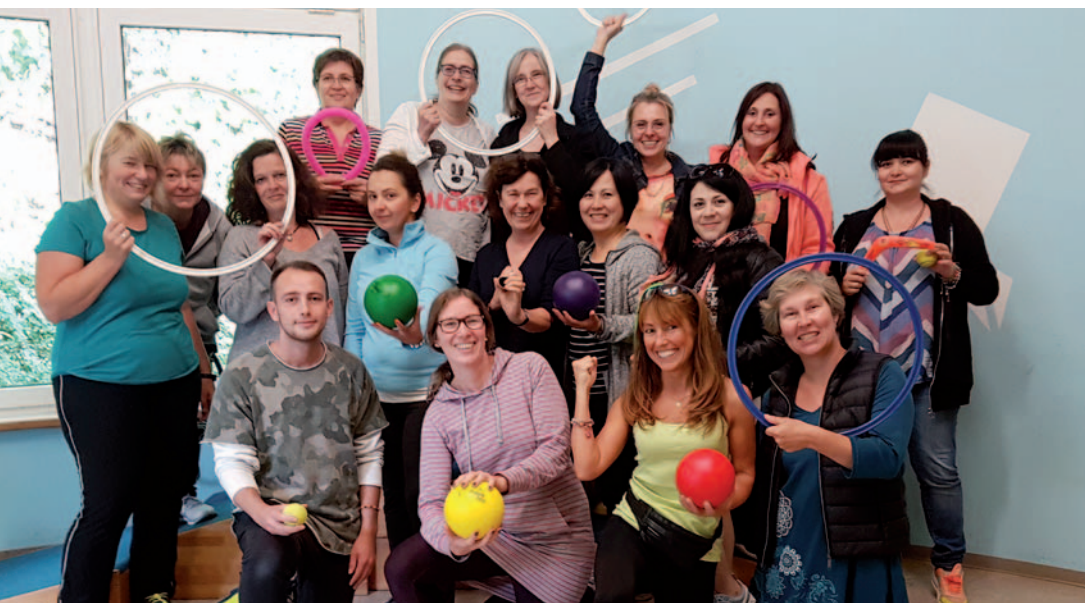
Der KSB Mettmann vergab 17 Zertifikate.