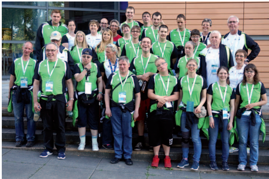
Die Athleten der Lebenshilfe-Sportgruppe (hier bei den Nationalen Special-Olympics-Sommerspielen 2016 in Hannover) bereiten sich auf die nächsten Herausforderungen vor.

feld; Kosten: 20 Euro). Eine Anmeldung ist erforderlich. Interessierte erhalten im Caritas-Treffpunkt bei Karin Arenz unter der Rufnummer 02173/939203 Auskunft oder per E-Mail bei Karl-Heinz Odhofer unter k-h.odhofer@jc-langenfeld.de. Informationen zum Kurs gibt es auch auf der Internetseite des Judo-Clubs Langenfeld unter http://www.jc-langenfeld.de . ■