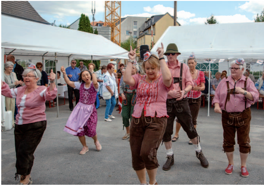
Ausgelassene Stimmung beim diesjährigen Sommerfest der AWO Langenfeld.