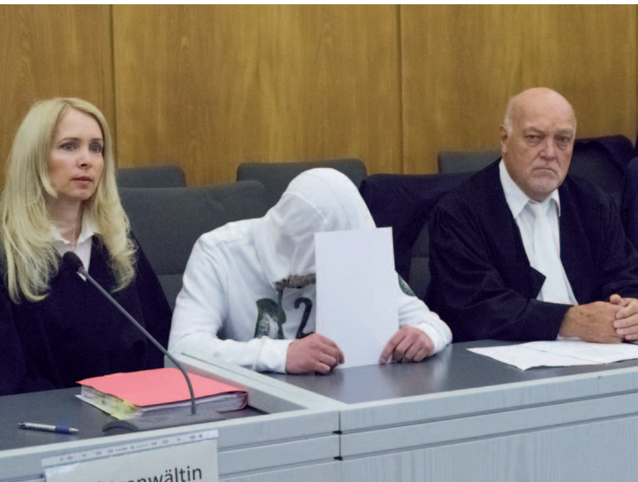
Die fünf Angeklagten hatten eine WhatsApp-Gruppe gegründet, in der sie sich zu den Taten verabredet haben sollen.

Gruppenvergewaltiger müssen sich vor Gericht verantworten / Eine der Taten soll im Neandertal stattgefunden haben