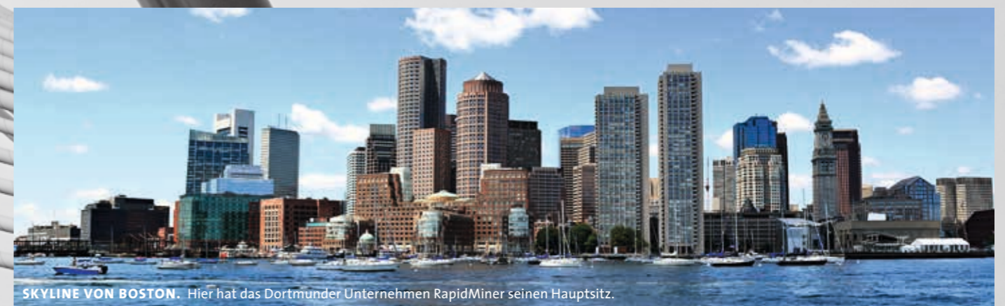
SKYLINE VON BOSTON. Hier hat das Dortmunder Unternehmen RapidMiner seinen Hauptsitz.