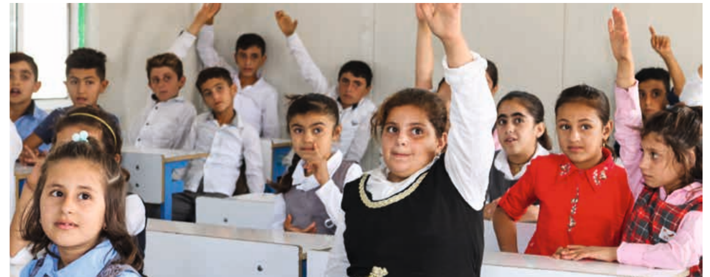
RECHT AUF BILDUNG. Von Spendengeldern wurde im Flüchtlingsdorf Ruhrgebiet eine Schule gebaut.