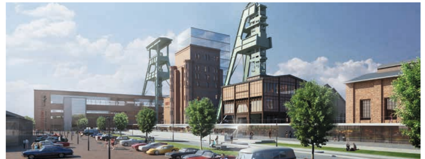
ALTE HÜLLE, NEUER INHALT. Das Gelände der ehemaligen Zeche Ewald wird zum Mobilitäts- und Sportwagenzentrum umgebaut.

natürlich neugierig. „Was geben wir weiter?“ Nicht die Bilder sind neu, sondern die Herangehensweise, die Art der Auseinandersetzung. „Es gilt, die Dinge, die wir ererbt haben, als Erbe anzunehmen: für die eigene Gegenwart und als Treuhänder für die Zukunft“, sagt sie. Sie zeigt auf junge Menschen, die im Dortmunder U Selfies von sich mit Blick auf die Stadt machen. Durch Umnutzung entstehen neue Räume und neue Städte. Auf Basis der Vergangenheit wird so Gegenwart gestaltet. „Zum Strukturwandel des Ruhrgebiets gehören untrennbar die neugegründeten Universitäten, an die in den 1960er Jahren etwa 1.000 neue Professorinnen und Professoren berufen wurden“, erzählt sie weiter. In die gleiche Zeit etwa fiel auch der Bau des Musiktheaters im Revier in Gelsenkirchen, das vor 50 Jahren visionär erschien.