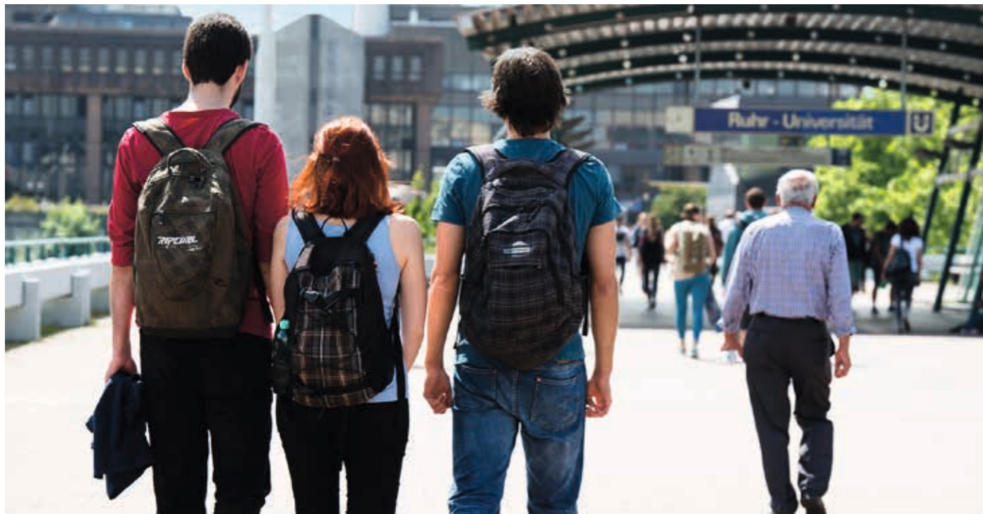
STUDENTENLEBEN. Rund 270.000 Studierende machen das Ruhrgebiet zur größten Wissensmetropole Europas.