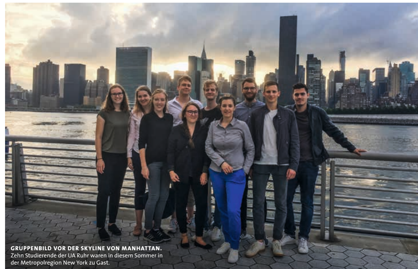
GRUPPENBILD VOR DER SKYLINE VON MANHATTAN. Zehn Studierende der UA Ruhr waren in diesem Sommer in der Metropolregion New York zu Gast.

Bereits seit 2007 bündeln die Ruhr-Universität Bochum, die Technische Universität Dortmund und die Universität Duisburg-Essen ihre Kompetenzen in der