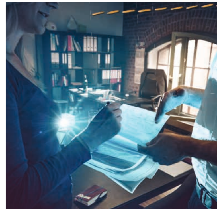
BUSINESS. Viele Unternehmen aus der Region sind mit Innovationen weltweit führend.

natürlich neugierig. „Was geben wir weiter?“ Nicht die Bilder sind neu, sondern die Herangehensweise, die Art der Auseinandersetzung. „Es gilt, die Dinge, die wir ererbt haben, als Erbe anzunehmen: für die eigene Gegenwart und als Treuhänder für die Zukunft“, sagt sie. Sie zeigt auf junge Menschen, die im Dortmunder U Selfies von sich mit Blick auf die Stadt machen. Durch Umnutzung entstehen neue Räume und neue Städte. Auf Basis der Vergangenheit wird so Gegenwart gestaltet. „Zum Strukturwandel des Ruhrgebiets gehören untrennbar die neugegründeten Universitäten, an die in den 1960er Jahren etwa 1.000 neue Professorinnen und Professoren berufen wurden“, erzählt sie weiter. In die gleiche Zeit etwa fiel auch der Bau des Musiktheaters im Revier in Gelsenkirchen, das vor 50 Jahren visionär erschien.