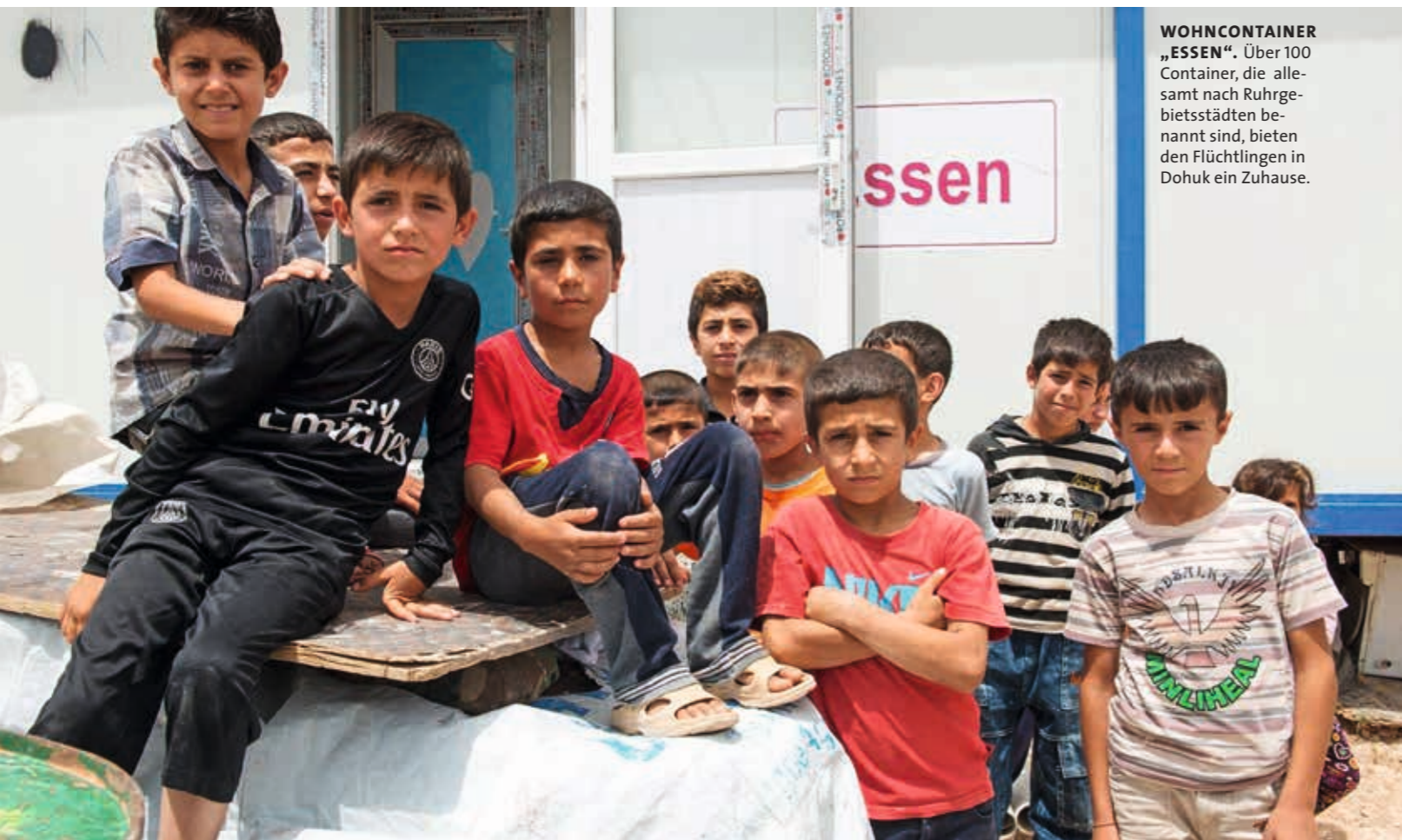
WOHNCONTAINER „ESSEN“. Über 100 Container, die alle nach Ruhrgebietsstädten benannt sind, bieten den Flüchtlingen in Dohuk ein Zuhause.

Visionen für die Zukunft haben die Initiatoren genügend. So kann sich die Verwaltung von Sheikhan vorstellen, dass aus dem Dorf der Flüchtlinge ein eigener Stadtteil wird. Oder es geht in Karakosch weiter, weil diese überwiegend von Christen bewohnte Region unter dem IS-Terror besonders gelitten hat. Platz für die Namen von Spendern gibt es an den betroffenen Orten im Nordirak genügend. ◀