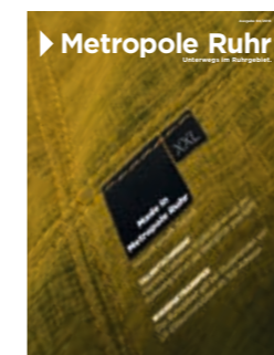
TITELFOTO Shutterstock/Golbay, cluckva Grafik: Gesa Braster, Markt1 Verlag

FOTONACHWEIS Pedro Malinowski (2, 8); Volker Wiciok (2, 12, 13); Ludger Möllers (2, 14, 15); Shutterstock/Golbay, cluckva (2, 6–10); Achim Meurer (2, 18, 19); Jan Kath (3, 21); Irène Zandel (3, 22); Privat (3, 26, 27); mayday.de (5); RUB/Katja Marquard (8); Kai Uwe Gundlach (9); Motorworld (9); Zollverein/Jochen Tack (10, 20); Steve McNicholas (16); mummenschanz.com Marco Hartmann (16); Guido Schröder (17); Stiftung Kreative Kirche (17); Birgit Andrich (19); Museum Folkwang Essen, Antonio Donghi, Il Giocoliere, 1936, Der Jongleur, Öl auf Leinwand, 116 x 86,5 x 3 cm, Privatsammlung (24); Galerie Schloss Ludwig Oberhausen, Eckart Hahn, nothingness, 2015 © Eckart Hahn, aus der Ausstellung Die Geste, Galerie Schloss Oberhausen (24); Albert Renger-Patzsch, „Kühe a. d. Ruhrmündung“, Duisburg-Ruhrort 1930, Bildnachweis: Albert Renger-Patzsch Archiv / Stiftung Ann und Jürgen Wilde, Pinakothek der Moderne, München © Albert Renger-Patzsch/Archiv Ann und Jürgen Wilde, Zülpich/VG Bild-Kunst Bonn 2018 (24); Rausch der Schönheit, Museum für Kunst und Kulturgeschichte Dortmund, Vase Louis Comfort Tiffany, Foto: Jürgen Spiler (25); Die große Rensch-Orgel (1986 IV/56) aus Bottrop, Foto: Tristan Stiklorus (25); Gesundheitspark Nienhausen (25); Carmen Radeck (28); Shutterstock/Mohd KhairilX (28, 29); Shutterstock/diak (29); Jan Ladwig (30)