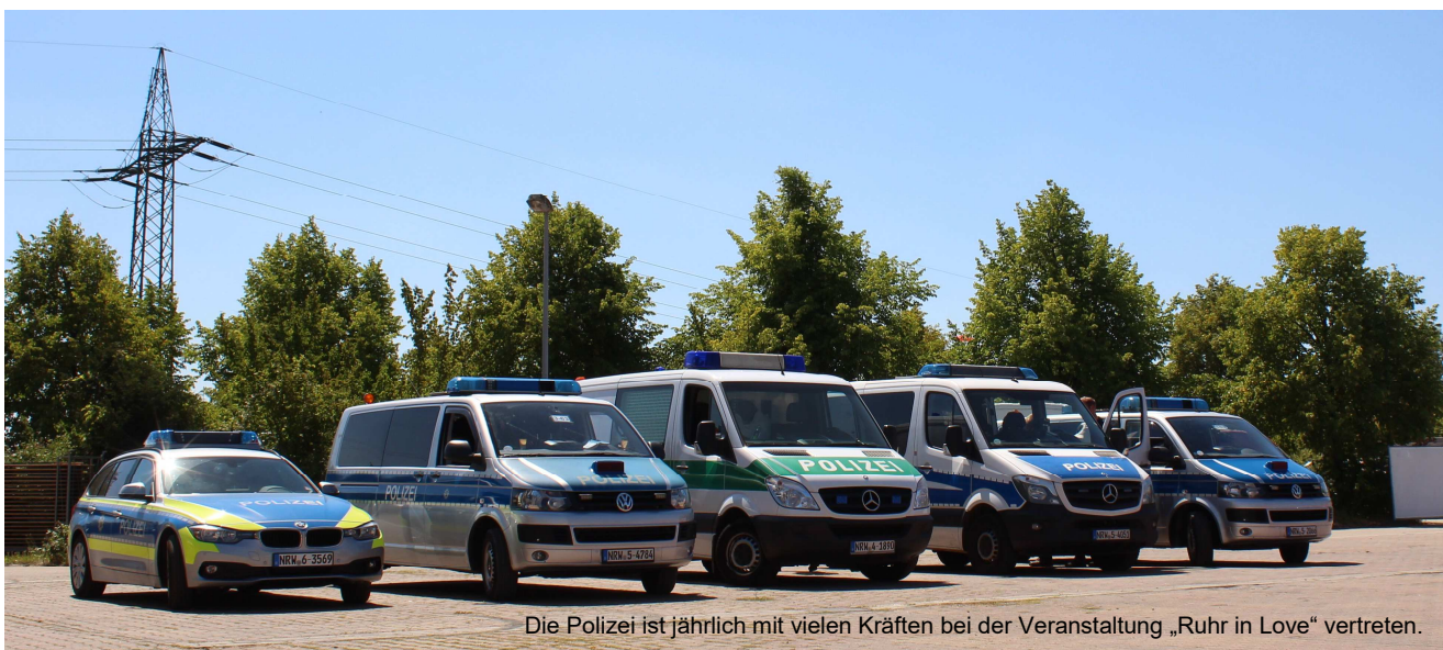
Die Polizei ist jährlich mit vielen Kräften bei der Veranstaltung „Ruhr in Love“ vertreten.