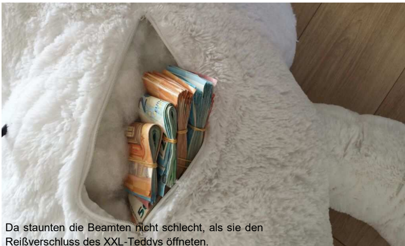
Da staunten die Beamten nicht schlecht, als sie den Reißverschluss des XXL-Teddys öffneten.