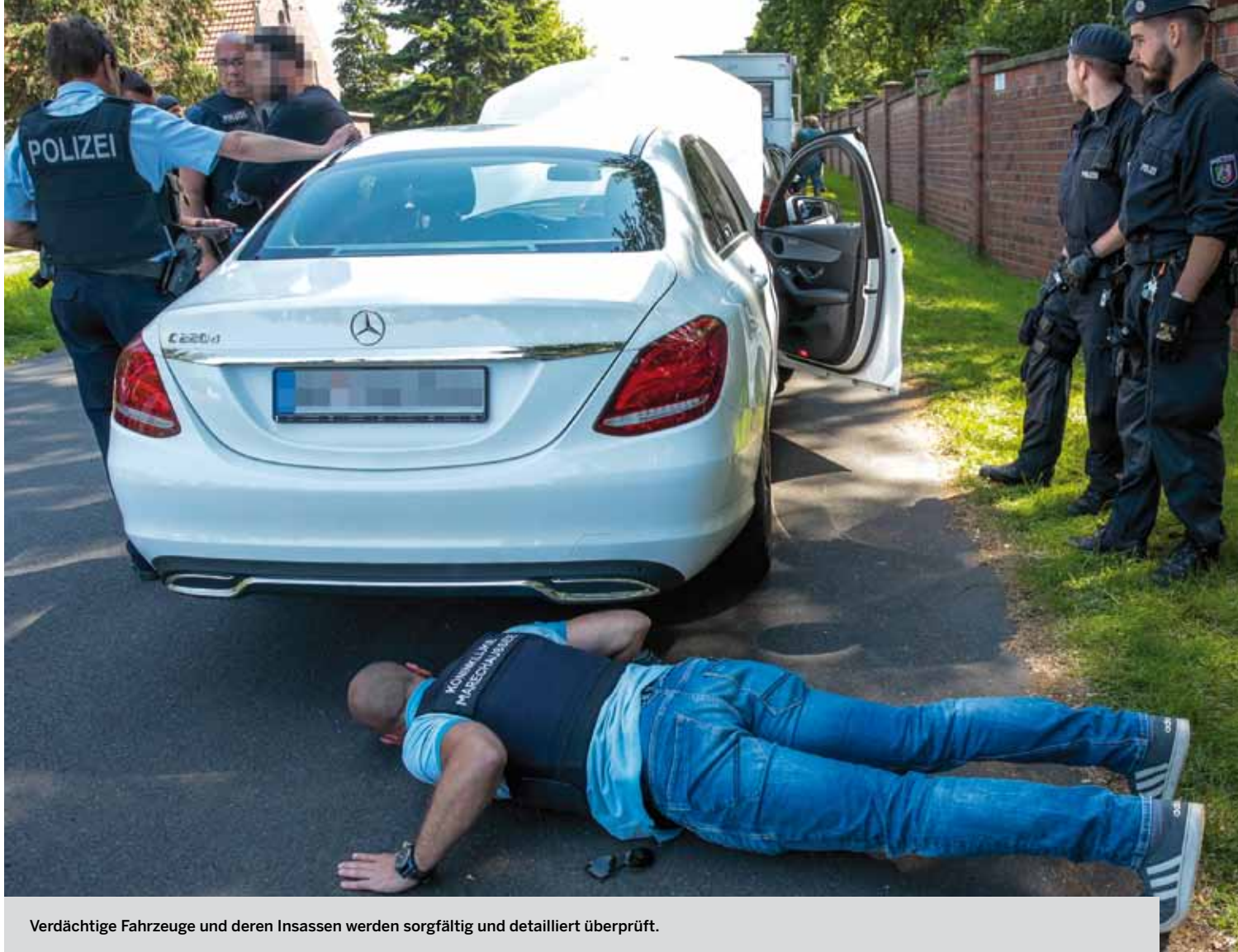
Verdächtige Fahrzeuge und deren Insassen werden sorgfältig und detailliert überprüft.

verdächtige Fahrzeuge auf der BAB 52 zur Kontrollstelle. Fahrzeuge und deren Insassen wurden dort im Anschluss durch die Beamtinnen und Beamten der Landes- und Bundespolizei kontrolliert. »Der erhöhte Fahndungsdruck ist ein wichtiger Baustein zur Verbesserung der Sicherheit in Nordrhein-Westfalen. Die Kontrollen helfen uns außerdem dabei, die Strukturen der Einbrecherbanden besser zu durchschauen«, so Minister Reul.