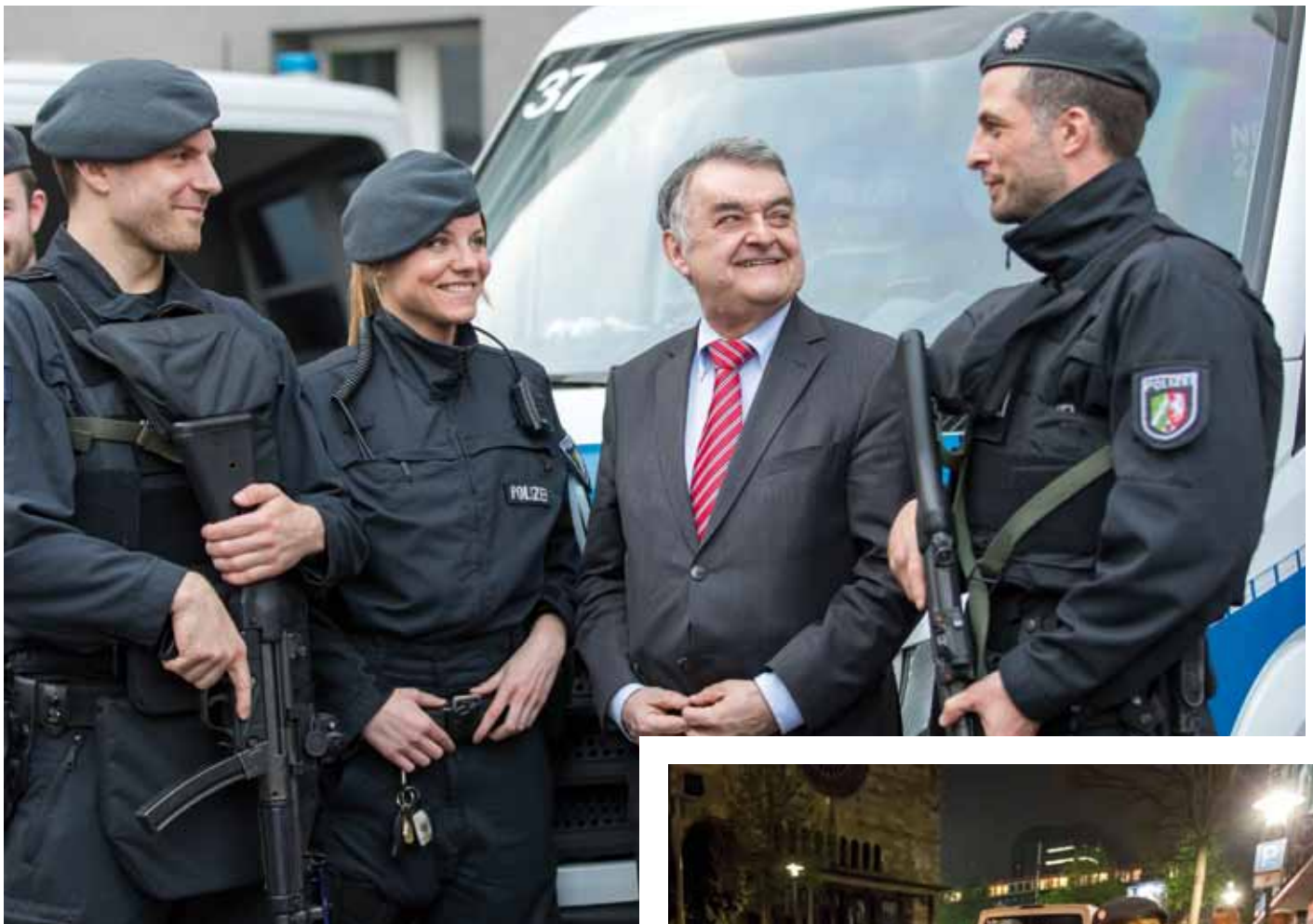
Herbert Reul erläutert die Ziele der Aktion aus Sicht der Landesregierung.