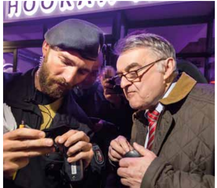
NRW-Innenminister Reul interessiert sich auch für die Details.

Ein Sondereinsatz wie in dieser Nacht ist notwendig, denn in der Vergangenheit gab es im Bereich der nördlichen Essener Innenstadt häufiger gewalttätige Auseinandersetzungen zwischen unterschiedlichen Familienclans. Die meisten beteiligten Personen gehören der Volksgruppe der Mhallamiye an. Sofern Clanmitglieder beteiligt sind, erfahren Polizeibeamte bei der Einsatzbewältigung ein ausgeprägt respektloses Verhalten, gepaart mit hoher Aggressionsbereitschaft. Häufig können Platzverweise nur mit weiteren Verstärkungskräften durchgesetzt werden, da die Betroffenen sich unbeeindruckt geben und sich bewusst den polizeilichen Anordnungen widersetzen. Derzeit sind etliche Gewerbebetriebe in der nördlichen Innenstadt Anlauf- und Rückzugsorte von Clanmitgliedern. Es handelt sich dabei im Einzelnen um Shisha-Bars, Gaststätten, Teestuben, Wettbüros oder ähnliche Geschäftsräume. Insgesamt führt die Situation dazu, dass die Bevölkerung der nördlichen Essener Innenstadt sich nicht mehr sicher fühlt. Betroffen sind die anderen Geschäftsleute und Gewerbetreibenden, aber auch die Anwohner und Besucher dieses belebten und beliebten Stadtviertels.