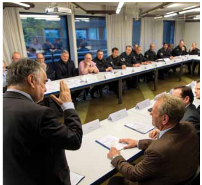
Die Bilanz der Razzia kann sich sehen lassen: U.a. gibt es acht Festnahmen und 20 Strafanzeigen.