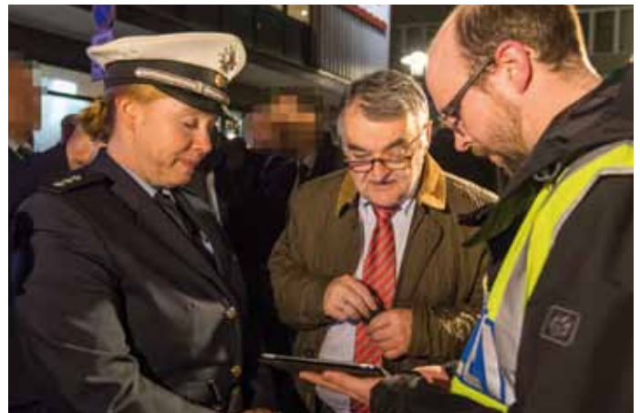
Die Zusammenarbeit der verschiedenen Behörden funktioniert in dieser Nacht vorbildlich.

Die zweite Welle erstreckt sich vom Ende des zweiten Weltkriegs bis ins Jahr 1960. Armut und die fortwährende türkische Politik der kulturellen Unterdrückung in der damals bettelarmen Region waren die Hauptursachen für die Auswanderung. Wegen des Bürgerkriegs im Libanon flüchteten viele Familien in den 1970er bis 90er Jahren nach Deutschland. Allein in Essen leben 5.000 Mhallamiye-Kurden, die sich auf nur zwölf Familien verteilen. Von diesen leben viele von Sozialhilfe, einzelne handeln aber auch mit Heroin oder Crack. Neben dem Rauschgifthandel werden diesen auch Erpressung, Diebstahl, Raub und Geldwäsche zur Last gelegt.