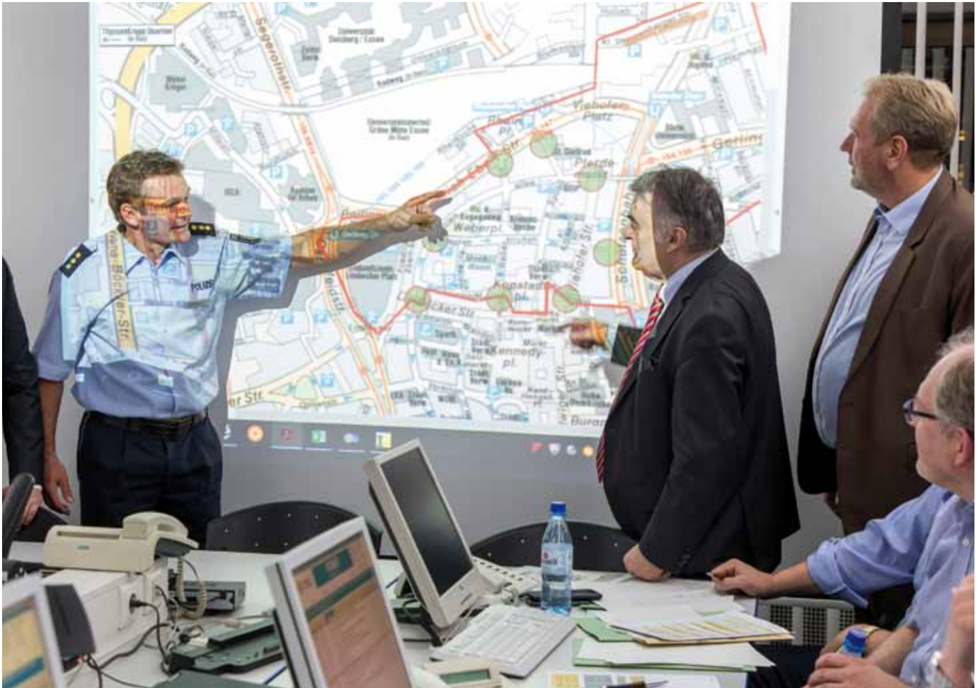
NRW-Innenminister Herbert Reul verschafft sich einen Eindruck von der Größe des Einsatzgebiets.