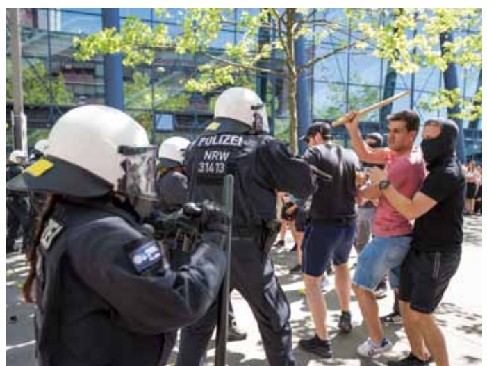
Bei der Leistungsschau konnten sich die Anwesenden vom Können der Polizei NRW überzeugen.