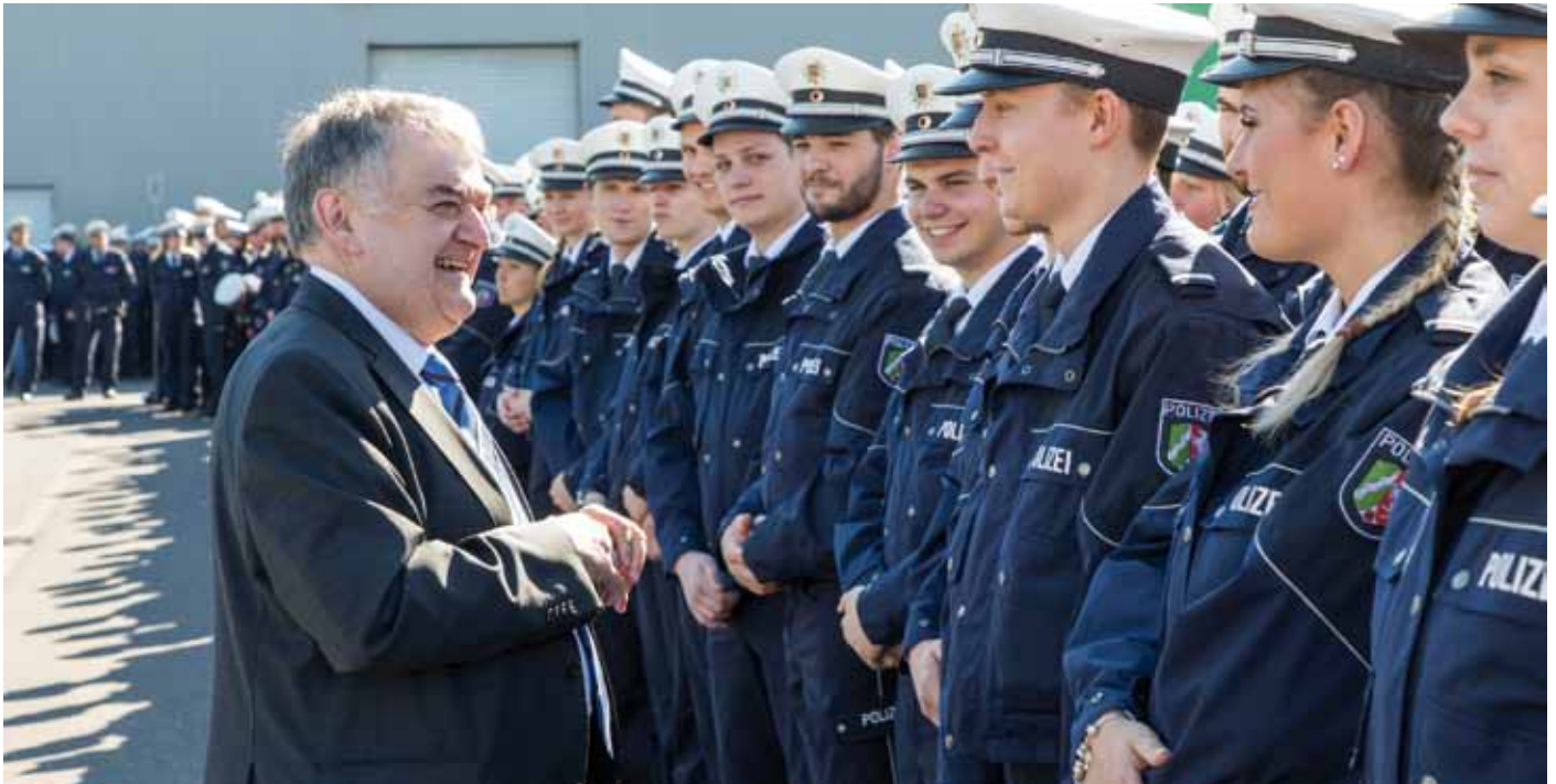
NRW-Innenminister Herbert Reul begrüßt die Kommissaranwärterinnen und -anwärter beim Aufstellen zum Einzug in die Lanxess-Arena.