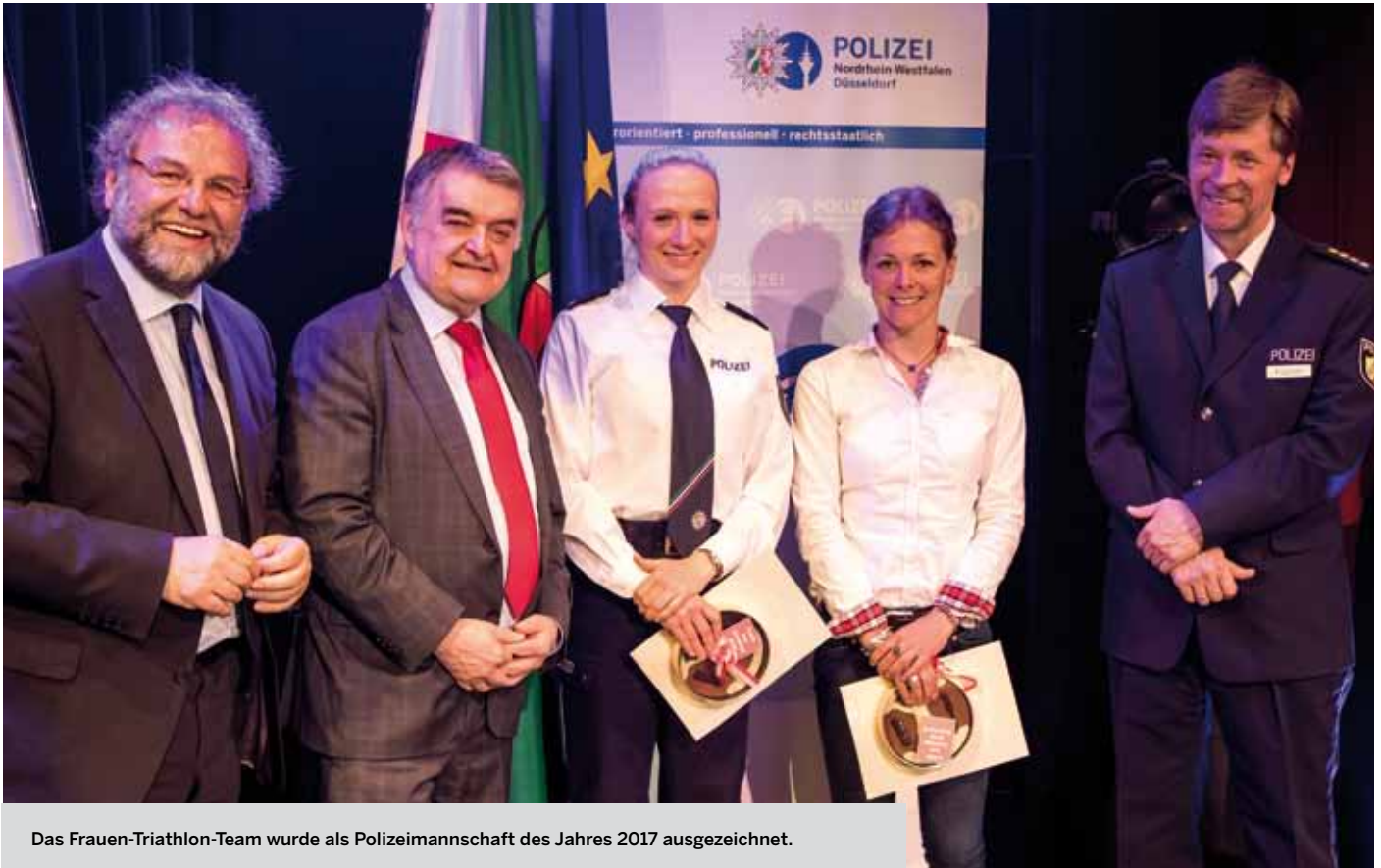
Das Frauen-Triathlon-Team wurde als Polizeimannschaft des Jahres 2017 ausgezeichnet.