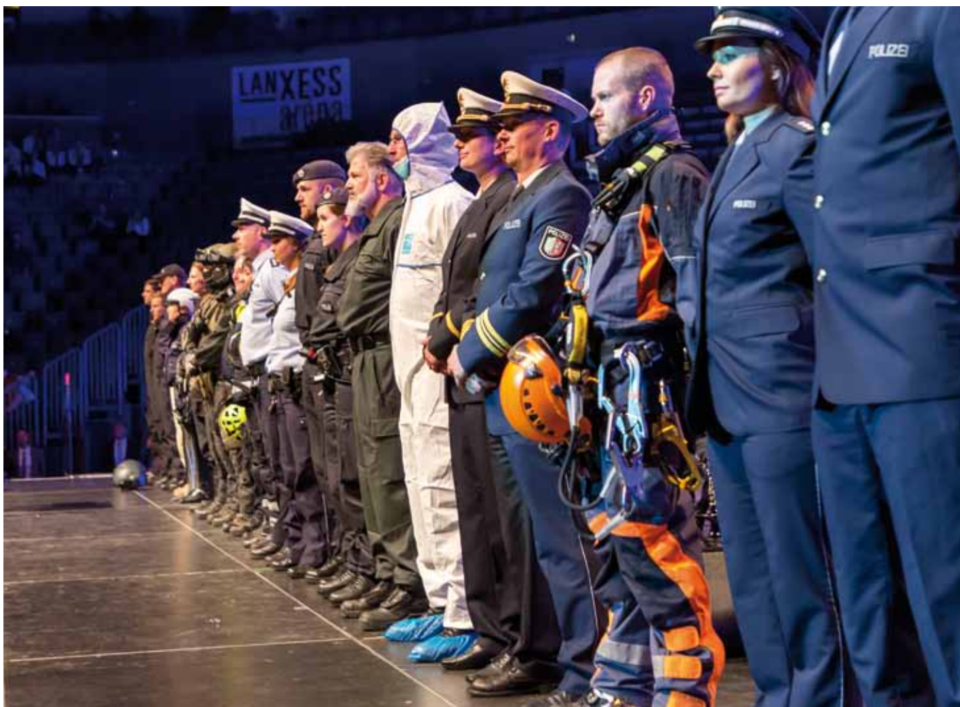
Die Vielfalt der Arbeit bei der Polizei zeigt sich auch in den zahlreichen Uniformen.

Reul schickt die Kommissaranwärterinnen und -anwärter mit einem großen Vertrauensvorschuss in die nächste Phase ihrer Ausbildung: »Ich vertraue Ihnen. Ich glaube, Sie machen alle einen super guten Job,« so Reul. Angesichts der vielfältigen Aufgaben bei der Polizei in NRW schließt er noch eine Bitte an: »Versprechen Sie mir alle, dass Sie die Prüfung bestehen. Denn wir brauchen alle. Wir können auf keinen verzichten.«