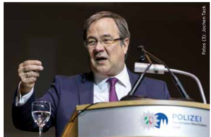
NRW-Ministerpräsident Armin Laschet bei seiner Rede in der Lanxess-Arena

abgeschafft. Laschet weist auch darauf hin, dass das Land 500 zusätzliche Polizeiverwaltungsassistenten einstelle, die sich mit dem Abarbeiten von Verwaltungsvorgängen beschäftigen und die Polizei NRW dadurch entlasten sollen. Er kündigt außerdem an, dass im September die erste von sechs geplanten Beweissicherungs- und Festnahmeeinheiten ihre Arbeit aufnehmen werde. Es soll auch wieder verdachtsunabhängige Kontrollen hinter der Grenze zu Belgien und den Niederlanden geben. Armin Laschet wünscht sich eine Polizei, in der sich auch widerspiegelt, dass inzwischen ein Viertel der Einwohner von Nordrhein-Westfalen eine Migrationsgeschichte haben. Er macht klar, welche Grundeinstellung er sich bei der Polizei wünscht: »Wichtig ist nicht, welche Religion oder welche Herkunft man hat, sondern: Kann ich mich auf dich verlassen? Da spielen Kultur, Herkunft, Religion keine Rolle. Deshalb ist es gut, dass sich auch in diesem Einstellungsjahrgang Menschen mit Migrationsgeschichte wiederfinden.«