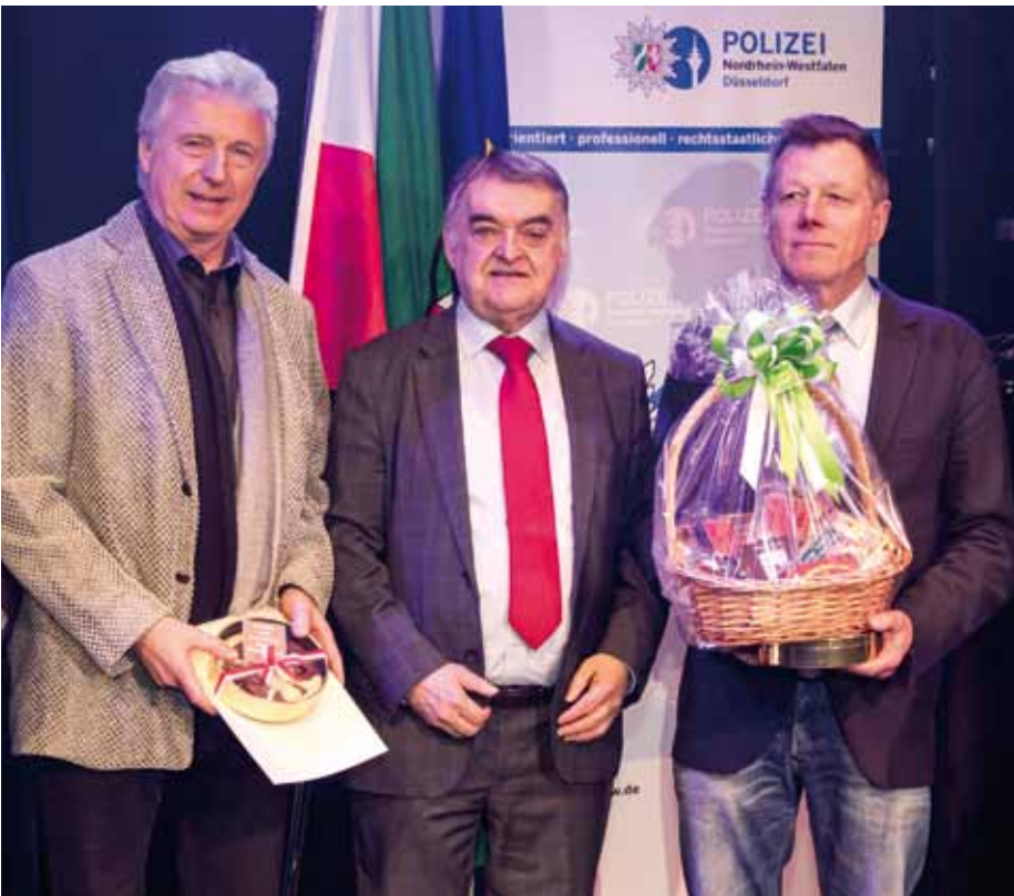
Polizeisportverein des Jahres 2017 aus NRW ist der PSV Dortmund 1922 e. V. Herzlichen Glückwunsch an alle Preisträgerinnen und Preisträger!