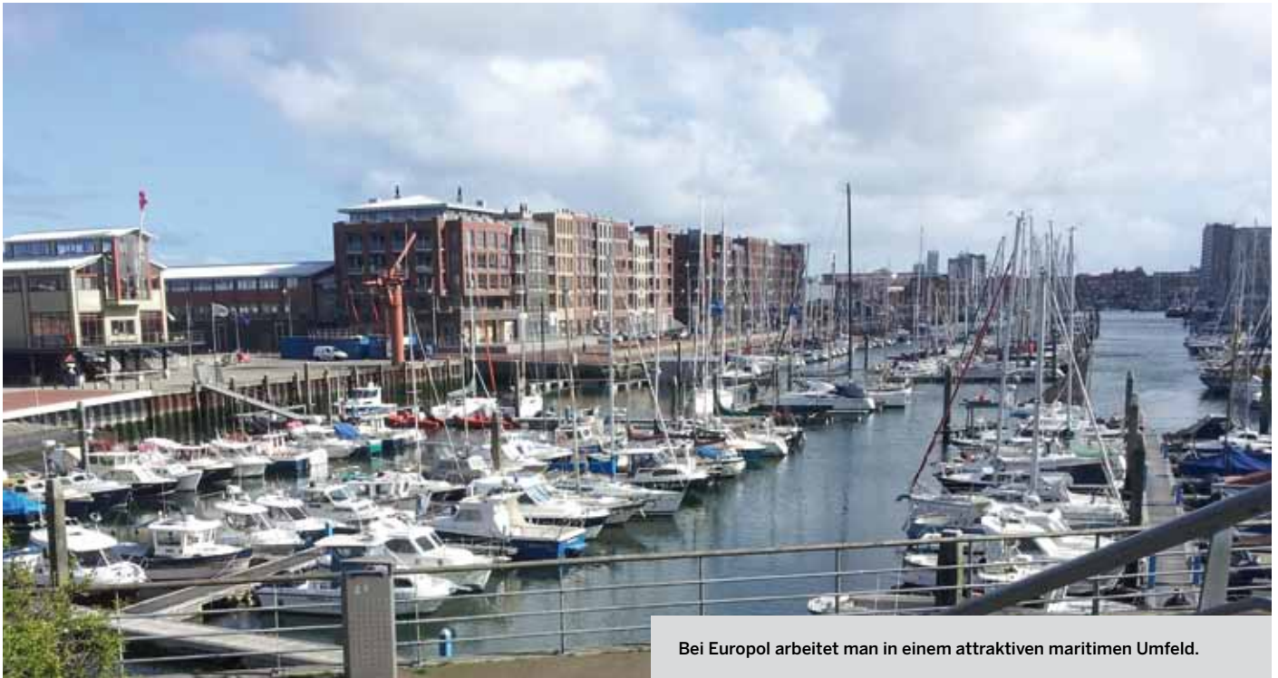
Bei Europol arbeitet man in einem attraktiven maritimen Umfeld.