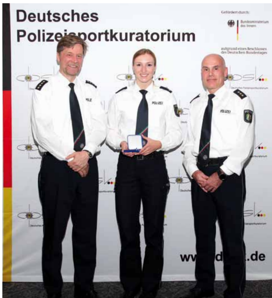
Zu den ersten Gratulanten aus NRW gehörten der Leitende Polizeidirektor Roland Küpper, Polizeisportbeauftragter des Landes NRW, und Polizeidirektor Thomas Link, Fachwart Handball im DPSK vom Polizeipräsidium Hamm.

Am 25. April wurden in Magdeburg im Hotel Ratswaage die erfolgreichsten Polizeisportlerinnen und -sportler aus ganz Deutschland für ihre Leistungen im Sportjahr 2017 ausgezeichnet.