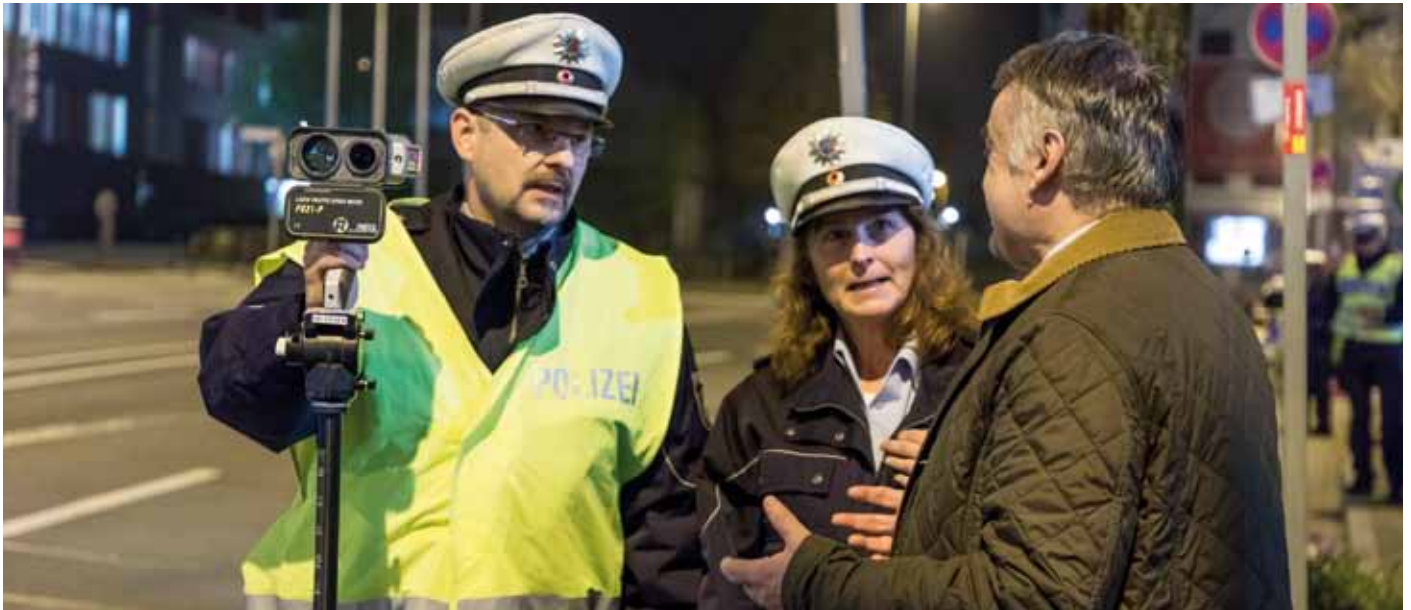
Die Geschwindigkeitsüberwachung gehört zum Maßnahmenpaket dieser Nacht.