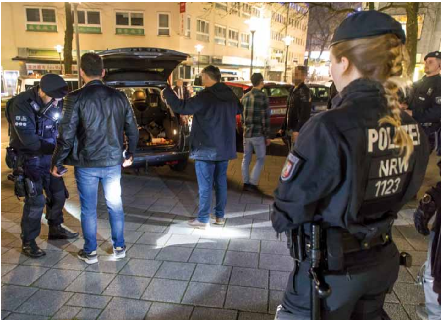
Im Rahmen der Razzia werden nicht nur Bars und Geschäfte durchsucht, sondern auch Fahrzeugkontrollen durchgeführt.