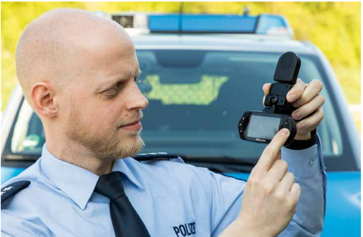
Die Dashcams sind einfach zu bedienen und helfen dabei, Rettungsgassenverweigerer zu identifizieren.