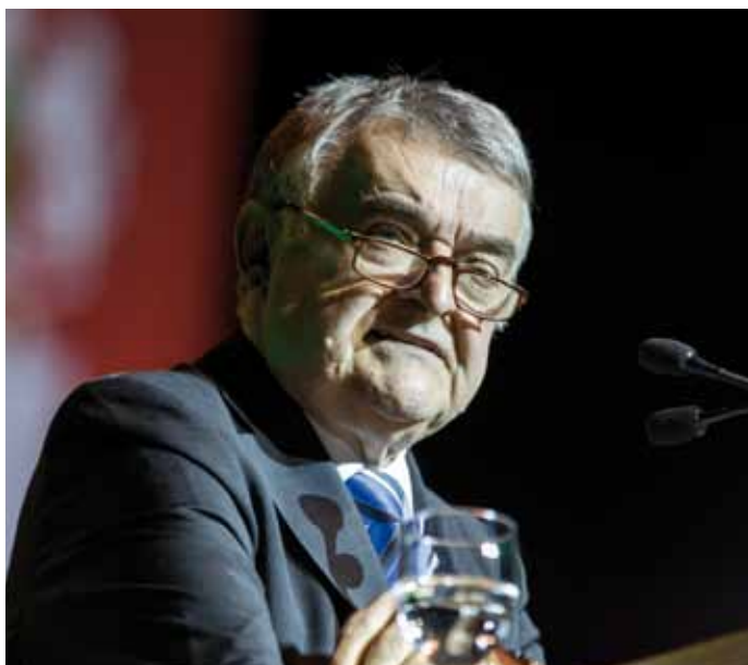
NRW-Innenminister Herbert Reul setzt auf die Empathie und den Teamgeist der Anwärtinnen und Anwärter.

Aus seiner Position als Dienstherr gibt Reul den angehenden Polizistinnen und Polizisten einige Empfehlungen mit auf den Weg: »Treten Sie überzeugt und selbstbewusst auf. Nicht arrogant und besserwisserisch. Zeigen Sie Empathie für die Menschen, die Ihre Hilfe brauchen. Passen Sie aufeinander auf. Unterstützen Sie sich gegenseitig. Und wenn es schwierig wird, seien Sie vorsichtig.«