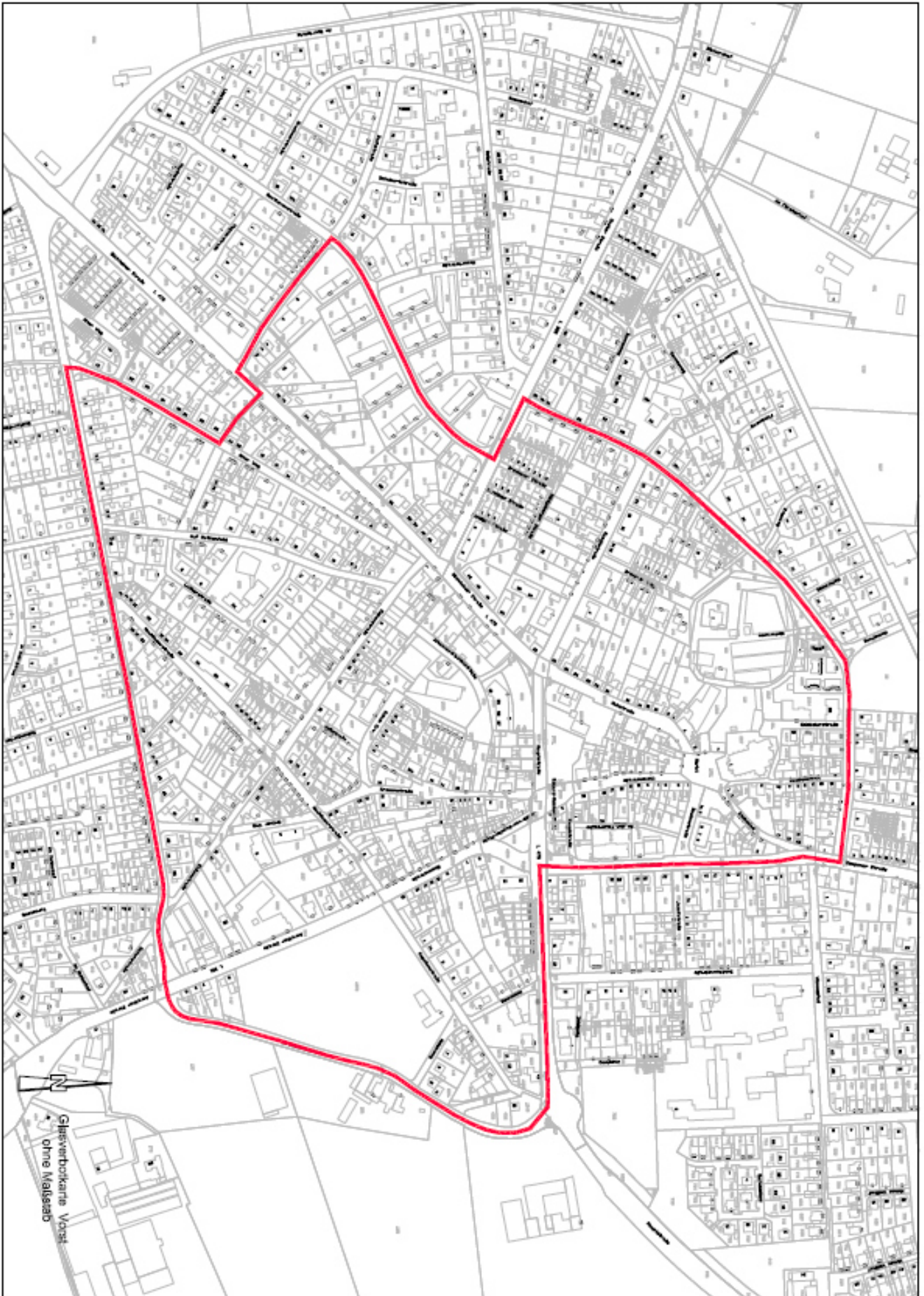
Glasverbotkarte für Vorst