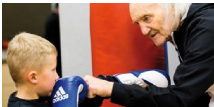
Was sind schon über 80 Jahre Altersunterschied? Ein Jungboxer wird vom Altmeister trainiert

„Tschüss Trainer“, so verabschieden sich die Nachwuchsboxer zufrieden nach der schweißtreibenden Einheit. Westerfeld schnauft noch kurz durch, zieht sich den dicken Wollpullover über und startet zufrieden nach Hause. —