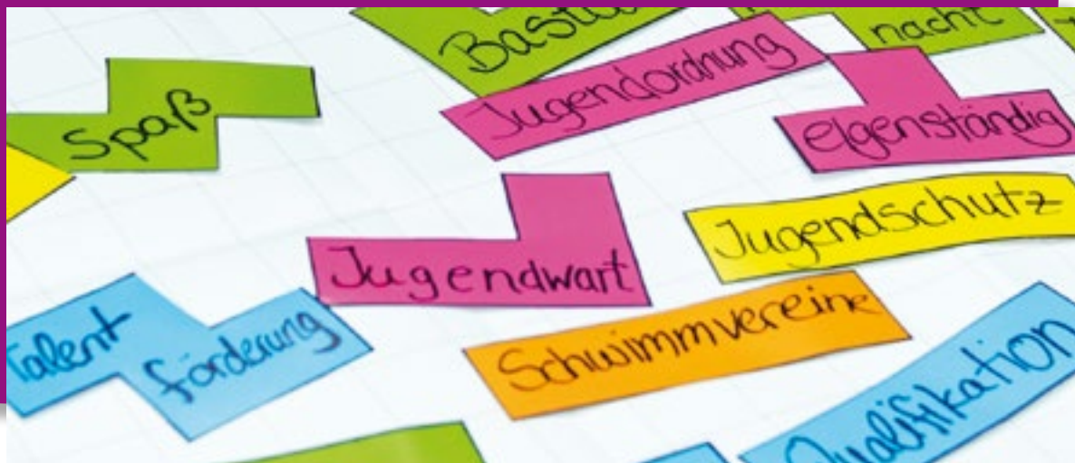
Anhand von Bausteinen wird das Gesamtbild des Vereins in der Kinder- und Jugendarbeit zur Darstellung gebracht – jedes Vereinsprofil ist individuell!

Kooperationen, Partnerschaften und Netzwerke nutzen wir? Und zum Schluss: Welches sind unsere Ziele, die wir in der Kinder- und Jugendarbeit erreichen wollen und mit welchem Selbstverständnis setzen wir diese um?