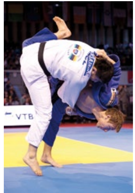
Gerade bei Kontakt- und Kampfsportarten ist ein Impfschutz angezeigt

In der Regel werden Impfungen gut vertragen. Da hohe Trainingsbelastungen ihrerseits aber zu akuten Veränderungen des Immunstatus führen können, sollten Impfungen nach Möglichkeit in Zeiten geringerer Trainings- und Wettkampfbelastung durchgeführt werden, um übermäßige Impfreaktionen zu vermeiden. Unerwünschte Reaktionen treten im Allgemeinen innerhalb der ersten 14 Tage auf, so dass dieses Zeitintervall vor wichtigen Wettkämpfen mindestens eingehalten werden sollte. Bei lokalen Impfreaktionen (z.B. Rötung oder Schweregefühl im Bereich der Injektion) muss meist nur kurzzeitig das Training reduziert werden. —