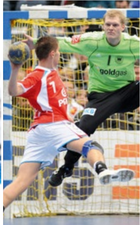
Beachvolleyball, Biathlon oder Handball: Beispiele für Sportarten, die sich trotz der Übermacht des Fußballs durch gute Vermarktung behaupten können

Aufgrund der Medienpräsenz und des wirtschaftlichen Volumens nimmt der Fußball im Bereich des Spitzensports eine besondere Stellung ein. Mit einer Unterstützung durch die Politik und einer finanziellen Förderung ist es auch den anderen Fachverbänden im Sport möglich, eine Talentförderung bis zum Spitzensport zu bewirken. Die Probleme der Förderung von der Breite bis in die Spitze entstehen nicht aus der Konkurrenz zum Fußball, sondern liegen im Bereich der Veränderungen in unserer Gesellschaft, wie flexible Arbeits- und Schulunterrichtszeiten, Freizeitverhalten sowie dem demographischen Wandel.