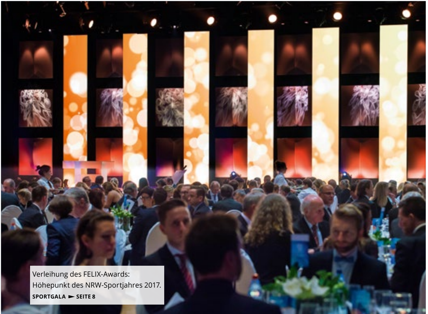
Verleihung des FELIX-Awards: Höhepunkt des NRW-Sportjahres 2017. SPORTGALA ► SEITE 8