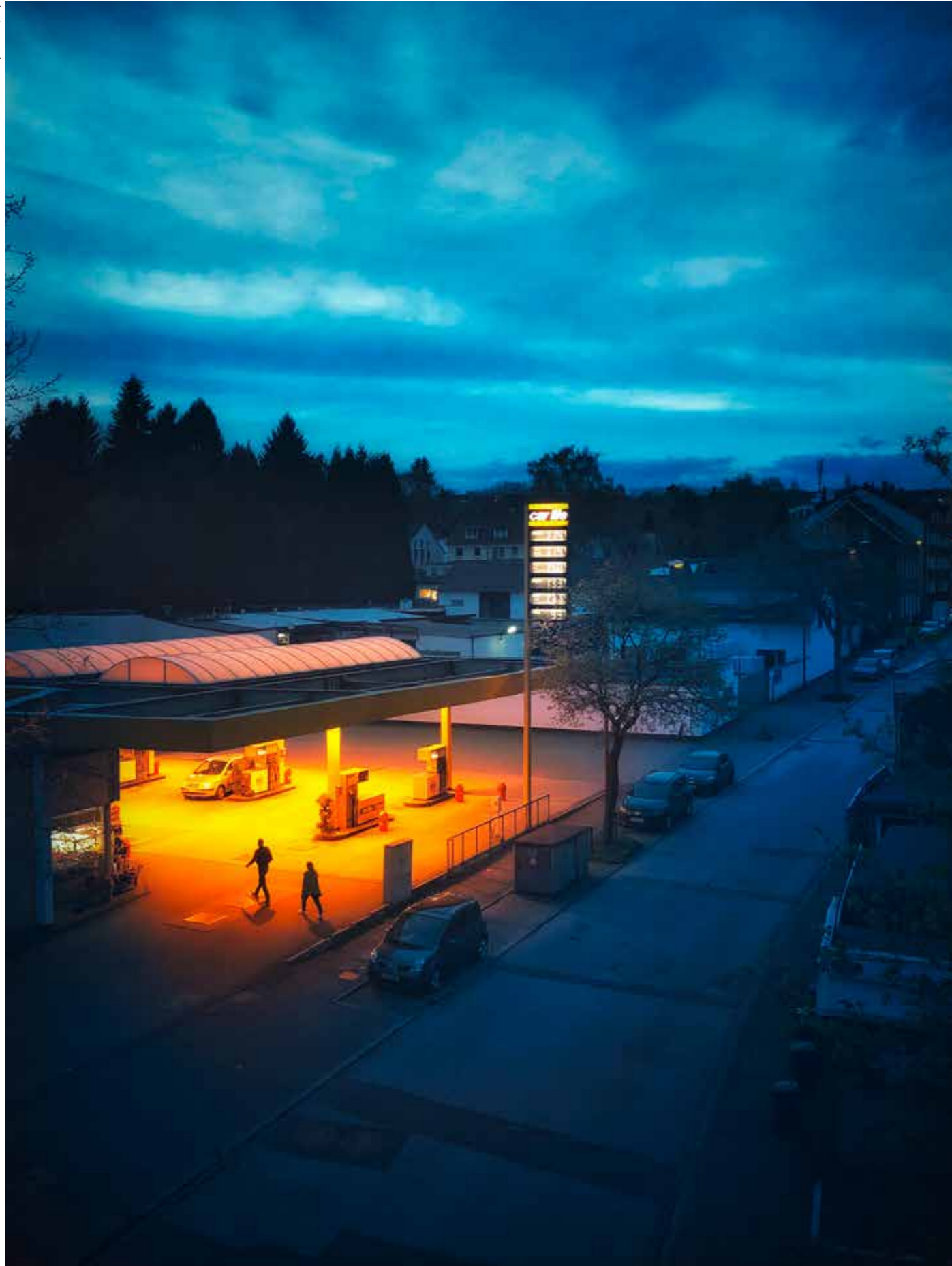
Blaue Stunde auf der Nordbahntrasse.

Design und Beratung seit 16 Jahren - wppt.de