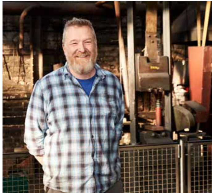
46 Im LVR-Museum Gesenkschmiede Hendrichs sehen die Besucher, wie traditionell Scheren hergestellt wurden.

Herausgeber und Eigentümer: Industrie- und Handelskammer Wuppertal-Solingen-Remscheid Hauptgeschäftsstelle: Heinrich-Kamp-Platz 2 42103 Wuppertal (Elberfeld) · Telefon: 0202 2490-0 · Telefax: 0202 2490-999 · www.wuppertal.ihk24.de Geschäftsstellen: Kölner Straße 8 42651 Solingen · Telefon: 0212 2203-0 · Elberfelder Straße 77 · 42853 Remscheid · Telefon: 02191 368-0 Verantwortlich für den redaktionellen Inhalt (Chefredaktion): Hauptgeschäftsführer Michael Wenge · Telefon: 0202 2490-100 · Telefax: 0202 2490-199 Redaktion: Thomas Wängler Telefon: 0202 2490-110 · Telefax: 0202 2490-119 · t.waengler@wuppertal.ihk.de · Csilla Letay · Telefon: 0202 2490-115 · Telefax: 0202 2490-119 c.letay@wuppertal.ihk.de · Frauke Fechtner · Telefon: 0202 2490-112 · Telefax: 0202 2490-119 · f.fechtner@wuppertal.ihk.de · Verlag, Gesamtherstellung, Anzeigenverwaltung, Layout: wppt:kommunikation GmbH · Verantwortlich: Süleyman Kayaalp · Treppenstraße 17-19 42115 Wuppertal Telefon: 0202 42966-0 · Telefax: 0202 42966-29 · az@bergische-wirtschaft.net · www.wppt.de · Druck: Silber Druck oHG, Niestetal. Erscheinungstermin: 8. Mai 2018