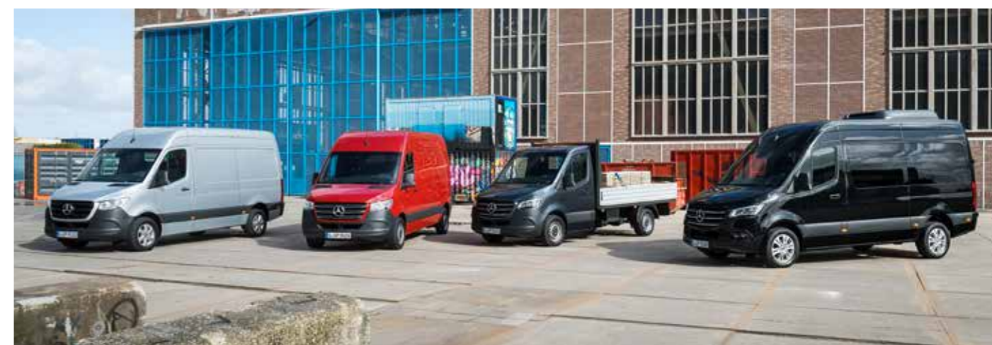
Der neue Sprinter: Intelligent, interaktiv und innovativ

www.mercedes-benz-wuppertal.de · E-Mail: transporter-verkauf@daimler.com · Tel.: 0202-7191-0