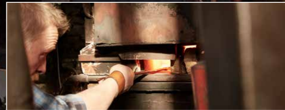
Pludra arbeitet hochkonzentriert mit den heißen Eisen.