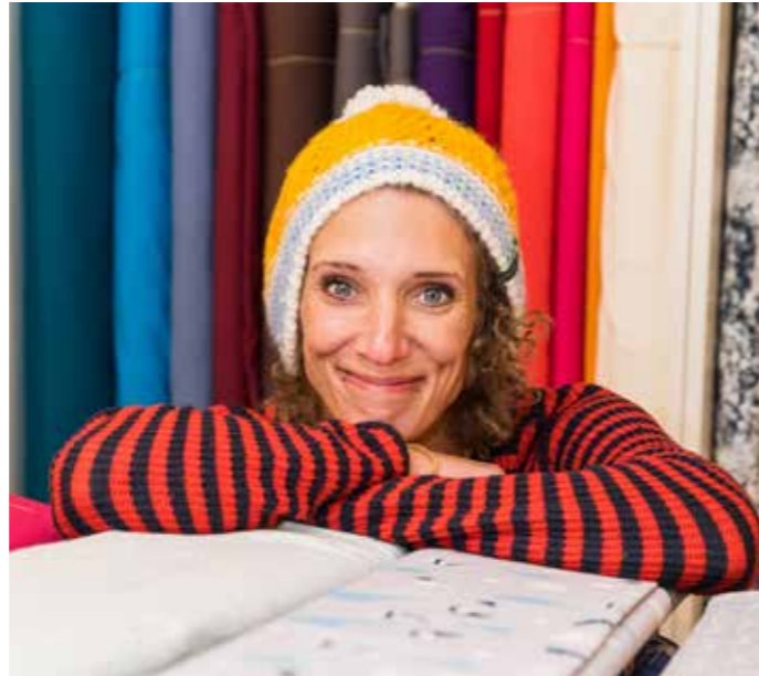
22 Portrait – Palim Palim – Der Name des Ladens klingt wie die bunten Stoffräume in seinen Regalen.