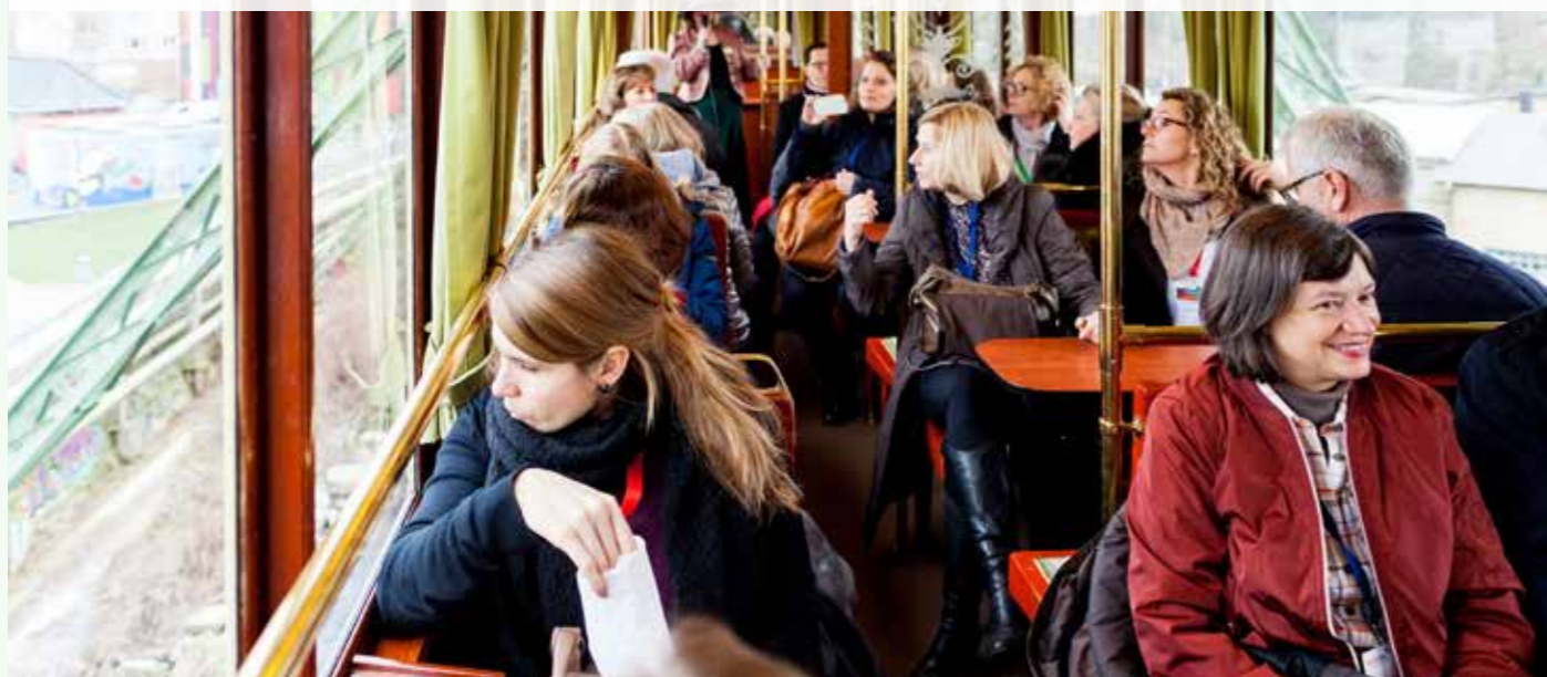
Eine Fahrt im historischen Kaiserwagen durfte bei der Führung durch Wuppertal natürlich nicht fehlen. Schließlich kann man auch schwebend über der Wupper tolle Events durchführen.

„Wow!Wuppertal!“ hieß es im März, als eine Vielzahl von Menschen, die Events für alle möglichen Zwecke planen und durchführen, fachgerecht durch Wuppertal begleitet wurden und die Event-Qualitäten der Stadt kennenlernten. Geschäfts- und Veranstaltungstourismus auf diesem Weg zu „füttern“, spielt auf jeden Fall dem Wirtschaftsfaktor Tourismus zu.