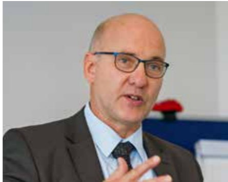
Dr.-Ing. Hermann Monstadt

dass es in der hiesigen Ballungsregion Bergisches Städtedreieck / Mittleres Ruhrgebiet weniger um eine Problematik der Haus- und Landarztversorgung, als um einen Mangel an ausgebildeten Apothekern geht. Bei zu hohen Einstiegshürden durch Abiturnoten gebe es zu wenig Studienplätze und allgemein einen Mangel an diesen immer wichtiger werdenden Fachkräften für die Pharmazie. Hinzu kommt die schärfer werdende Wettbewerbssituation auch im Hinblick auf die Notwendigkeit von sogenannten Versandapotheken sowie die Problematik der Anerkennung ausländischer Abschlüsse. So wolle eine Reihe von syrischen Apothekern im Bergischen Land arbeiten. Auch die geplante Schließung zahlreicher Notfallambulanzen im Land wurde kritisiert. Im Anschluss an das Gespräch mit dem Staatssekretär wählten die Mitglieder des Ausschusses ihre