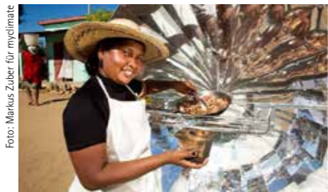
Die Solarkocher helfen, der Abholzung auf Madagaskar entgegenzuwirken.

dings bereits zwei Drittel der Emissionen vermieden werden. Für 2017 werden die CO 2 -Emissionen rückwirkend über das Projekt „Mit Solar- und Energiesparkochern zurück zur grünen Insel Madagaskar“ von dem Projektentwickler Myclimate Deutschland gGmbH ausgeglichen. Dabei erfüllt Myclimate neben ökologischen auch soziale und wirtschaftliche Kriterien – ein wichtiger Punkt für die Barmenia. Die Barmenia-Mitarbeiter konnten über zwei Klimaschutzprojekte abstimmen und so mitentscheiden, welches Projekt unterstützt werden sollte. 59,4 Prozent entschieden sich für das Madagaskar-Projekt, das dabei hilft energieeffiziente Solarkocher für mittellose Haushalte auf Madagaskar anzuschaffen. Die Verbreitung von Solar- und Energiesparkochern wirkt der rasch voranschreitenden Abholzung in Madagaskar effektiv entgegen und reduziert die CO 2 -Emissionen von nicht erneuerbarer Biomasse.