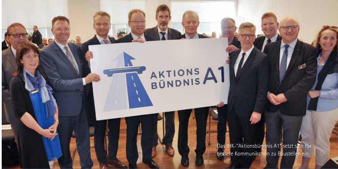
Das IHK-„Aktionsbündnis A1“ setzt sich für bessere Kommunikation zu Baustellen ein.