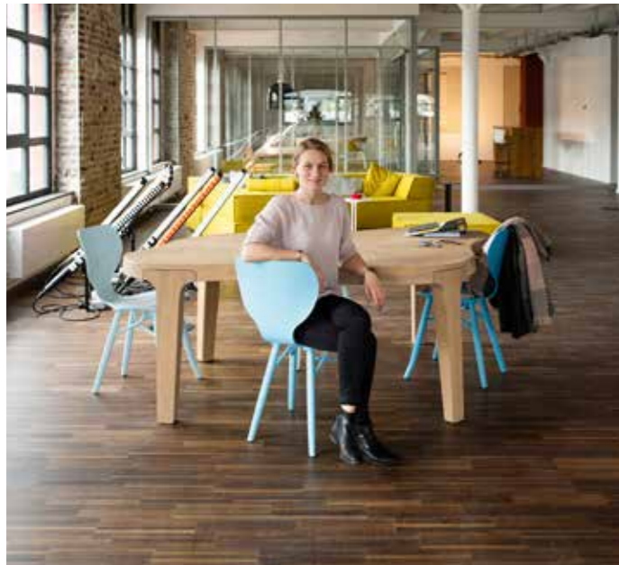
10 Titel – Alter Industriecharme, frische Konzepte – wie alte Bauwerke neu belebt werden.