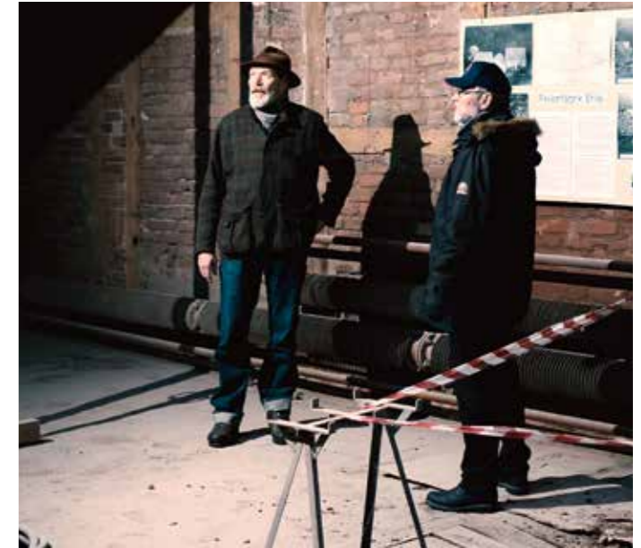
44 Regional – Auf Zeitreise in der ehemaligen Feilenfabrik Ehlis fühlt man die Betriebsamkeit der Vergangenheit.

Abgebildet: Arndt Wilmanns