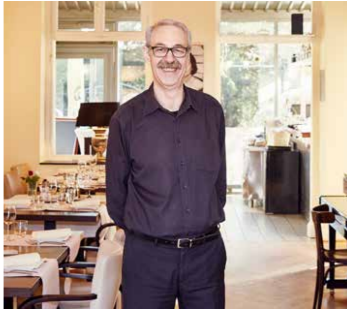
42 Kulinarisches – Kein Gyros, sondern gehobene neu interpretierte griechische Küche gibt es in der Villa Zefyros.