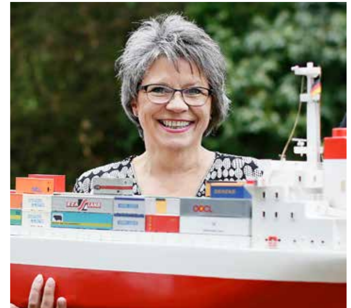
20 Portrait – Die Wuppertaler Reiseagentur Pfeiffer vermittelt ungewöhnliche Urlaube auf Containerschiffen.