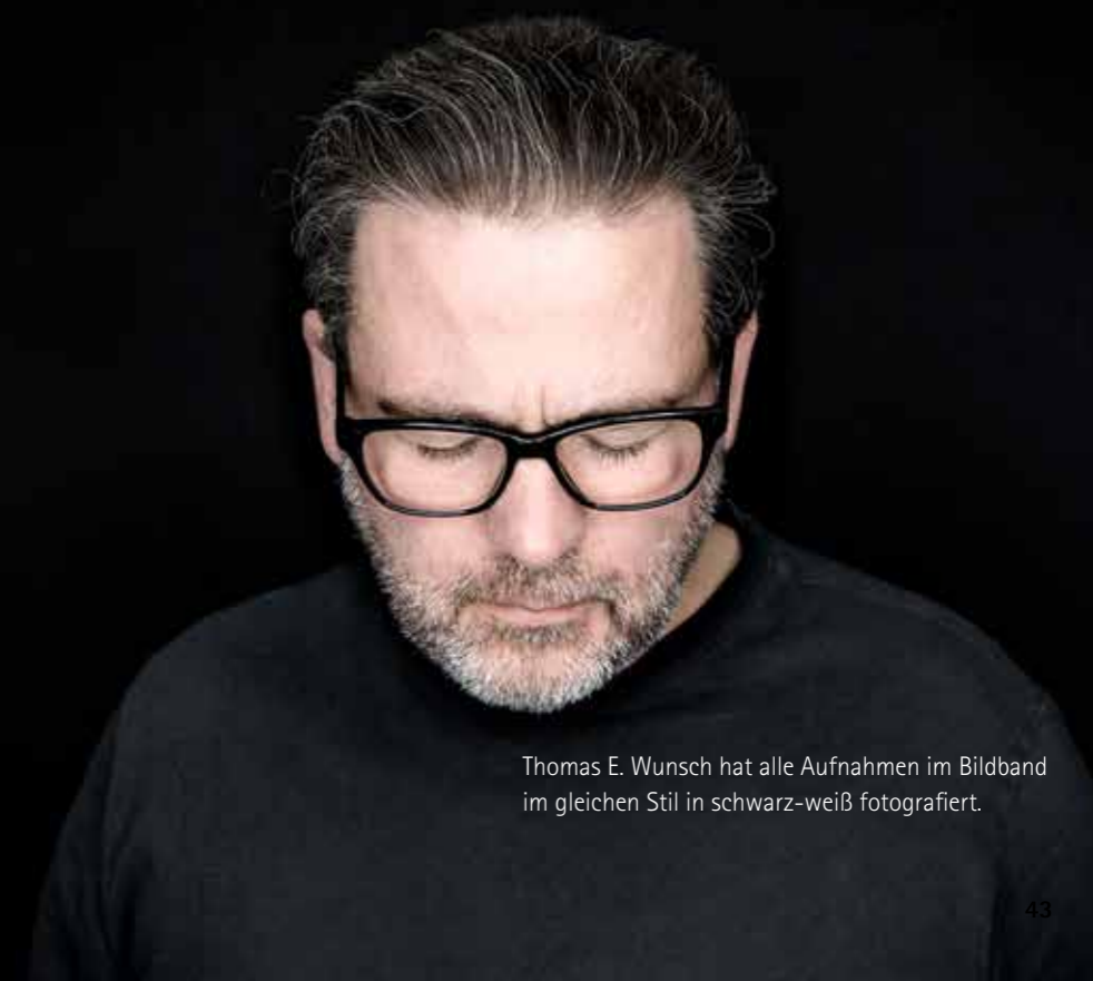
Thomas E. Wunsch hat alle Aufnahmen im Bildband im gleichen Stil in schwarz-weiß fotografiert.

Was treibt Sie an, was motiviert Sie? Ich stelle mich ständig in Frage. Ich reflektiere mich immer wieder. Das ist schon wichtig, um zu lernen und sich weiter zu entwickeln.