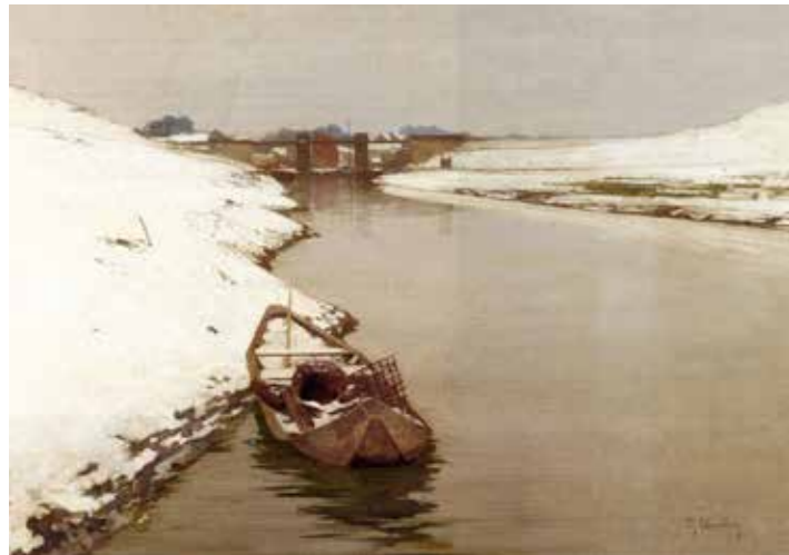
Max Clarenbach Stiller Tag, 01.1902