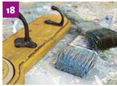
Aus Alt mach Neu