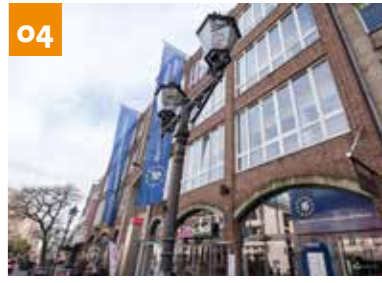
Hochschulen in Neuss