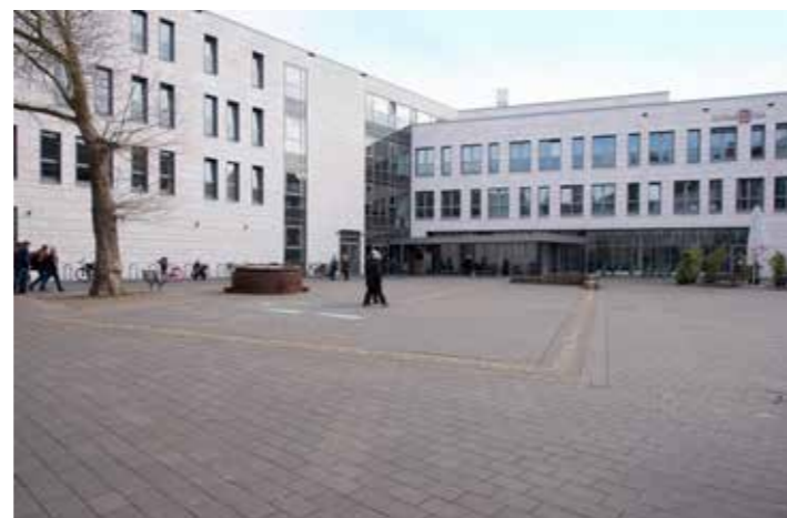
Im RomaNEum befindet sich die Fernuni Hagen und die VHS

Ob Handelsmanagement, Industriemanagement, Logistikmanagement, Wirtschaftsinformatik, General Management, Bachelorstudiengänge oder berufsbegleitende Masterstudiengänge: All das hat die Europäische Fachhochschule an ihrem Studienstandort in Neuss im Angebot.