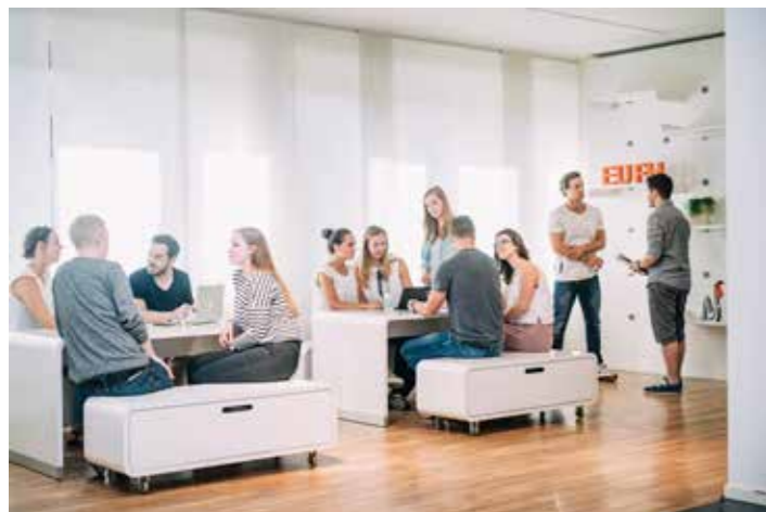
Europäische Fachhochschule Rhein Erft GmbH