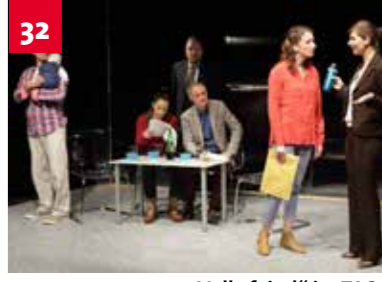
„Volksfeind“ im TAS