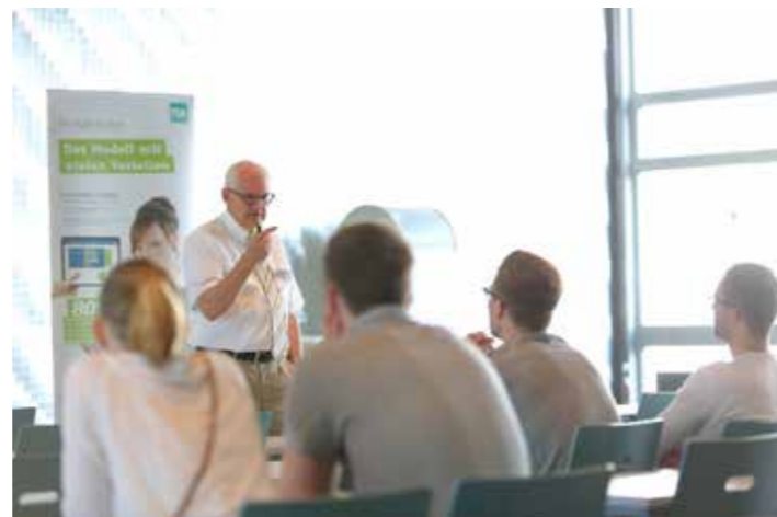
FOM Hochschule für Oekonomie & Management