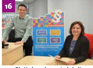
Die Verbraucherzentrale in Neuss