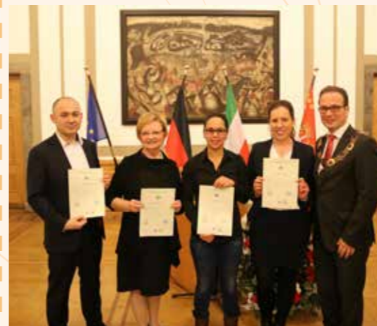
Bürgermeister Reiner Breuer überreichte vier Neubürgern ihre Einbürgerungsurkunden.

Bürgermeister Reiner Breuer begrüßt die 2016 in Neuss neu Eingebürgerten