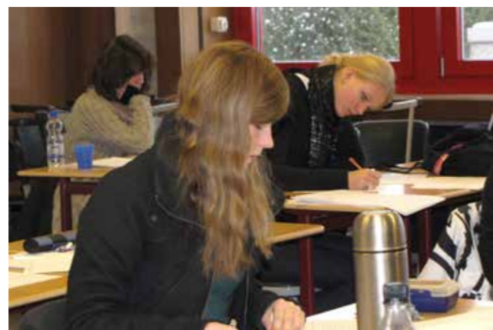
Teilnehmerinnen eines „Jugend braucht Zukunft“ Seminars