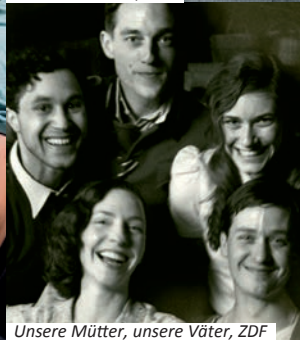
Unsere Mütter, unsere Väter, ZDF