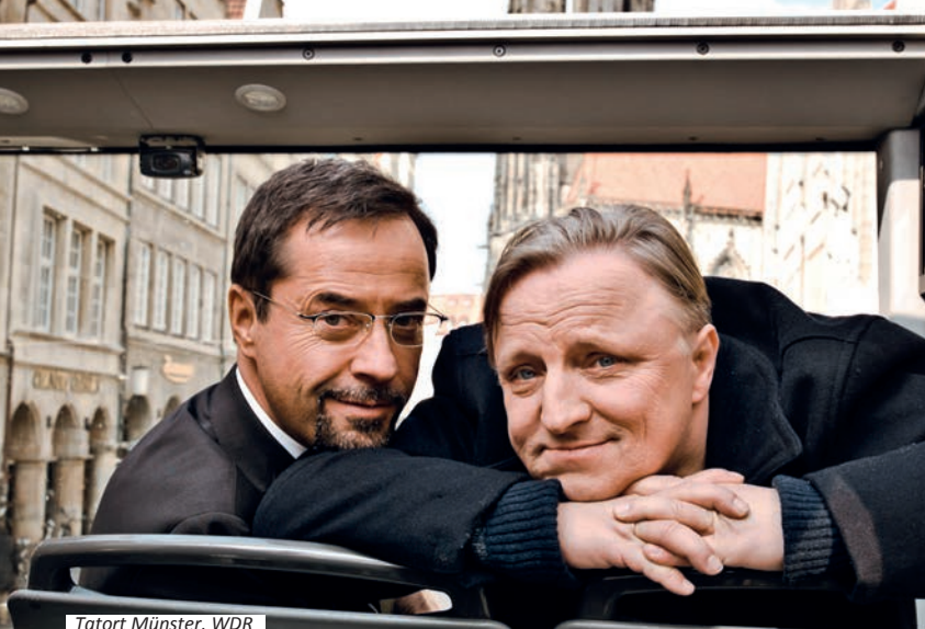
Tatort Münster, WDR