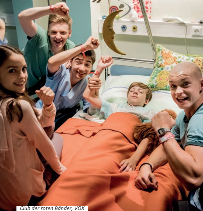
Club der roten Bänder, VOX