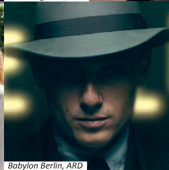
Babylon Berlin, ARD

was zählt und Unter uns zu nennen, die in den MMC Studios entstehen. Zu nennen ist natürlich auch die Lindenstraße , hinter der seit über 30 Jahren die Geißendörfer Film- und Fernsehproduktion steht.