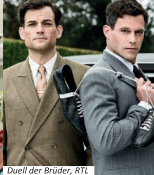
Duell der Brüder, RTL