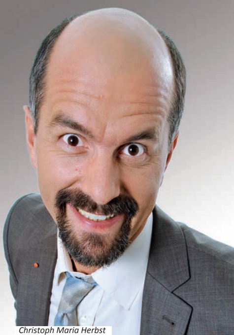
Christoph Maria Herbst