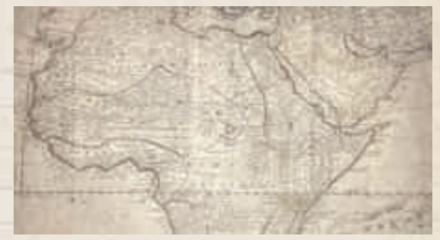
Afrika inspirierte - heute gibt es 2.250 Verkaufspunkte in weltweit 42 Ländern

Während meines Praktikums lief der Film-Klassiker „Jenseits von Afrika“ in den Kinos. Ein beeindruckender Film mit Robert Redford, der die Lebensgeschichte des Safri-Guide und Buschpiloten Denys Finch Hatton verkörpert und unvergleichlich die Abenteuerlust und Freiheit dargestellt hat. Die unendliche Weite Afrikas und der Charakter dieses Mannes waren prägend. Die Schirmakazie als typischer Baum der Savanne wurde das Logo von Fynch-Hatton. Dieses erinnert an die Einzigartigkeit des Kontinents.