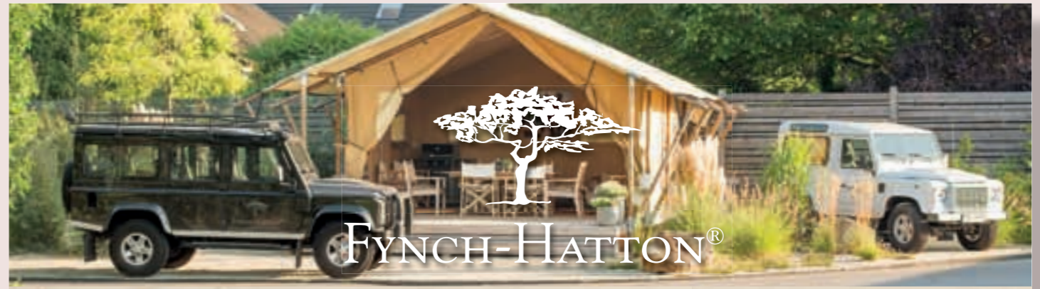
A Taste of Africa. Die Firmenzentrale von Fynch-Hatton in Mönchengladbach. Das Gefühl von Savanne, Natur und warmen Farben ist allgegenwärtig.