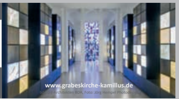
www.grabeskirche-kamillus.de Architekten BDA, Foto: Jörg Hempel Photodesign