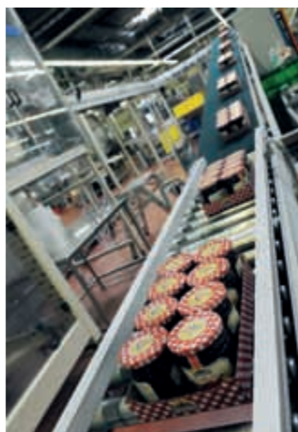
Moderne Konfitüren-Produktion in Mönchengladbach

Niederrhein betreibt das Unternehmen ein modernes Werk, das ihm eine nachhaltige Produktion ermöglicht. Natürlich zertifiziert. Das schmeckt nicht nur den Kunden. Es freut auch die Umwelt. Künftige Generationen hat MÜHLHÄUSER also bereits fest im Blick. Das gilt auch für den Know-how-Transfer. Deshalb ist das Unternehmen ein wichtiger Ausbildungsbetrieb in der Region. Lebensmitteltechniker starten hier genauso ins Berufsleben wie Oecotrophologen oder Groß- und Außenhandelskaufleute. Dafür kooperiert man u.a. mit der Hochschule Niederrhein. Für hochwertigen Fruchtgenuss auf Deutschlands Frühstückstischen dürfte also langfristig gesorgt sein. www.muehlhaeuser.biz