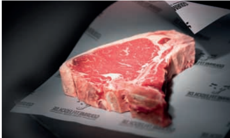
Einer der Klassiker: American T-Bone-Steak – bis zur perfekten Reifung von uns für Sie gelagert

Als Geschäftsführer Burkhard Schulte 2008 mit GOURMETFLEISCH.DE einen Onlineversand für außergewöhnliche Steaks und Fleischspezialitäten eröffnete, hat er in Deutschland einen völlig neuen Markt mitbegründet. Das Angebot des Onlineshops lässt die Laien zwischen Staunen und Träumen zurück, während Fachmännern, Köchen und der BBQ-Szene das Wasser im Mund zusammenläuft. Das Angebot reicht vom heimischen Simmentaler Rind über die besten Rassen aus Irland, Brasilien und den USA bis zu Wagyu aus Neuseeland und Kobe aus Japan. Außerdem Bison, edle Schweinerassen wie Iberico und Duroc, Lammfleisch, Geflügel, Lachs, Seafood und handgemachte Wurst- und Burgerpatties. Die erfahrenen Metzgermeister lassen dem wertvollen Fleisch während der Verarbeitung all ihre Erfahrung angedeihen. Diverse Auszeichnungen und zufriedene Kunden geben den hohen Ansprüchen des Unternehmens Recht – und motivieren auch weiterhin