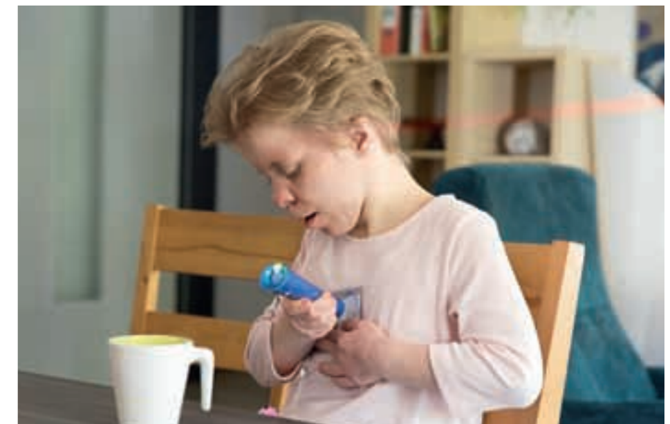
Endlich kommunizieren – der Any-book-reader, macht es möglich