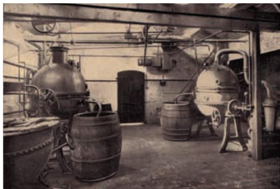
Traditionelle Pflaumenmuszubereitung in den 1920ern

ausgewählten Früchten zum Beispiel. Oder die Sorgfalt bei deren Zubereitung. Und natürlich der Unternehmensname, mit dem man sich bis heute zu seinen Wurzeln bekennt. Auch das Thüringer Pflaumenmus gibt es noch. Nahezu unverändert, ist es mittlerweile das mit Abstand beliebteste Pflaumenmus Deutschlands. Aber eine Traditionsmarke ist nur erfolgreich, wenn sie gepflegt wird. Neben Identität spielt Entwicklungsfähigkeit eine entscheidende Rolle. Deshalb stellt MÜHLHÄUSER seine Konfitüren, Marmeladen, Fruchtaufstriche und Gelees seit rund zehn Jahren in Mönchengladbach her. Am