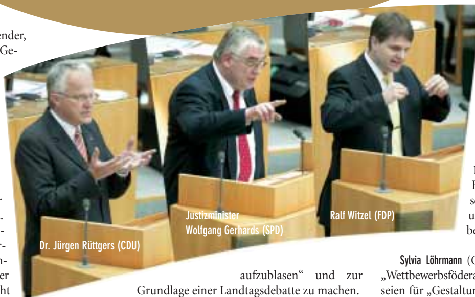
Dr. Jürgen Rüttgers (CDU)