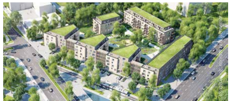
Die Neusser Bauverein AG errichtet auf dem Gelände der Sauerkrautfabrik das Leuchtenberg-Quartier.