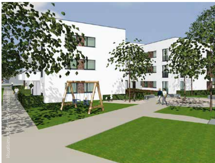
Bezahlbare und barrierefreie Wohnungen entstehen an der Wolberostraße.

worden. Diese wurden abgesägt, dann wurden die Balkone komplett saniert, bekamen einen Fliesenbelag und solche Geländer wie an der Wingenderstraße. Nach dreieinhalb Monaten war die Maßnahme abgeschlossen. „Auch an der Engelbertstraße konnten wir dadurch die Optik der Gebäude stark verbessern“, sagt Weiwadel.