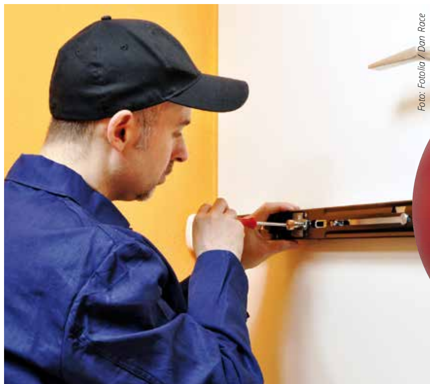
Die Neusser Bauverein AG bezuschusst 125 Panzerriegel für die Wohnungseingangstür.

Herbst und Winter sind die Hauptsaison für Einbrecher. Das belegen Zahlen der Polizei auch für den Rhein-Kreis Neuss. Danach werden in der dunklen Jahreszeit doppelt so viele Einbrüche begangen wie in den Monaten von April bis September. Oft ist es dabei nicht allein der Sachschaden, sondern es sind vielmehr die psychischen Belastungen, unter denen die Bewohner nach der Tat leiden, dem Gefühl, dass Fremde in ihrem Zuhause waren. Der einfachste Schutz dagegen ist eine mechanische Lösung. So setzt sich der Neusser Bauverein zu seinem 125-jährigen Bestehen auch für das Thema Sicherheit seiner Mieter ein. Unter dem Titel „125 Panzerriegel“ bezuschusst das Unternehmen für jedes Jahr seines Bestehens einen von insgesamt 125 Panzerriegeln für die Wohneingangstür. Ein Panzerriegel kostet in der Regel rund 400 Euro, 100 Euro gibt die Neusser Bauverein AG dazu und kümmert sich auch noch um den fachgerechten Einbau. Wer einen solchen Riegel haben möchte, meldet sich unter Telefon 02131/127-444 oder per E-Mail an: mieterzeitung@neusserbauverein.de .