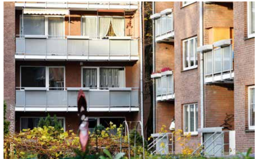
Die Balkone an der Wingenderstraße wurden saniert. Nun erstrahlen die Fassaden dort – wie auch an der Engelbertstraße – in neuem Glanz.

digter Beton musste komplett wieder aufgebaut werden“, berichtet der für Planung und Ausführung zuständige Bauleiter Weiwadel. Dann wurde der Estrich neu gegossen, der dank des verwendeten Materials – einem wasserdichten Balkonabdichtungssystem – nun höchst belastbar und nahtfrei ist. Auch wurden die korrodierten Stahlgeländer gegen verzinkte Stahlgeländer ausgetauscht, die ehemaligen Kunststoff- durch hochwertige Glasfüllungen ersetzt. Für ein ansprechendes Bild sorgen zudem die integrierten, farblich an die Geländer angepassten Blumenkastenfassungen – die entsprechenden Einsätze stellt der Bauverein den Mietern unentgeltlich zur Verfügung. Außerdem wurden an die Erdgeschosswoh-