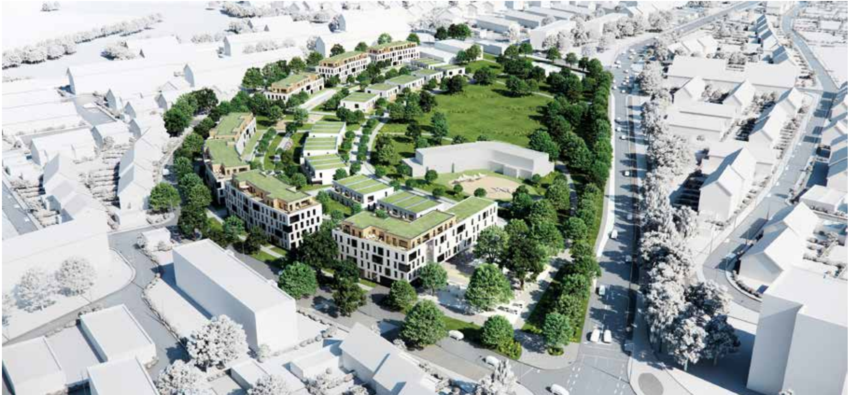
Eine Wohn-Oase im Grünen: So soll das neue Quartier in Neuss-Weckhoven schon bald aussehen.