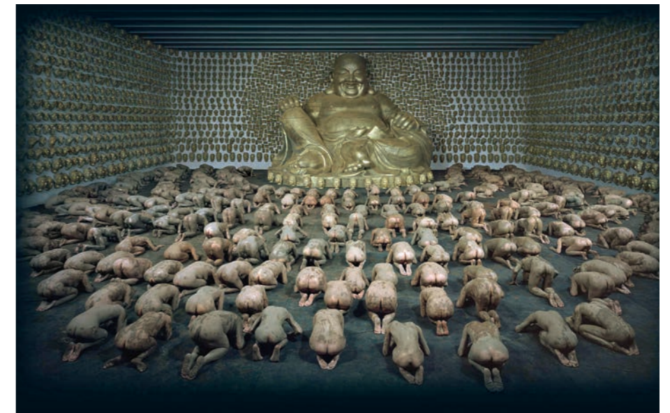
WANG QINGSONG Temple, 2013 C-Print 180 x 300 cm, © Wang Qingsong

Jedes der beteiligten China-8-Museen hat einen Schwerpunkt gesetzt – gemäß dem eigenen Ausstellungsprofil: Essen hat sich auf Fotografie kapriziert, in all