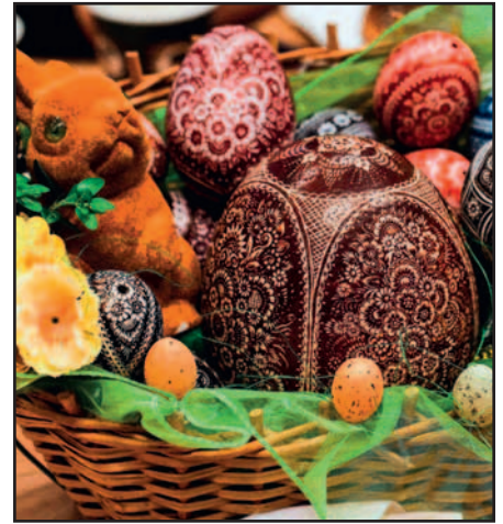
Ostereier in Kratz- und Gravurtechnik sind in Hösel zu sehen.

Den Veranstaltern geht es vor allem darum, Traditionen zu pflegen, die regionale Kultur zu beleben und in der Bevölkerung bekannt zu machen. Bewertet werden deshalb ausschließlich Arbeiten, die in den für die Region charakteristischen traditionellen Techniken hergestellt werden: Kratz- beziehungsweise