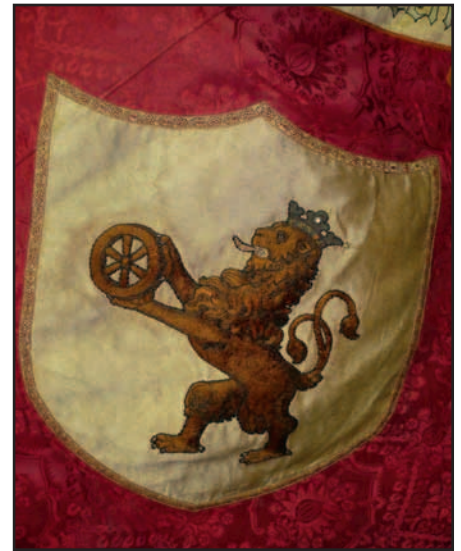
Ausschnitt aus der Fahne des katholischen Arbeitervereins mit dem Ratinger Stadtwappen (1904).

Oft bewundert werden auch die Vereinsfahnen, Zeugnisse längst vergangener Zeiten, zum Teil sehr schön gestaltet und mit unterschiedlichen Motiven bestickt. Früher wurden die Fahnen öffentlich gezeigt, heute existieren Sie nur noch als Archivgut. Zu diesem textilen Bereich gehören auch die vielen Messgewänder, die aber zum größeren Teil auch in ent-