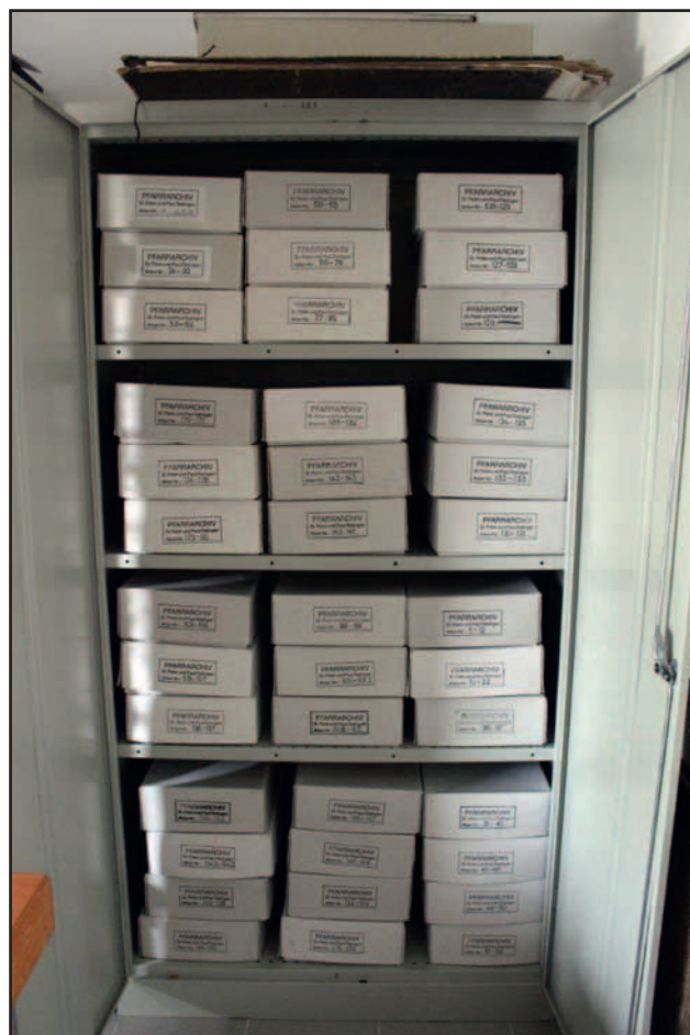
In Stahlschränken und säurebeständigen Kartons werden die Archivalien sicher aufbewahrt.

Ähnlich ging es mit den alten Messbüchern, eine Sammlung, die bis ins 16./17. Jahrhundert zurückgeht. „Können Sie alles zum Antiquar geben, denn diese Bücher haben wir in Köln zig-fach“, wurde mir empfohlen. Ich war anderer Meinung: „Die bleiben hier vor Ort, denn hier wurden sie benutzt und