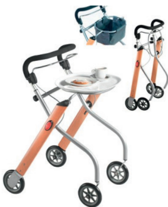
Indoor - Rollator

Bleiben Sie mobil Gratis Rollator Sicherheitscheck