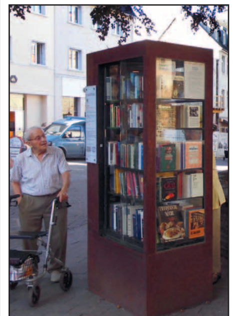
Die Bücher-Box auf dem Marktplatz neben St. Peter und Paul.

Tipps: www.simplify.de/die-themen/sachen/aufraeumen