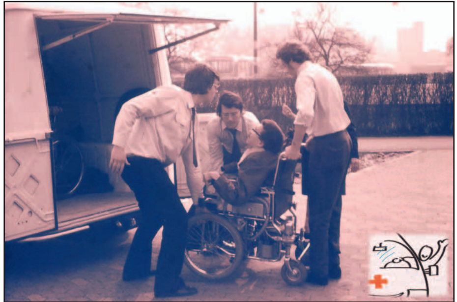
Foto aus den Anfangsjahren des Behindertenfahrdienstes. Muskelkraft musste die fehlende Rampe und Hubvorrichtung ersetzen.

Nach den bisher geltenden Richtlinien dürfen diesen Fahrdienst ausschließlich Personen nutzen, die auf die Benutzung eines Rollstuhles angewiesen sind. Die entsprechenden Richtlinien wurden durch den Kreis Mettmann zum 1. Januar 2017 geändert: Jetzt dürfen alle Personen, die in ihrem Schwerbehindertenausweis das Merkzeichen „aG“ (außergewöhnliche Gehbehinderung) haben und keine Steuervergünstigung in Anspruch nehmen, diesen Fahrdienst für private Fahrten nutzen dürfen. Der Eigenanteil wurde von 20 auf 30 Cent pro Kilometer erhöht. Für die bisher Berechtigten gilt noch eine Übergangszeit bis einschließlich 30. Juni.