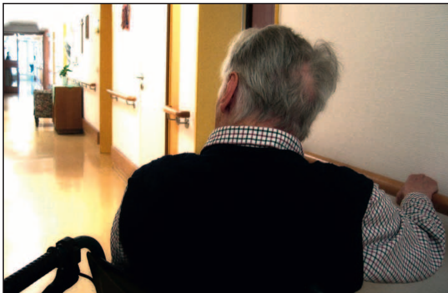
Seit Januar gibt es fünf Pflegegrade statt drei Pflegestufen.

Wer im neuen Jahr allerdings zum ersten Mal einen Antrag auf Pflegebedürftigkeit stellt, wird nach einem neuen Begutachtungssystem in die Pflegegrade eingestuft. Zukünftig gilt eine ganzheitliche Betrachtung nach sechs neuen Modulen, bei denen kognitive und kommunikative Fähigkeiten oder Verhaltensweisen und psychische Problemlagen eine Rolle spielen. „Damit wird geistig beding-