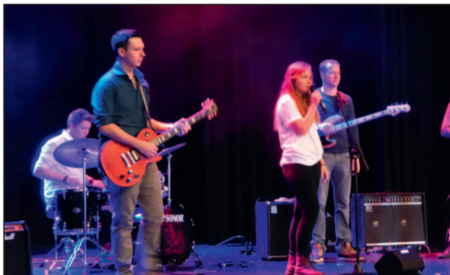
Die „NuCombo“, die Jazz-Rock-Formation der Städtischen Musikschule, in Aktion.

FTS = Ferdinand-Trimborn-Saal, Poststraße 23 Der Eintritt ist frei.