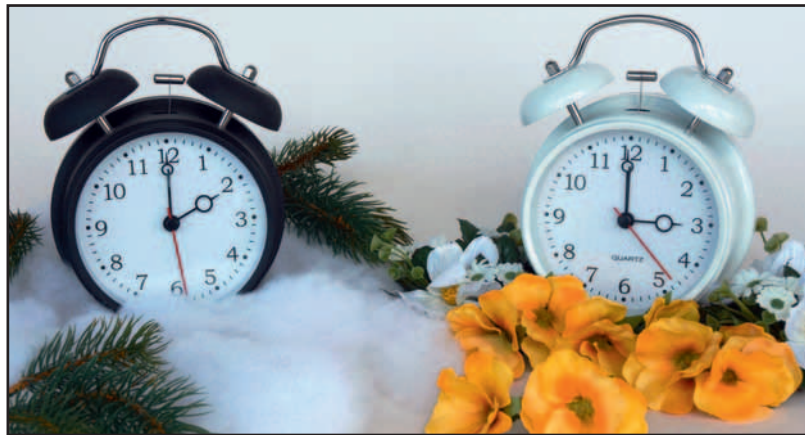
Am 26. März beginnt wieder die Sommerzeit.

Das ist natürlich lange nicht so einfach, da ich daraus nichts in Kartons packen kann. Es gelingt mir jedoch immer, wenn ich einen Spaziergang durch die Natur, zum Beispiel unserem schönen Poensgenpark