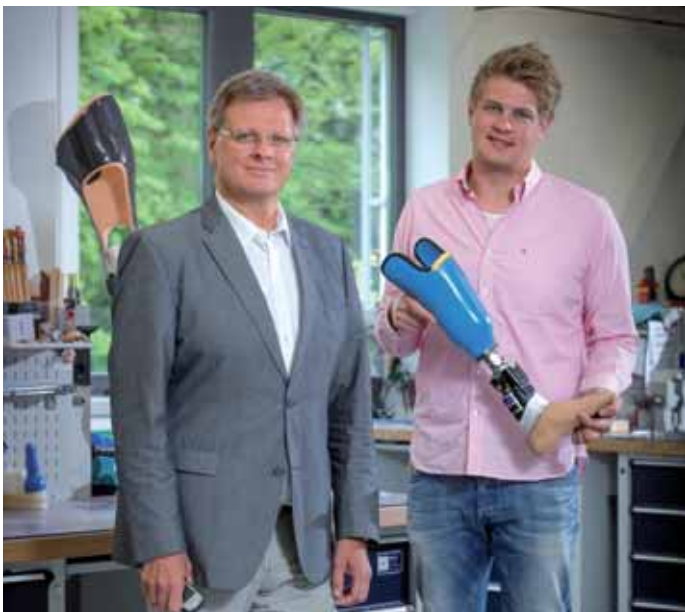
22 Das Sanitätshaus Curt Beuthel steht für Gesundheitstechnik auf Höchstniveau.