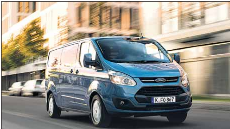
Abbildung zeigt Wunschausstattung gegen Mehrpreis.

LTP Litschka GmbH & Co. KG Blumentalstr. 1b 42859 Remscheid Telefon: 02191 710 33 E-Mail: info@litschka.com Internet: www.litschka.com