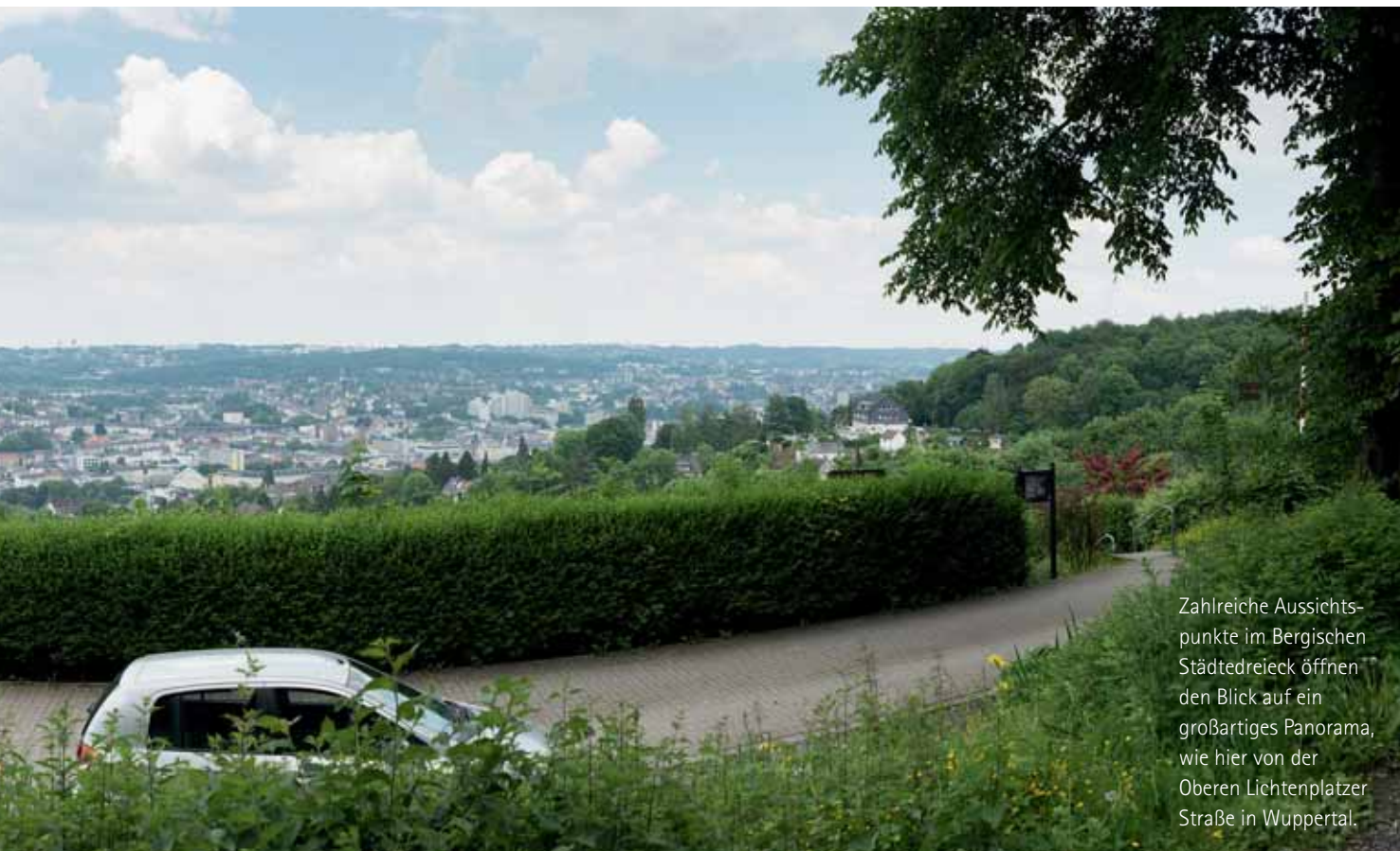
Zahlreiche Aussichtspunkte im Bergischen Städtedreieck öffnen den Blick auf ein großartiges Panorama, wie hier von der Oberen Lichtenplatzer Straße in Wuppertal.

Ein großes Stück des Wupperwegs, der 2005 unter der Leitung des Wupperversbands entstanden ist, führt durch die Region des Bergischen Städtedreiecks und verbindet Solingen, Wuppertal und Remscheid miteinander. Entlang des Flusslaufs steht das Erlebnis Natur im Mittelpunkt und bringt Wanderfreunden den Lebensraum vieler Tiere und Pflanzen näher. Wer das Stadtzentrum von Wuppertal kennenlernen möchte, muss den offiziellen Weg kurz vor Sonnborn verlassen und sich weiterhin an dem Flussbett orientieren. Wem es für eine Wanderung oder Erdbeerpflücken zu heiß ist, sollte sich auf den Weg in das einzige Freibad im Elberfelder Stadtzentrum machen. Das Freibad Mirke bietet in einem 80 Quadratmeter großen selbstgebauten Becken, das im leeren Hauptbecken steht, Abkühlung inmitten von einladendem Grün. Eins der ungewöhnlichsten Freibäder Deutschlands öffnet zum Planschen, Spielen und Toben mittlerweile in der zweiten Saison. Der gemeinnützige Verein „Pro Mirke e.V.“ belebt das 165-jährige Bad seit fünf Jahren als Bürgerpark mit Veranstaltungen; langfristig planen die Ehrenamtler, die Anlage zu sanieren und zum ersten chlorfreien Naturbad im Bergischen Städtedreieck umzuwandeln: „Inmitten von dichter Bebauung ist dies hier einer der wenigen inner-