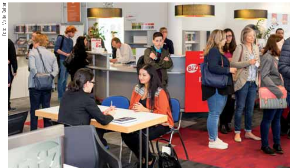
Großer Andrang herrschte beim IHK-Tag der Ausbildungschance in Wuppertal und Solingen.

i Über die verbliebenen freien Stellen informiert die IHK auch mit einer Telefon-Hotline unter 0202 2490-832. Allein in der IHK-Lehrstellenbörse ( www.ihk-lehrstellenboerse.de ) sind derzeit noch 264 freie Ausbildungsplätze zu finden.