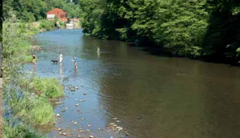
Wozu verreisen, wenn es vor der eigenen Haustür so viel zu entdecken gibt: (v.l.n.r. und o.n.u.) „Abhängen“ im Uni-Hängemattenpark, planschen und toben im „Pool-im-Pool“ des Mirker Freibads, während einer Motorradtour in der Kohlfurth einkehren, Industriegeschichte in der Textilstadt Wülfig

Hardt-Park in der kleinstädtischen Idylle von Remscheid-Lennep verbringen. Unter hundert Jahre alten Bäumen und neben dem duftenden Rosengarten findet sich der ideale Ort für ein gemütliches Picknick. Einen Perspektivwechsel von der Innenzur Aufsicht auf das viele Grün des Städtedreiecks ermöglichen die zahlreichen Höhen im Bergischen Städtedreieck. Es gibt etliche Aussichtspunkte, die sich für einen Stopp eignen. Einen besonders tollen Blick ins Wuppertaler Tal hat man von der Oberen Lichtenplatzer Straße aus. Der einzigartige Weitblick erfasst die Stadt mit seinen ganzen Eigenarten und präsentiert nach Sonnenuntergang ein großes Lichtermeer. Empfehlenswerte Aussichtspunkte gibt es auch auf Solinger Stadtgebiet. Unter anderem zwischen dem Coppel-Park und der Bergbahntrasse. Auf der Anhöhe kann man den Blick bis nach Remscheid und Cronenberg schweifen und den Blick fliegen lassen.