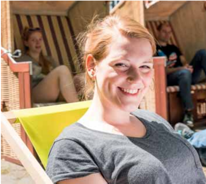
10 Titelthema „Urlaub vor Ort“: Die besten Geheimtipps in der Region.