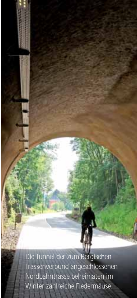
Die Tunnel der zum Bergischen Trassenverbund angeschlossenen Nordbahntrasse beheimaten im Winter zahlreiche Fledermäuse.