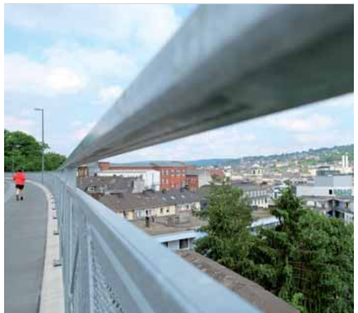
28 Schwerpunkt: Ob mit dem Fahrrad oder zu Fuß, die Bergischen Trassen vernetzen das Städtedreieck und Nachbargebiete aktiv miteinander.