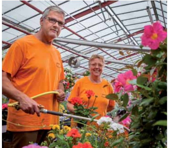
16 Bei der Gärtnerei Uellendahl treibt die Pflanzenwelt bunte Blüten.