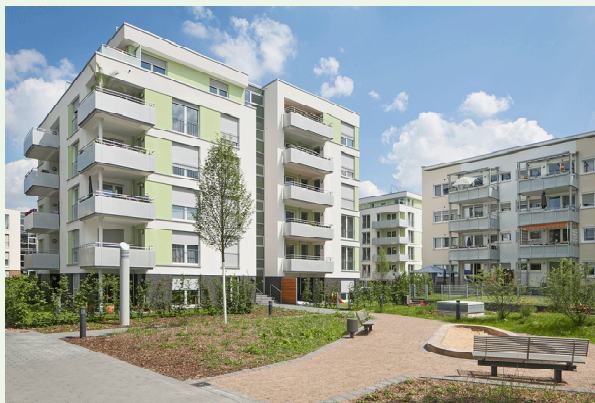
Klimaschutzsiedlung Garath. Bild: HGMB Architekten.

Die neuen fertiggestellten Häuser der „Klimaschutzsiedlung“ setzen die Weiterentwicklung des Stadtteils nun konsequent fort. Sie bildet als straßenbegleitende Bebauung den Kopf einer bestehenden, aber inzwischen energetisch sanierten „Plattenbausiedlung“ der Rheinwohnungsbau GmbH. Die vier neu errichteten Punkthäuser sind bis zu sechs Geschossen hoch und verfügen über insgesamt 65, zum Teil geförderte Wohnungen und ersetzen vier sieben-geschossige Laubenganghäuser, die, im Gegensatz zu den niedrigeren „Plattenbauten“, nicht mit vertretbarem Aufwand zu modernisieren waren.