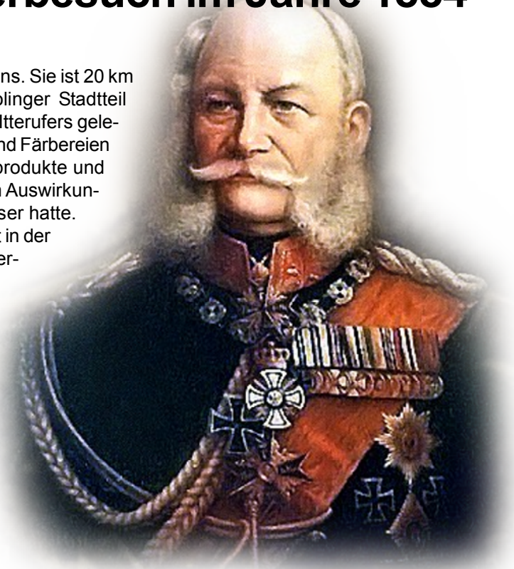
Portrait Kaiser Wilhelm I.

„Aus früherer Zeit ist mir nämlich bekannt, daß der Itterbach und die damit in Verbindung stehenden Teiche p. p. innerhalb des Schloßparks durch Abwässer von Fabriken und anderen gewerblichen Anlagen aus der Nähe von Benrath in sehr schlimmer Weise verunreinigt werden. Umfangreiche und kostspielige Räumungsarbeiten in Parkgewässern haben infolgedessen schon vorgenommen werden müssen. Die Übelstände, namentlich die gefährlichen Ausdünstungen, wiederholten sich aber immerfort, so daß die Besorgnis nahe liegt, das Schloß und der Park werden dadurch auch während der Hofhaltung im September d. J. in sehr bedenklicher Weise beeinträchtigt werden, wenn nicht bis dahin energische Maßregeln zur gänzlichen Beseitigung der Ursachen jener Mißstände ergriffen werden [...] Dringend zu wünschen [...] ist es daher, daß der Termin des Aufhörens der schädlichen Fabrikausflüsse auf eine frühere Zeit – spätestens den 1. Juli - verlegt wird, damit von da ab bis zum September noch die eben nötigen Ausräumungsarbeiten in den Parkgewässern vorgenommen werden könnten. Die Königliche Regierung wird, wie ich annehmen darf, gleich mir von der Rücksicht geleitet sein, den Allerhöchsten und Höchsten Herrschaften während des Aufenthaltes in Benrath auch den Besuch des Parkes zu ermöglichen und zu verhindern, daß schlechte Ausdünstungen der Gewässer sie davon zurückhalten.