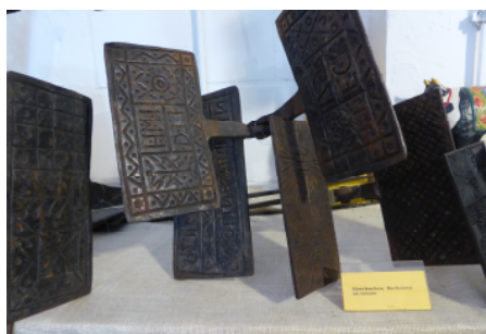
Zangeneisen, die älteste Form des Waffeleisens

Im frühen 13. Jahrhundert verbreitete sich die Waffel in Frankreich und es entwickelte sich eine eigene Zunft der Waffelbäcker. Zwei Jahrhunderte später war die Waffel in ganz Mitteleuropa bekannt. Je nach Region erhielt die Waffel unterschiedliche Bezeichnungen. So nannte man sie in Hamburg „Eisen-Brot“, in Süddeutschland kannte man sie unter den Namen „Hohlhippen“ oder „Hollippen“ und in Frankreich erhielt sie die Bezeichnung „Gaufres“. Im 16. Jahrhundert unterschied man bereits zwei Formen der Waffel: den dünnen, knusprigen „Eisenkuchen“ und die weiche Waffel.