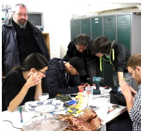
Experten bei der Arbeit.