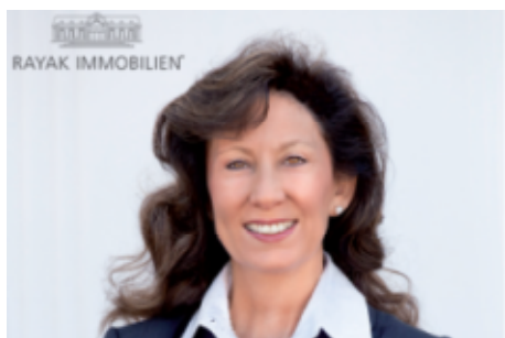
Angelina Rayak © Rayak Immobilien

Immobilien gelten als optimale Altersvorsorge und sind eine anerkannte Rentenabsicherung. Vor allem, wenn ihre Besitzer rechtzeitig über den Umgang mit ihnen im Alter nachdenken. Dabei sollte eine zentrale Frage im Mittelpunkt für alle kommenden Entscheidungen stehen: Passt die Immobilie noch zum persönlichen Leben?