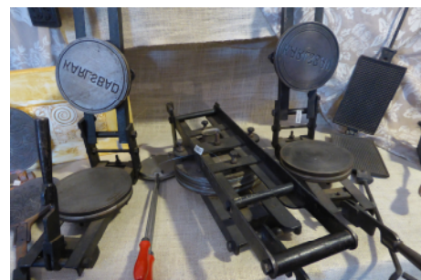
Etwa 60 Jahre altes Oblateneisen

Rückblickend war das Backen der Waffeln nicht nur eine anstrengende und mühevoll Tätigkeits, sondern auch eine kostspielige Angelegenheit, denn das Anfertigen der Waffeleisen erfolgte durch einen Schmied und die Zutaten für die Waffeln waren teuer. Die nicht alltägliche Arbeit des Waffelbackens ist daher der Grund, dass man diese überwiegend vor Festtagen herstellte. Alten Aufzeichnungen ist zu entnehmen, dass zum Backen der Waffelkuchen tagelange Vorbereitungen erforderlich waren. Täglich wurden die „Doofkohlen“ aus dem „Doofketel“ genommen und für die Zeit des Backens aufgespart, weil sie nur wenig rauchten. Im Doofketel wurde nämlich das Feuer für den nächsten Tag zur Nacht in Asche aufbewahrt. Der Backvorgang erforderte darüber hinaus eine genaue Kenntnis in der Handhabung der schweren Eisen.