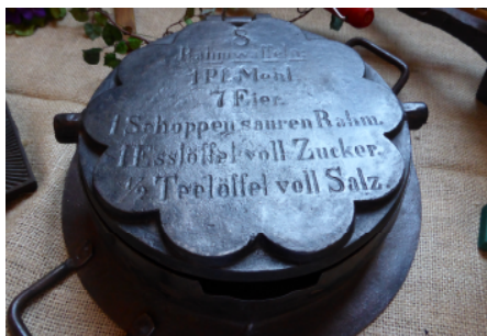
Klappisen mit Waffelrezept

sen sein. Wer mal ein altes Waffeleisen in die Hand genommen und längere Zeit waagrecht gehalten hat, der weiß warum.