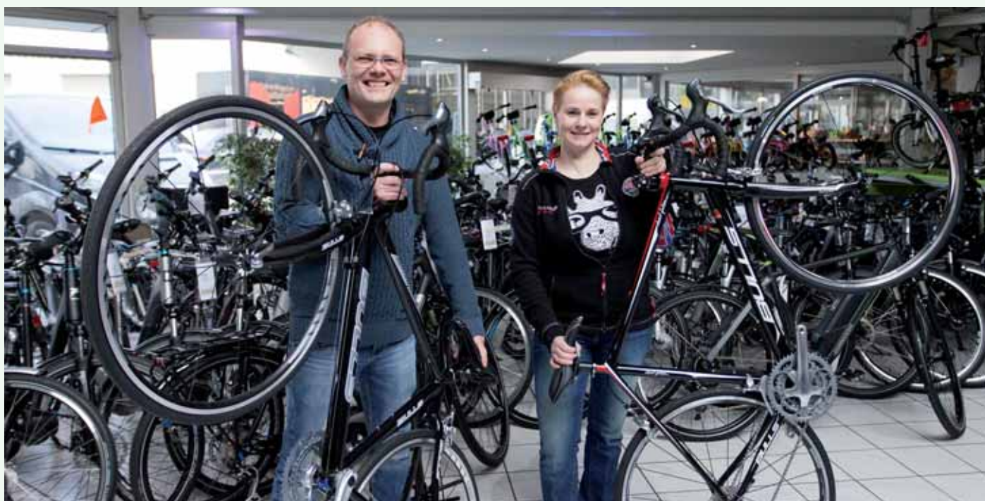
Zweirad Legewie: Ausbilder und Auszubildende.