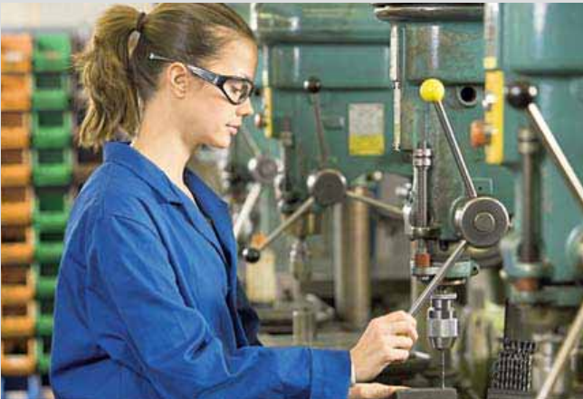
Ein grenzüberschreitender Arbeitsmarkt schafft neue Perspektiven.

schen Wirtschaft in Köln vor allem in den sogenannten Engpassberufen, in technischen Berufen und im Gesundheitswesen, qualifizierte Arbeitskräfte. Der demografische Wandel lässt die Suche auf dem heimischen Arbeitsmarkt immer häufiger erfolglos enden. Insofern ist der Schritt zur Personalsuche im Ausland nur konsequent. Diese erfordert jedoch entspre-