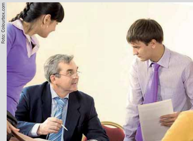
Kurzfristige Personalausfälle sowie Produktions- und Auftragschwankungen sind Gründe für die Nutzung der Zeitarbeit.

Die Beratungsgesellschaft KVP Consulting aus Münster geht in Anbetracht der für die deutschen Leitbranchen projektierten Wirtschaftsprognose auch für das laufende Jahr von einer konstanten Entwicklung der Beschäftigtenzahlen in der Zeitarbeit aus. Derweil erwarten die Consultants, dass die Anzahl der Verleihbetriebe im Zuge der sich zunehmend verschärfenden gesetzlichen Regelungen perspektivisch zurück gehen