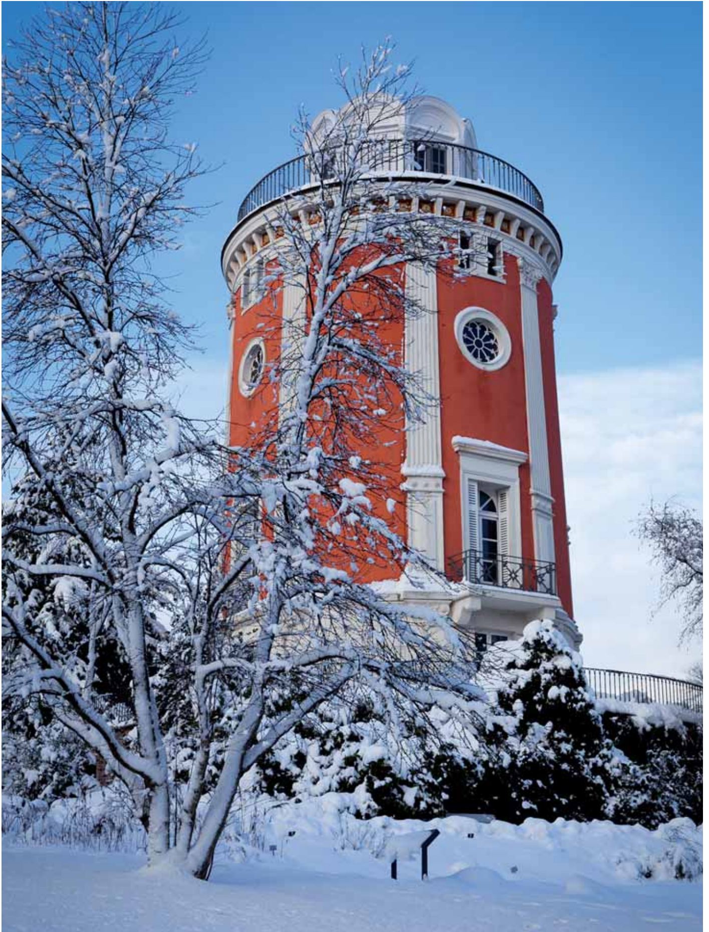
In diesem Winter ein seltenes Bild: Der Elistenturm auf der Wuppertaler Hardt im Schnee.