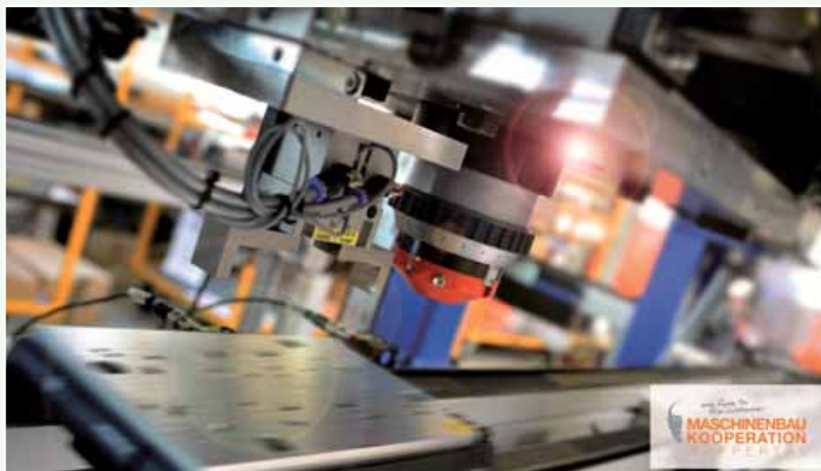
Sondermaschine: Produktion von Hydrolagern

Es ist schon eine recht heterogene Gruppe, das Maschinenbaunetzwerk. Zu Anfang waren es sieben, jetzt sind es mittlerweile 22 kleine und größere Unternehmen, die sich für Austausch und Synergien zusammengefunden haben – vom Kleinbetrieb bis hin zum Unternehmen mit 250 Angestellten, aus den Branchen Maschinenbau, Metallverarbeitung, Sondermaschinenbau und Werkzeugbau. Maschinenbau im Bergischen ist eine hochspezialisierte Branche, die sich analog zu den Produkten der Region entwickelt hat: Schneidwaren, Werkzeuge und Automotive. Das macht den Maschinenbau im Städtedreieck einzigartig, und das darf auch eigentlich durchaus stärker in die Öffentlichkeit gebracht werden.