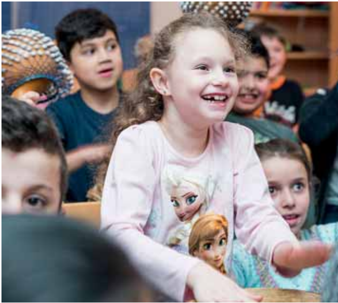
8 Titelthema: Das intensive gemeinnützige Unternehmensengagement im Bergischen realisiert sich oft auch in Stiftungen.