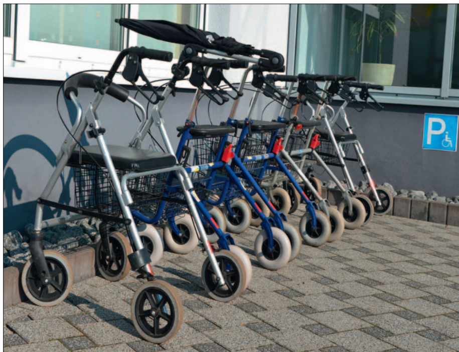
Der Rollator ist für viele Senioren mittlerweile ein unentbehrliches Hilfsmittel im Alltag geworden.

Unbestritten ist, dass ein Rollator das Leben im Alter ungemain erleichtern kann. Deshalb nimmt die Zahl der Rollatoren auch ständig zu. Die Vorteile liegen auch klar auf der Hand: Man fühlt sich sicherer, kleinere Einkäufe lassen sich gut verstauen, man hat überall die Möglichkeit, eine Pause zu machen, sich