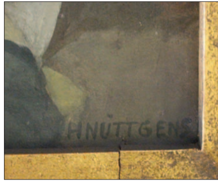
Das Bild ist signiert mit „H. Nüttgens“ und hat die ungefähren Maße 175 x 120 cm.

Bekanntere Beispiele für das künstlerische Schaffen Nüttgens in der Umgebung sind St. Anna in Lintorf, St. Agnes in Angermund und die Kreuzwegstationen in St. Max in der Altstadt von Düsseldorf. St. Peter und Paul wurde