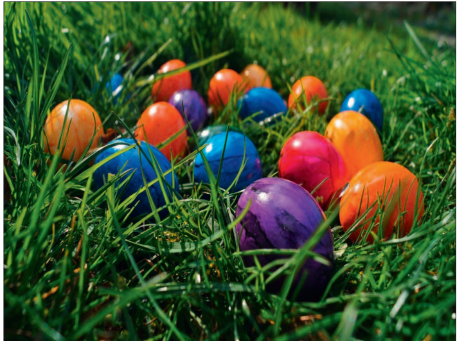
Ostern und bunte Eier gehören untrennbar zusammen.

In der Vorosterzeit verwandelte ich etwa ein Stück Rasen am Wegrand in einen bunten Garten. Ich legte kleine Blumenbeete an und verband sie mit schmalen Wegen. In der Mitte grub ich kleine Mulden, die ausgeschmückt zu Osternestern wurden – schließlich sollte der Osterhase sich freuen. Für die Vorbereitungen hatte ich keine Gartengeräte. Vermutlich