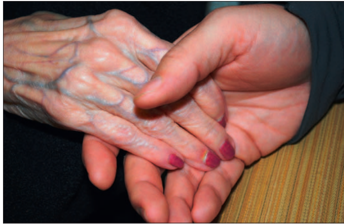
Die Palliativ- und Hospizversorgung soll gestärkt werden.

Kritiker befürchten eine Kriminalisierung der Ärzte, weil