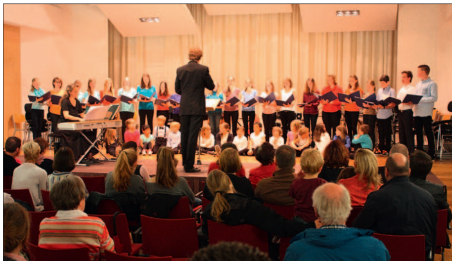
Ob am Tag der offenen Tür oder bei vielen anderen Gelegenheiten: Ein Besuch in der Musikschule lohnt immer.

Gleich mit mehreren Attraktionen wartet die Städtische Musikschule Ratingen im zweiten Quartal auf: Zum einen mit dem musikalisch spannenden Wettbewerb um die begehrten Sparkassen-Förderpreise samt dem dazu gehörenden Preisträgerkonzert, zum anderen mit dem Tag der offenen Tür, bei dem die Musikschule ihr gesamtes Spektrum präsentiert. Und schließlich findet am dritten Juni-Wochenende der bundesweite „Tag der Musik“ statt, an dem zahlreiche musikalische Darbietungen unter anderem in Ratinger Kirchen vorgesehen sind. Aber auch die übrigen Angebote lohnen immer einen Besuch und bieten einen unterhaltsamen Einblick in das musikalische Können des Ratinger Nachwuchses. Die Veranstaltungen sind wie üblich kostenlos! Hier alle Termine auf einen Blick: