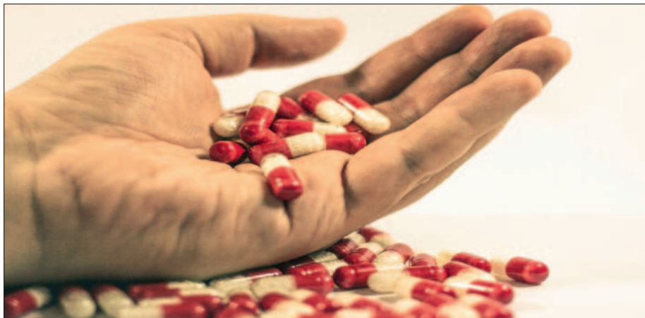
Geschäftsmäßige Förderung des Suizids bleibt verboten.

Ethische Gewissensentscheidungen sind im Einzelfall jedoch weiter möglich. Zudem soll die Hospiz- und Palliativversorgung besser finanziert und gestärkt werden.