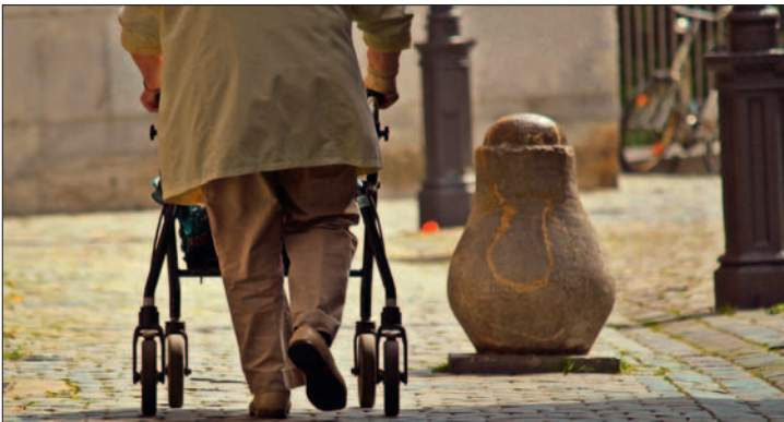
Der richtige Umgang mit dem Rollator kann auf dem Rollortag am 10. Juni geübt werden.

Der Seniorenrat der Stadt Ratingen hat eine neue Homepage: www.ratingen-seniorenrat.de Unter dieser Adresse ist die Interessensvertretung der Ratinger Senioren im Internet zu finden. Auf der Homepage werden alle aktuellen Mitglieder des Seniorenrates vorgestellt und auch ihre Arbeitsschwerpunkte beschrieben. Ebenso werden die Gremien und Arbeitskreise aufgeführt. Ein Überblick über sämtliche städtischen Seniorentreffs in Ratingen samt Adressen, Öffnungszeiten und Kontaktmöglichkeiten ist ebenfalls auf der Internetseite zu finden. Aufgeführt werden auch die Termine der nächsten Sitzungen des Seniorenrates. Der Kalender wird noch aktualisiert. Natürlich kann auch die Seniorenzeitung „Aus unserer Sicht“ über die Homepage aufgerufen und gelesen werden. (JD)